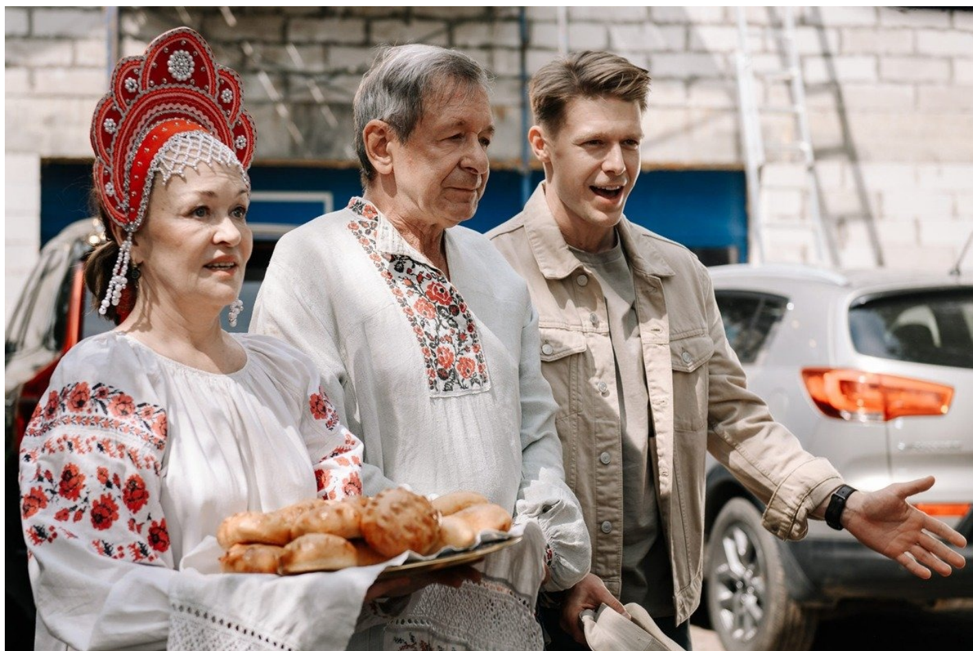
Кадр из сериала «Между нами химия».

В итоге получается кино не про химиотерапию и про «химию» между близкими. Про триумф жизни и ее хрупкость, про зыбкие миражи, из которых шьют паруса надежды. Даже когда надеяться не на что.