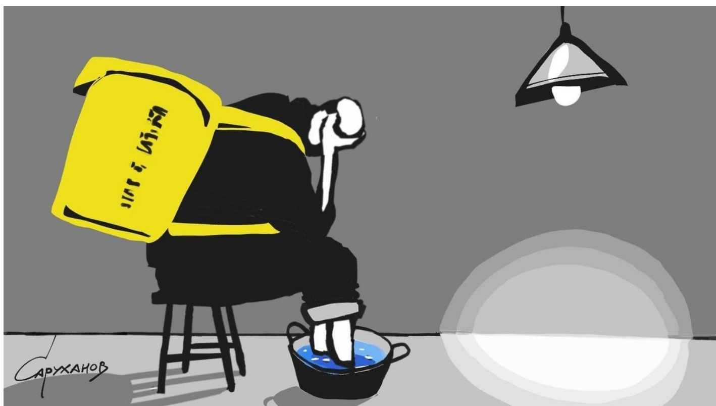
Иллюстрация: Петр Саруханов / «Новая газета»

Вы Лысого знаете? Ну ясно, не знаете. Мало ли лысых русских мужиков 36 лет, пропесоченных жизнью, битых обо все ее углы, гонявшихся за фантомами обогащения