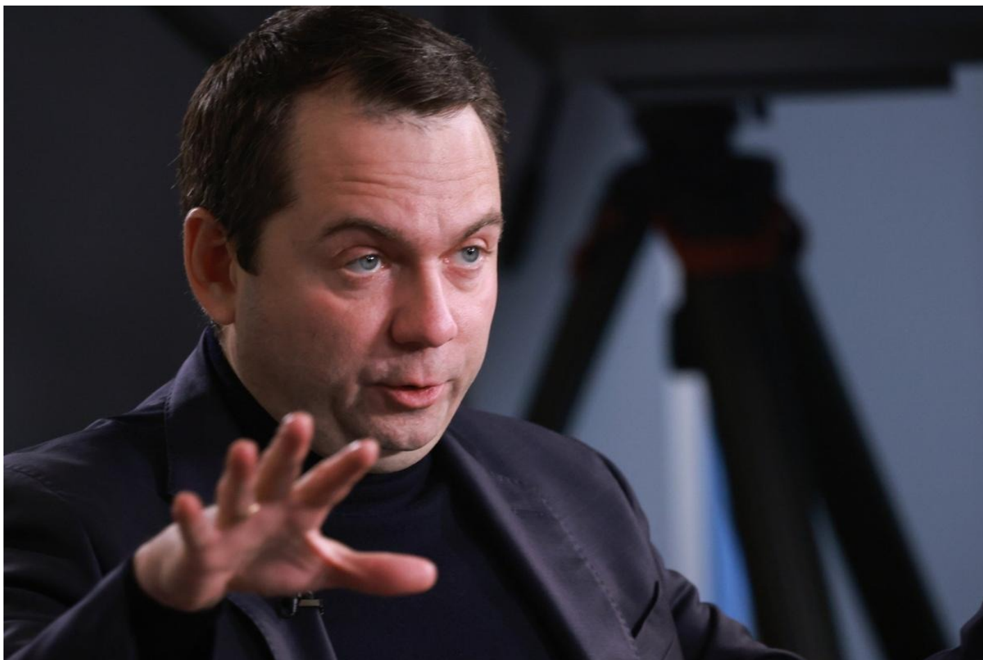
Губернатор Мурманской области Андрей Чибис.

В качестве примера вспоминают опыт Архангельска, где ради форума мостили деревянные тротуары, а все гостиницы в округе были выкуплены. А когда форум перенесли в Петербург, это стало ударом по местному бизнесу. Предприниматели понесли убытки, и гостиница, построенная специально к мероприятию, едва не оказалась на грани банкротства.