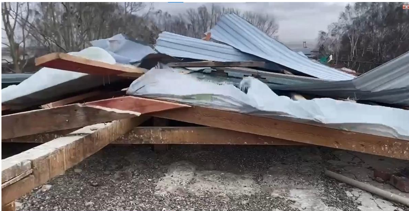
Сорванная школьная крыша.

Вернемся в Красноярск. На улицу Северо-Енисейскую. Там половина крыши жилого многоэтажного дома подлетела и рухнула, покалечив мужчину, переломав балконы и автомобили во дворе. В прошлом году при подобных обстоятельствах — шквалистом ветре — сносило другую часть крыши, на второй половине дома. Тогда отремонтировали лишь разрушенную половину.