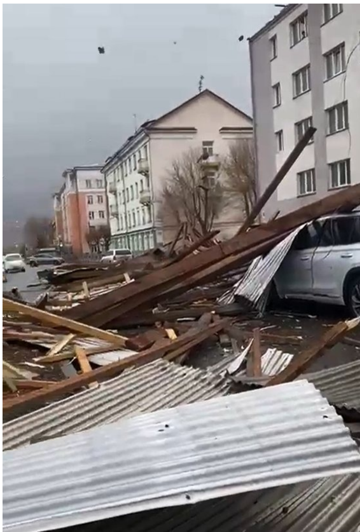
Рухнувшая крыша 14-го общежития СФУ.

Слушал объяснения мастера, и почему-то вспомнились другие шпильки. На Саяно-Шушенской ГЭС, где катастрофа случилась 15 лет назад. Правительственная комиссия по расследованию ее причин тогда много говорила о шпильках, которые должны были удерживать турбину, но вдруг отказались. Устали. Дело, конечно, было не только в том, что механики не обтягивали шпильки и не ставили гайки, просто дальнейшие причины можно было уже не перечислять.