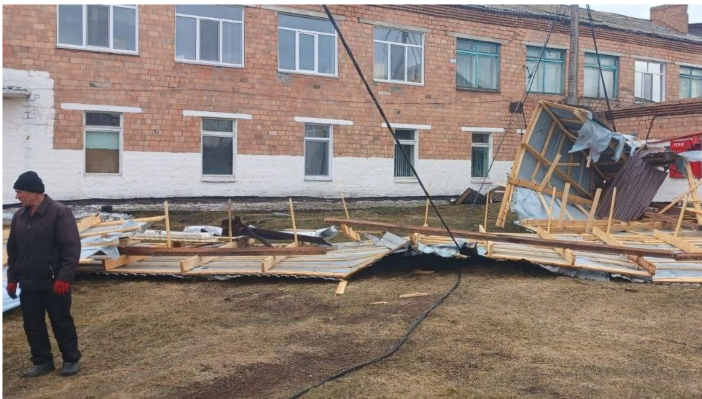
Сорванная школьная крыша.

Как такое стало возможно над Красноярском и почему кровля летает там, где ее ремонтируют