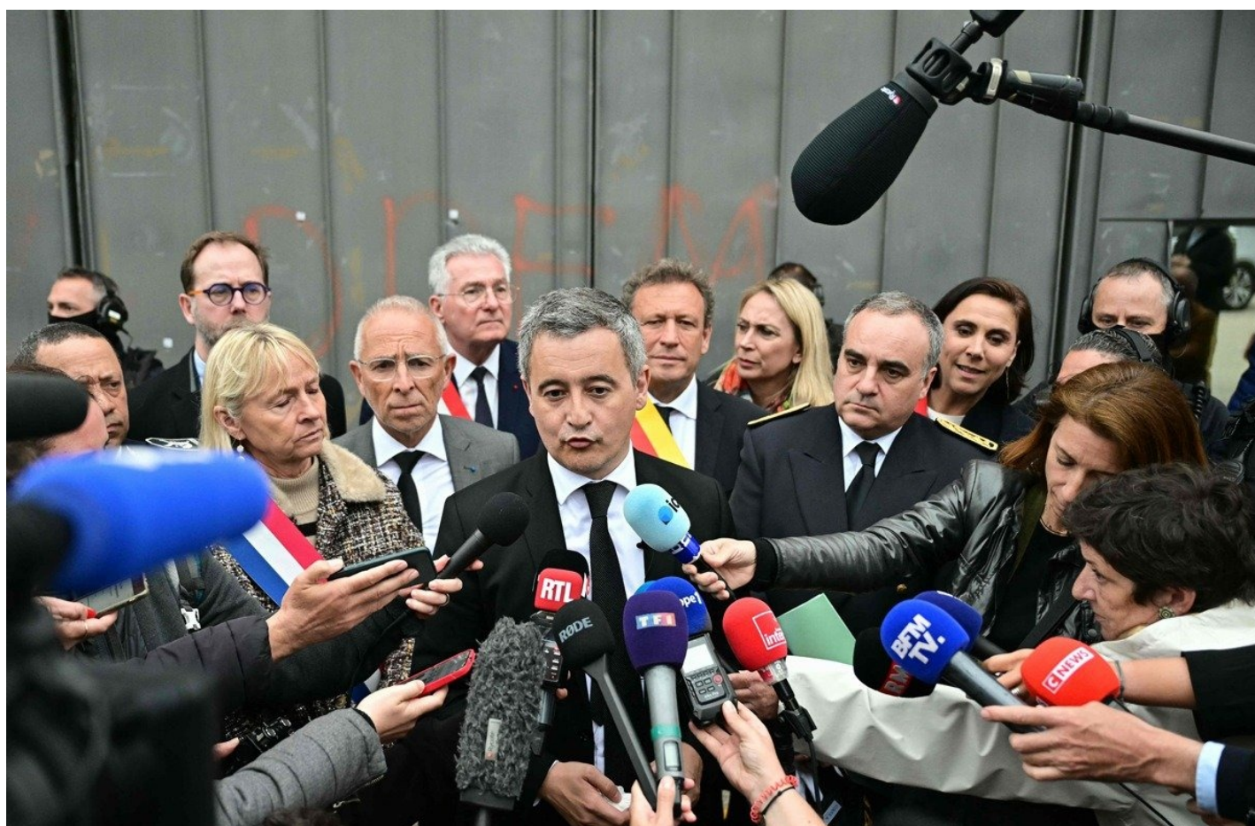
Министр юстиции Франции Жеральд Дарманен беседует с прессой после своего посещения тюрьмы в Тулоне, 15 апреля 2025 года.

Министр юстиции Жеральд Дарманен посетил во вторник по горячим следам тюрьму в Тулоне, чтобы «выразить поддержку» пенитенциарной администрации после обстрела из автомата.