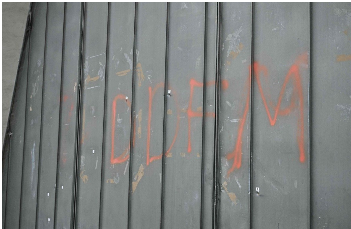
Следы от пуль и аббревиатура DDFM на двери тюрьмы в Тулоне.

Согласно данным «судебных и пенитенциарных органов», на которые ссылается газета Le Parisien , лидеры организованной преступности страшно обеспокоены планами открытия осенью 2025 года на севере страны двух «зон повышенной безопасности» (в первую очередь для «деятелей» наркоторговли) — в Ванден-ле-Вьей (департамент Па-де-Кале) и Конде-сюр-Сарт (Нормандия). Около ста первых самых опасных заключенных в ближайшее время пройдут оценку для возможного перевода в эти новые зоны.