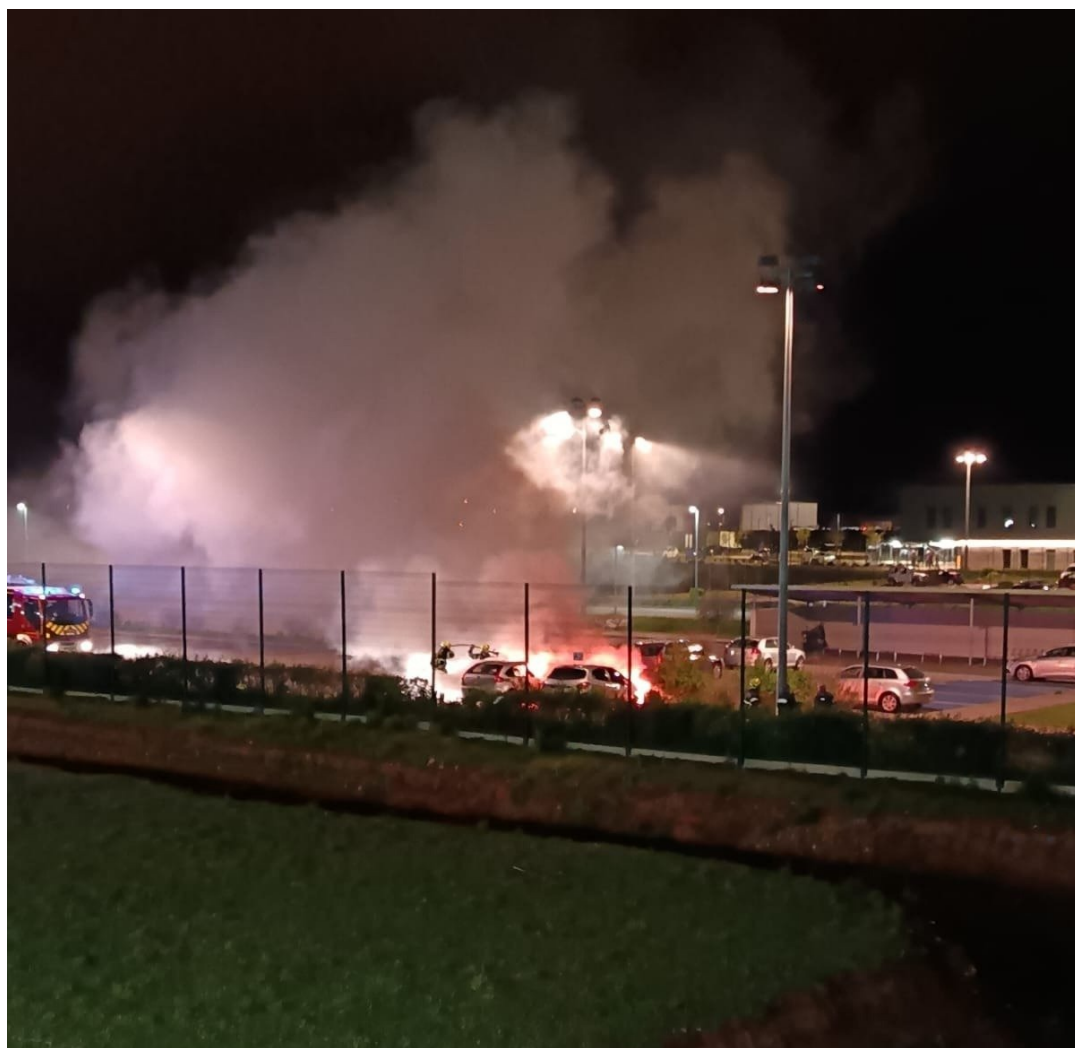
Горящие машины на парковке, 13 апреля 2025 года.

Как пишет France-Presse, PNAT обосновала свое решение, сославшись на «выбранные цели», «скоординированный характер» атак и «цель серьезного нарушения общественного порядка <...>, как заявляет в социальных сетях группа под названием DDPF.