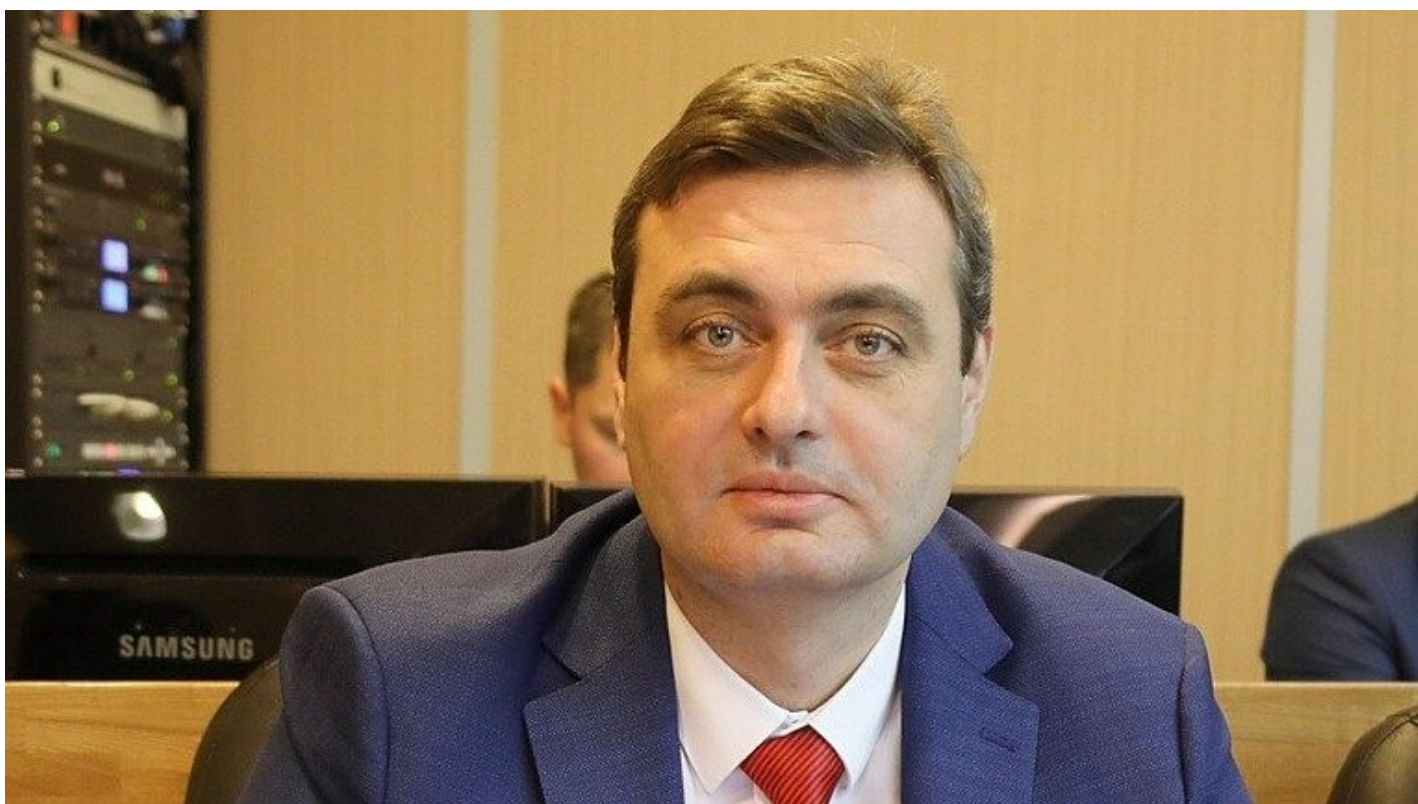
Артем Самсонов.

Во Владивостоке экс-депутат Самсонов, приговоренный к 13 годам, доказывает факт политического преследования. Такое в РФ впервые