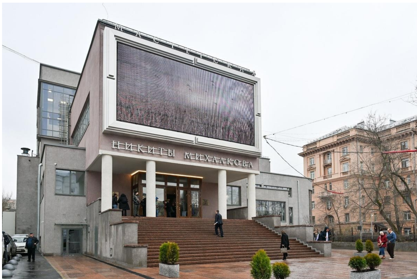
Здание театра «Мастерская 12» Никиты Михалкова.

Прочитала в местном паблике интересное сообщение. Оказывается, у остановки на Садовом кольце изменилось название. Бывшая «Кудринская площадь» нынче именуется «Кудринская площадь, «Мастерская «12» Никиты Михалкова». Названия остановки из шести слов — большой эксклюзив. К пышным титулам Никиты Сергеевича можно добавить еще один — гений места. Закончу колонку и пойду полюбоваться своими глазами новым чудом московской локации.