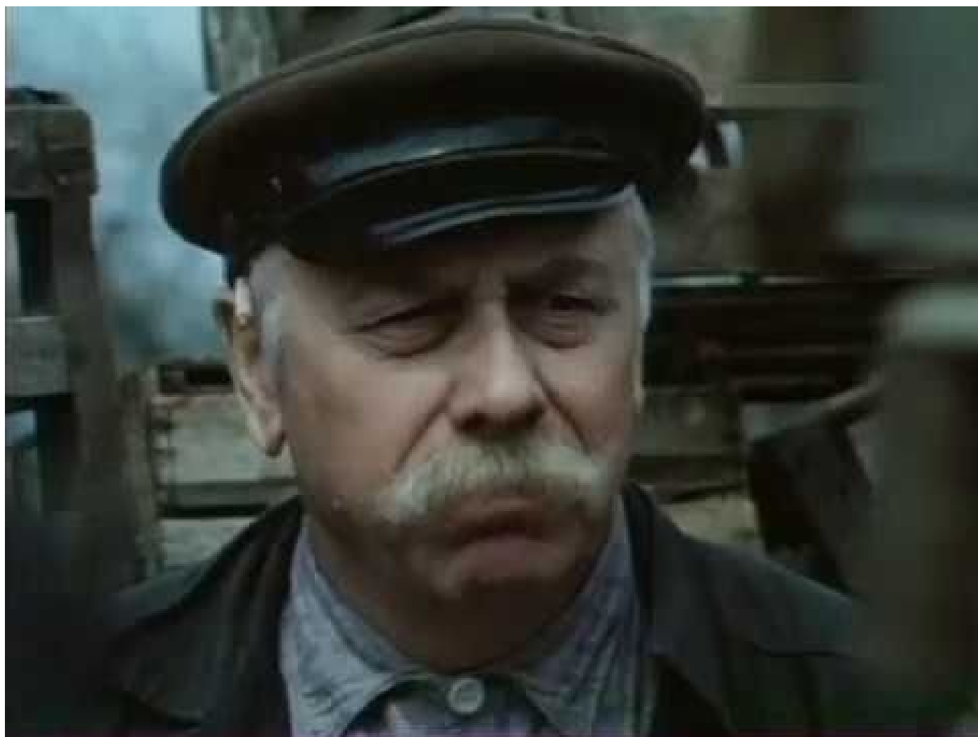
Кадр из фильма «Иван»