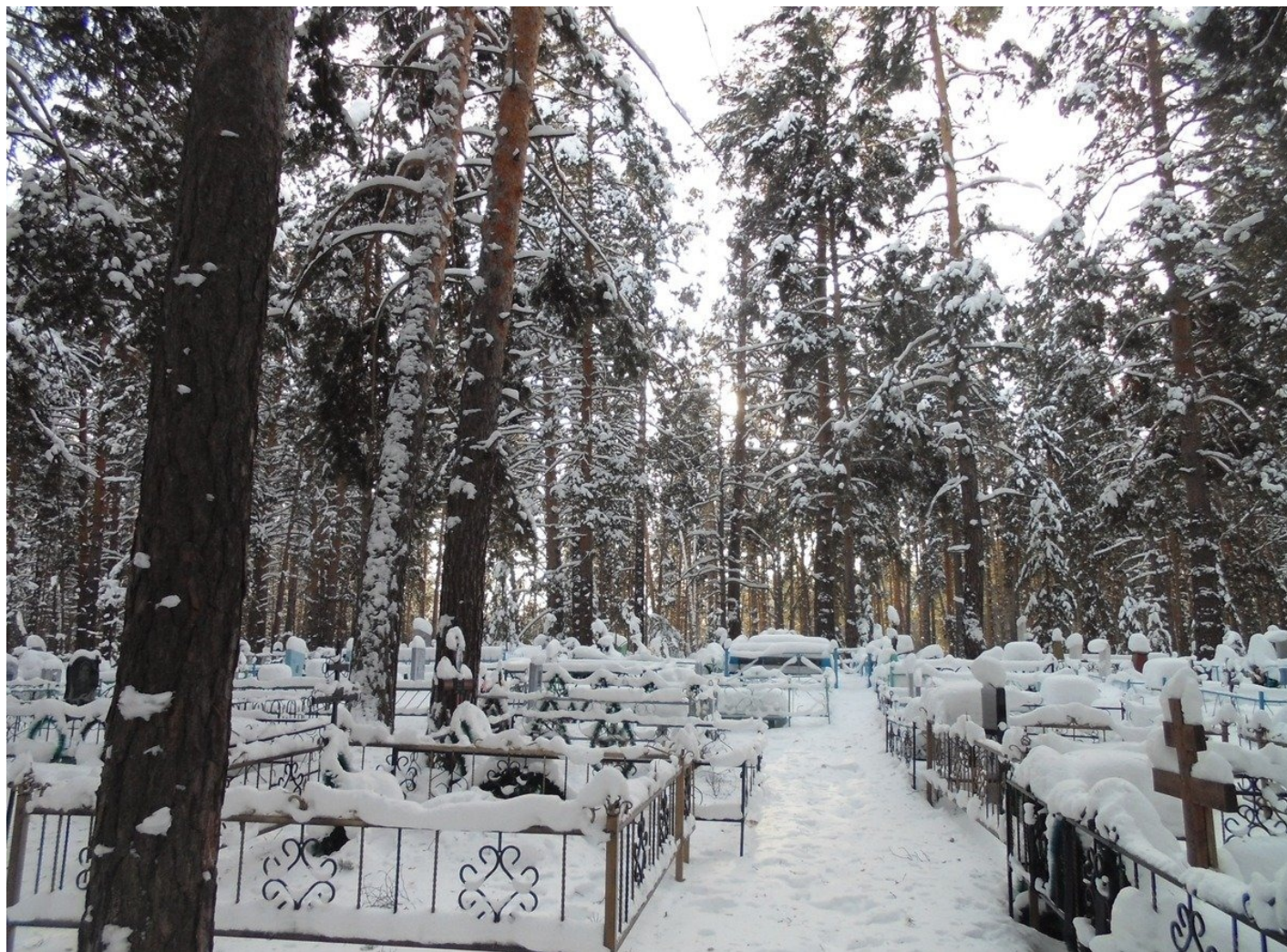
Курган, кладбище, январь 2016 года.