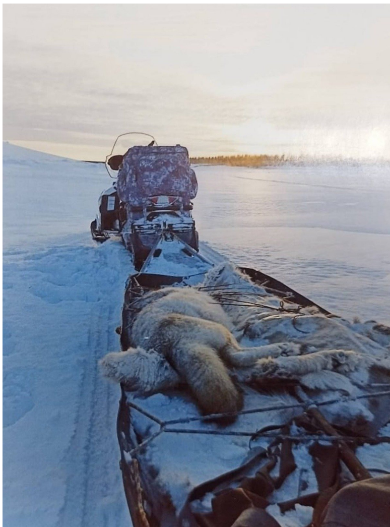
Убили волка.

...Проходит время. Трапезников, был такой и есть, слава богу, человек, — в 70-х он, главный механик Иркутского завода радиоприемников, на все плюнул, уехал в верховья Лены и остался в Чанчуре (крохотная, недоступная без проводника деревня, от тех мест, от Замы, недалеко — по прямой по карте 53 км). Это тот самый, к кому подходил Распутин Валентин Григорьевич, а он косит траву. «Можно с вами поговорить?» — «Ты заходи попозже, будет время, так уделю». (Распутин потом снова и снова туда приезжал, это он написал: «Если можно сказать, что остались на свете еще райские уголки, то один из них — Чанчур».)