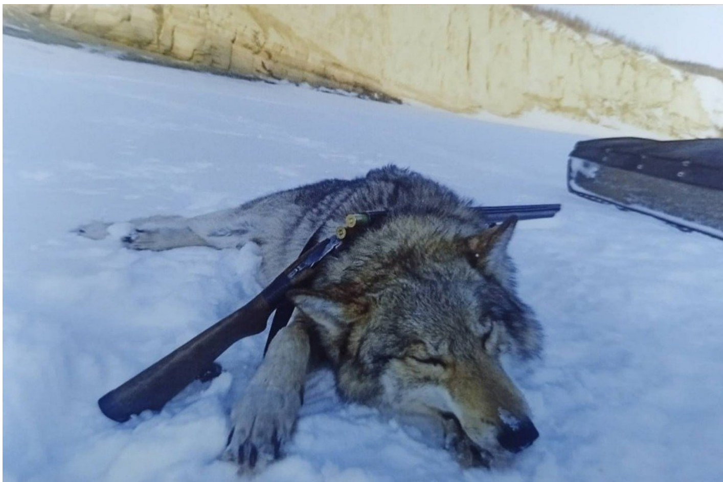
Убитый волк.

На этом — конец рассказу моего товарища и строгим фактам. Потому что закрученный в колечко хвост того волка еще ни о чем не говорит. Да, это отличительный признак гибрида волка и лайки, у такого волкособа даже отдельное имя есть — волэнд. Но ни мой товарищ, ни я своими глазами того волчару не видели. И потом, где доказательство, что он сын той самой Дружбы?