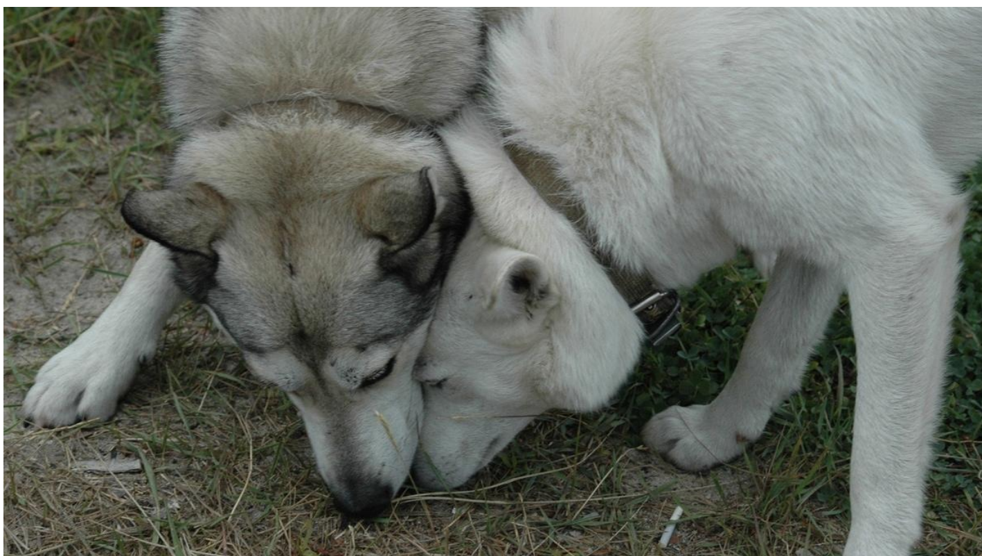
Сибирские лайки. Байкал.

Легализация живодерства — это процесс, и развязка его неочевидна. За утоплением Муму последовал уход Герасима от барыни и ее смерть