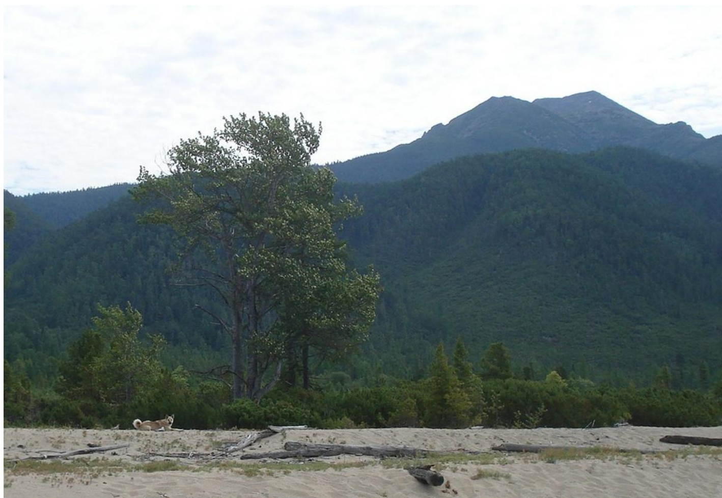
Байкальский берег. Неизвестная и бездомная лайка.

Все знают, как мучаются собаки, когда хозяева их здесь оставляют. Советские люди, учившиеся в советской школе и смотревшие советское кино, твердо знали, как надо: Гитлер прежде, чем убить себя, отравил цианистым калием свою овчарку Блонди (еще, говорят, и ее щенок Вольфа, но про это заговорили позже). Кто-то, вероятно, предположит, что и у Гитлера была душа, и он ее не предал.