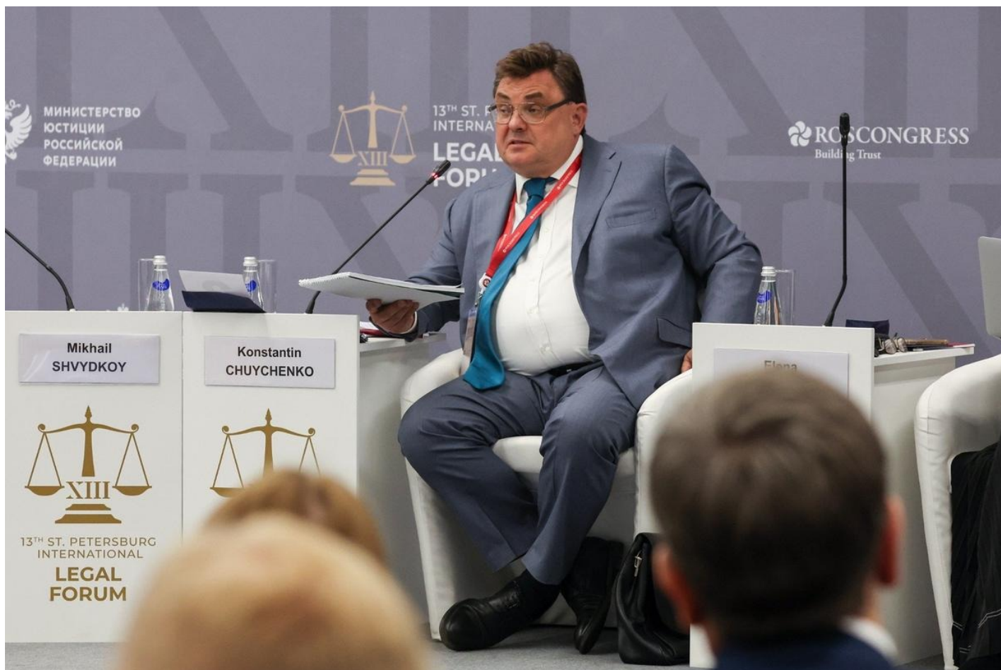
Константин Чуйченко на XIII Петербургском юридическом форуме.

На этот раз форум стал бенефисом Министерства юстиции. Министр Константин Чуйченко, оставив позади даже главу СК — самого Александра Бастрыкина, дежурно рассуждавшего о мигрантах, признал «субъектами иностранного влияния» декабристов и выразил мнение, что царь Николай наказал их недостаточно сурово. В рамках сессии «Иностранное вмешательство: уроки истории» от Чуйченко досталось и Герцену, и народолюбцам, чьими именами названы многие улицы не только в Санкт-Петербурге.