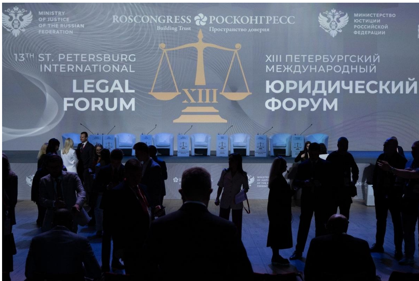
XIII Петербургский международный юридический форум.

Участники прошедшего в Санкт-Петербурге XIII Международного юридического форума (официальная аббревиатура: ПМЮФ) четко, как прошедшее и будущее, разделились на две группы согласно плану его мероприятий. В группу «будущего» вошли в основном молодые, с иголки одетые, циничные главы юридических фирм, обслуживающих бизнес. «Прошедшее» же было представлено не первой молодости истеблишментом «правоохранительных» ведомств, включая СК, Минюст и, к сожалению, Конституционный суд и даже МИД.