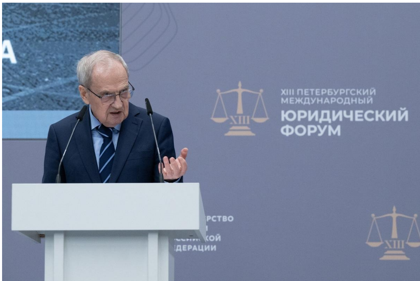
Валерий Зорькин.

О коррупции как явлении Зорькин рассуждал с историческими примерами и вполне здраво, пока не связал ее российский вариант с «планом Даллеса» по всяческому развращению советского народа. Проблема в том, что «план Даллеса» (директора ЦРУ с 1953 года, при том что «план» датируется 1945-м), скорее всего, представляет собой фальшивку — компиляцию из советской литературы «про шпионов». Архивы тех лет в США полностью рассекречены, но сколько-то похожего источника в них найти никому не удалось.