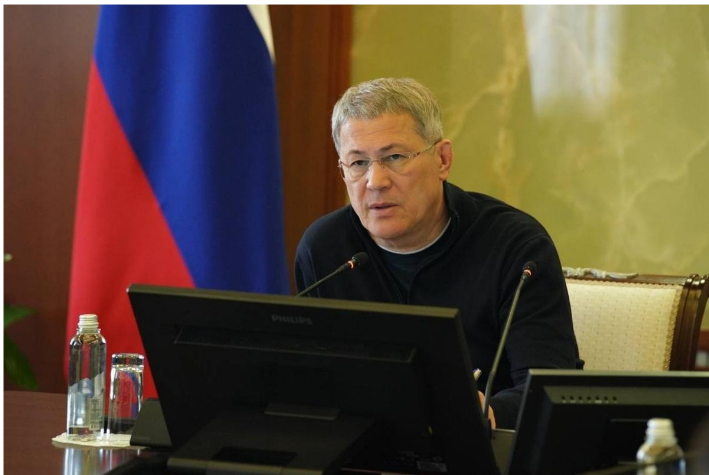
Радий Хабиров.

Глава Башкортостана Радий Хабиров подтвердил, что добыча полезных ископаемых не нанесет урон озеру Якты-куль, а хребет Крыктытау никак не пострадает. Хабиров подчеркнул экономическую целесообразность разработки и напомнил, что лицензии на геологоразведку выдает федеральное ведомство.