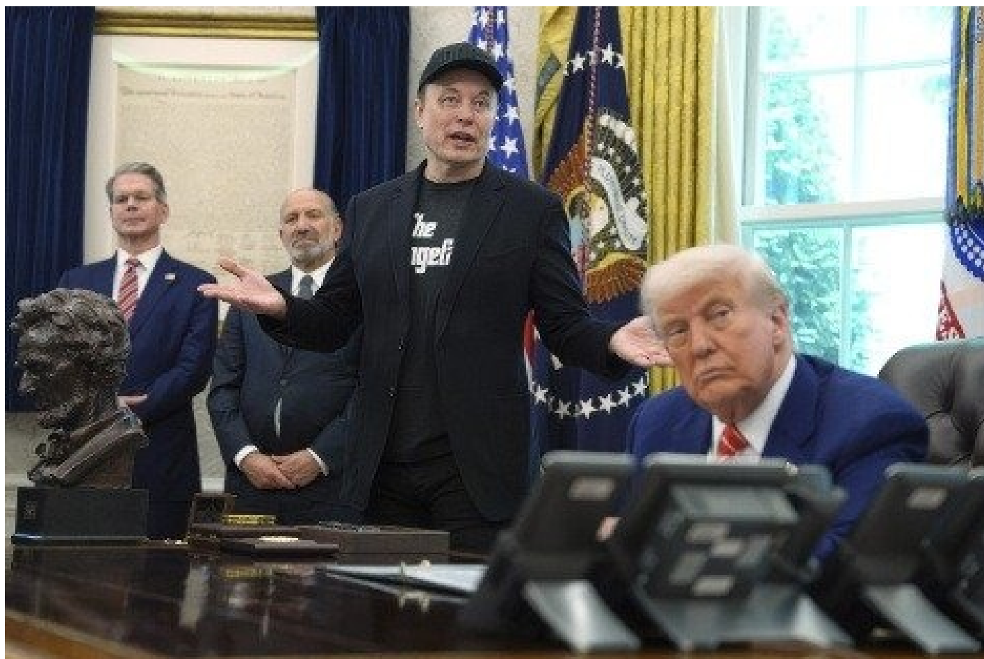
Илон Маск и Дональд Трамп.

Обвинение в связи Трампа с серийным преступником, обвиненным в организации торговли людьми и организации секс-вечеринок с малолетками, покончившим с собой в тюрьме при неясных обстоятельствах в 2019 году, стало «ошеломляющим ударом», пишет вашингтонское издание The Hill, известное своими связями с инсайдерами из близкого круга президента. В четверг Маск воспользовался возможностью, чтобы напомнить своим подписчикам о цитате Трампа в профиле Эпштейна в журнале New York более двух десятилетий назад. «С ним очень весело. Говорят даже, что ему нравятся красивые женщины так же, как и мне», — сказал тогда Трамп.