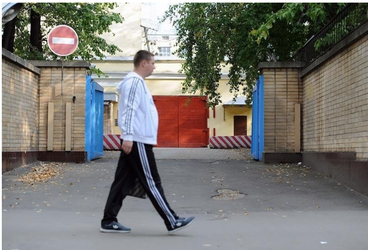
Следственный изолятор (СИЗО) №2 «Лефортово».

Некоторые из близких были в курсе, что он противник спецоперации. «У него сейчас позиция такова, что он осознанно делал переводы фонду. Он вряд ли мог отдавать себе отчет, что это может быть опасно. Ведь в начале СВО не было очевидно, что это какое-то преступление. Тогда все, куда и кому угодно, перечисляли донаты», — уточнил Роман.