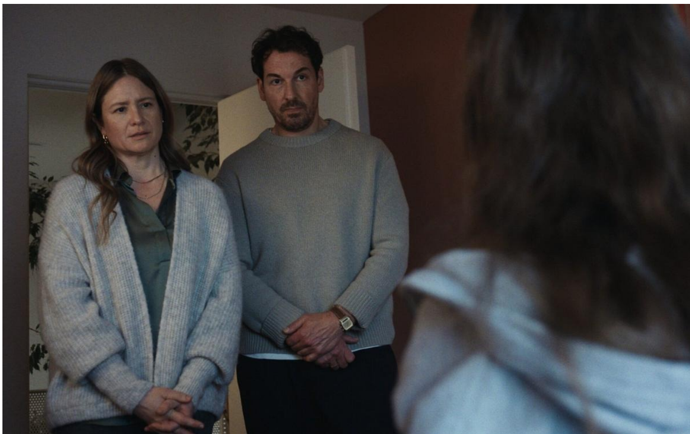
Кадр из фильма «Что знает Мариэль»

Во многих семьях родители следят за своим детьми, устанавливая в их телефонах специальные программы, а в комнате малышей — камеры и радионяни. Идея фильма и родилась в тот момент, когда Хамбалек впервые увидел в доме у друзей чуткую радионяню. Но в интригующем мысленном эксперименте этот сюжет меняется на противоположный: подросток не просто следит за родителями, но становится их совестью, с которой непросто договориться, зеркалом их истинных неприглядных «Я». При этом непогрешимый родительский авторитет трещит по швам. И кто тут взрослый — для авторов большой вопрос (особенно когда родители обсуждают: не стоит ли дочери снова вкатить пощечину, чтобы ее «вылечить»?)