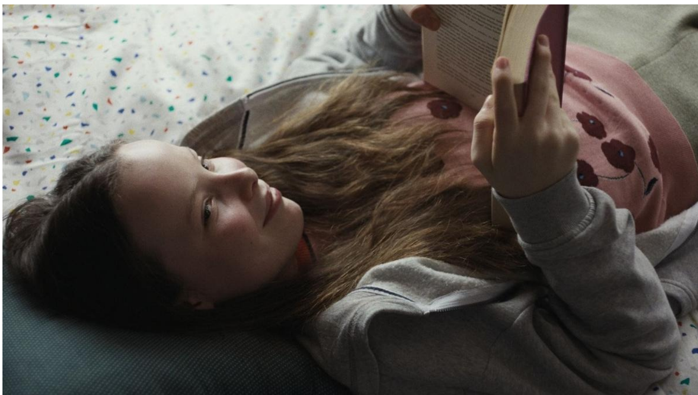
Кадр из фильма «Что знает Мариэль»

На экраны выходит «Что знает Мариэль» — любопытная скандинавская сатирическая параболa