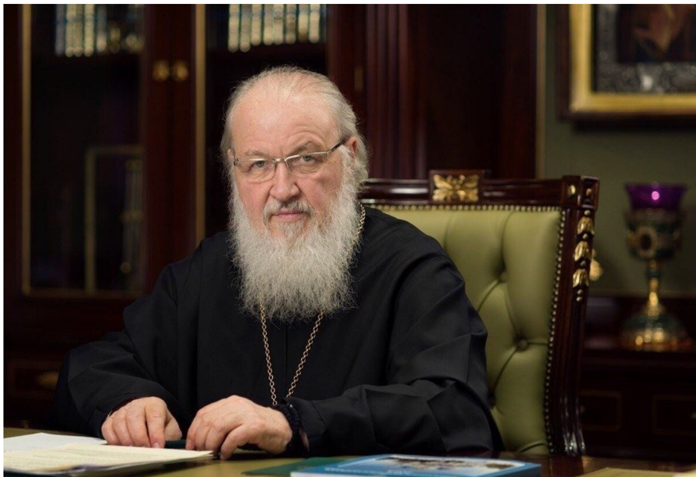
Патриарх Кирилл.

«Некоторые считают, что приправить таким словцом свое повествование, свой текст вовсе не плохо, а, наоборот, хорошо. Это глубочайшая ошибка.