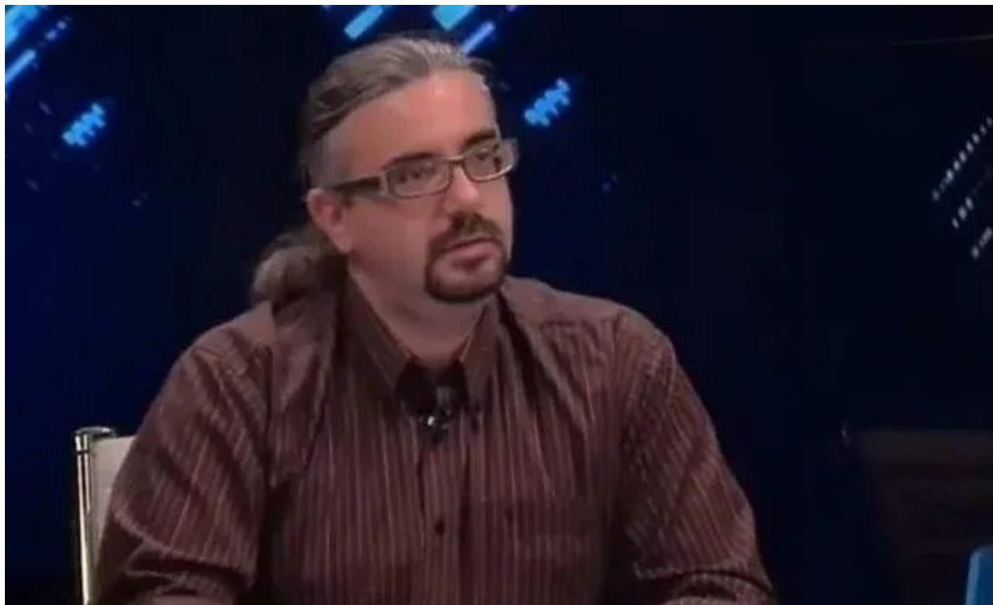
Михаил Бородин.

— Был ли у иранской оппозиции шанс воспользоваться ситуацией? Что она вообще собой представляет?