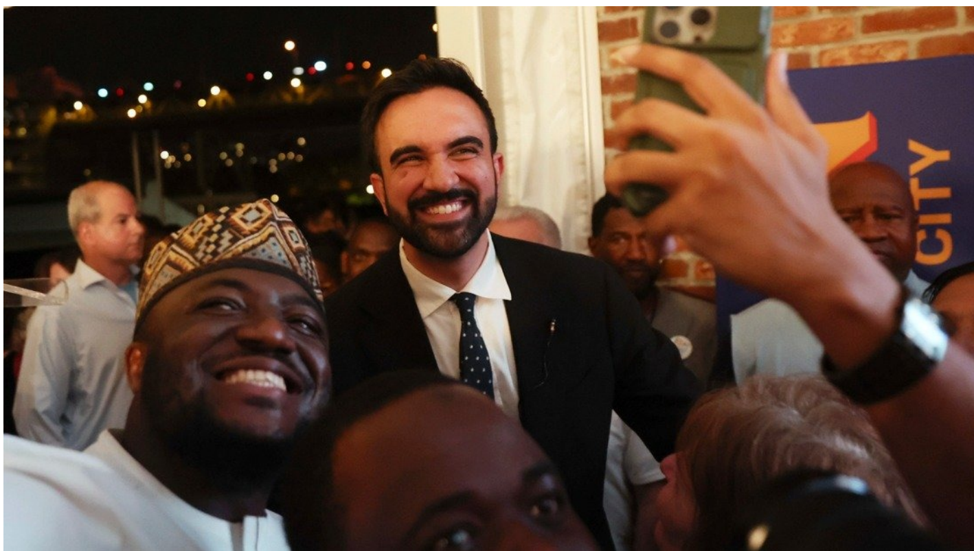
Кандидат на пост мэра Нью-Йорка Зохран Мамдани.

Кто такой Зохран Мамдани — кандидат в мэры Нью-Йорка от демпартии