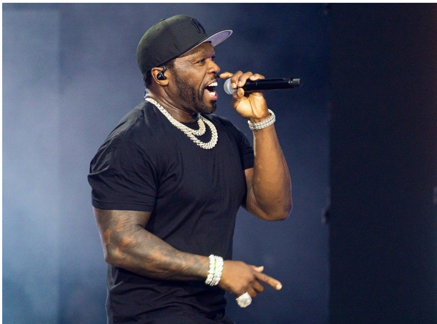
Рэпер 50 Cent.

Зато Мамдани сильно помогла адская жара, из-за которой на выборы не явилось много стариков, не так благоволящих программе Мамдани, как молодежь, подарившая ему победу.