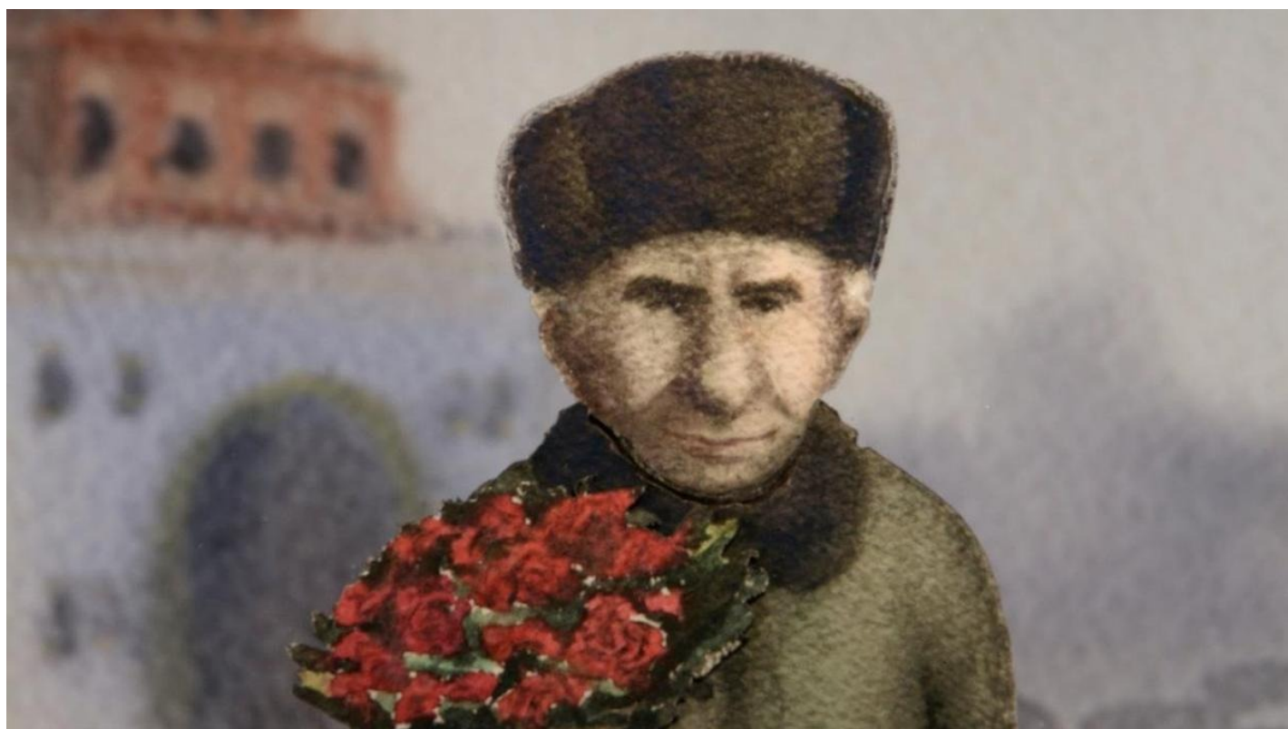
Кадр из фильма о драматурге Александре Володине «Ненаписанная пьеса»

Фильм о драматурге Александре Володине «Ненаписанная пьеса» вызревал долго. Однако его прокатная судьба пока кажется печальной