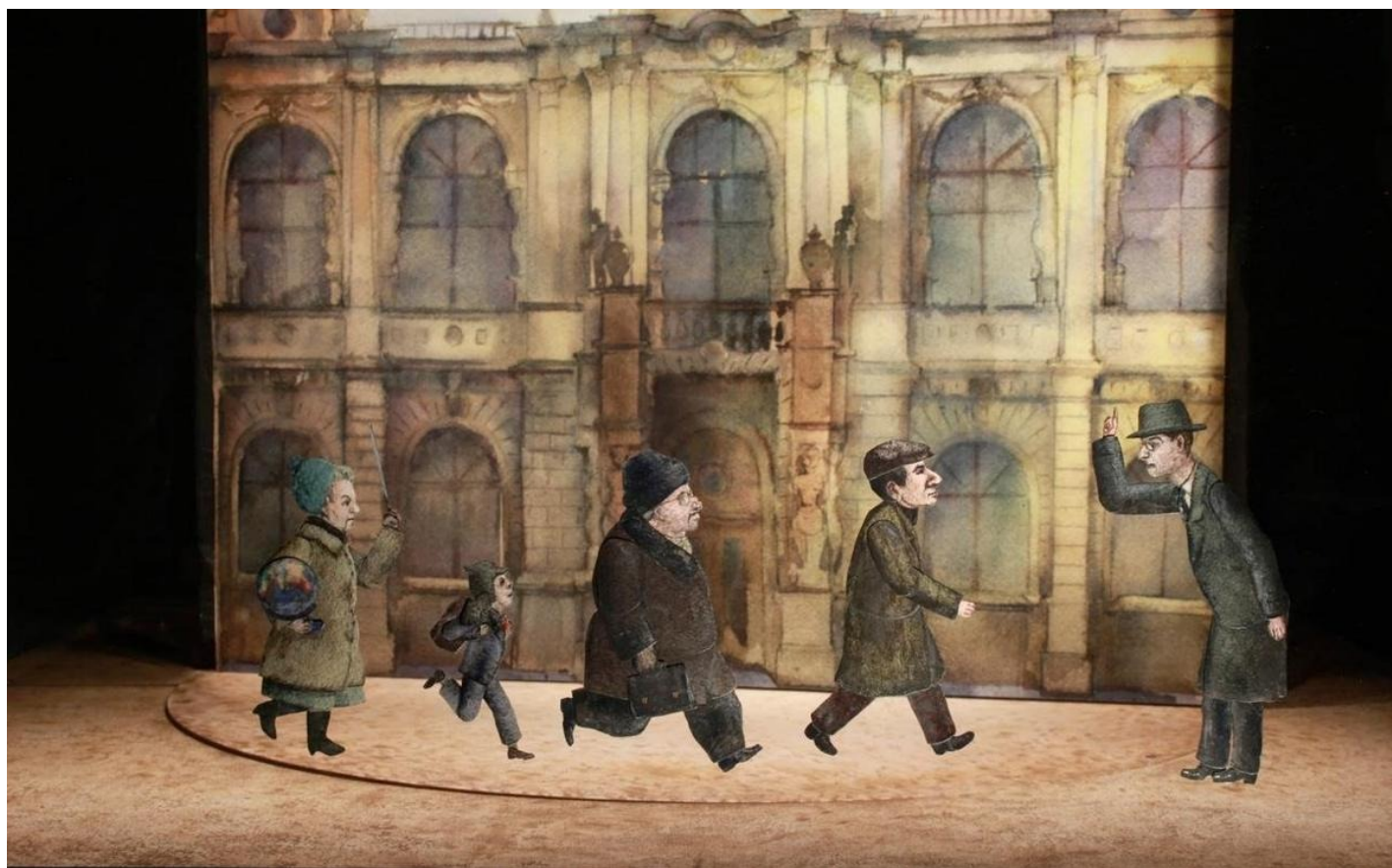
Кадр из фильма «Ненаписанная пьеса»