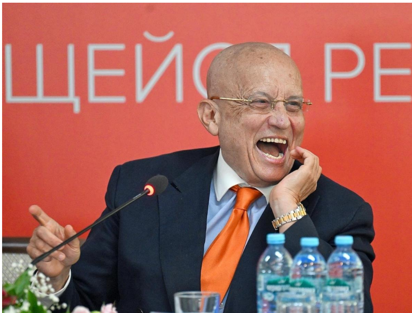
Сергей Караганов во время заседания XXXII Ассамблеи Совета по внешней и оборонной политике.

Старая новая русская идеология с ее несуществующими «традиционными ценностями» требует пошлого пафоса и повторения задов «Русской идеи», перемешанной со сталинизмом, как в «Кодексе россиянина» и докладе «Царьграда». Для установления всех этих «кодексов» и «образов будущего» почему-то нужно репрессировать все гражданское общество внутри страны и вести боевые действия. Иначе не получается у русского мессианства. Старая новая русская идеология невозможна без врагов внутри и снаружи Русского мира и соответствующего языка ненависти.