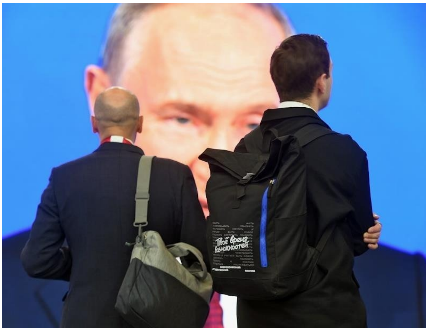
В архаичном обществе спектакля человек не просто играет роль, а сливается с персонажем.

Это относится, в первую очередь, к сценаристам и режиссерам ролевой игры. Чтобы быть убедительными и заставить как можно больше людей поверить в создаваемые ими образы и истории, они должны поверить в них сами и максимально проникнуться собственным спектаклем. А поскольку в этом спектакле они занимают самое центральное и престижное место — как творцы и вдохновители, — то поверить в подобное положение вещей для нарциссического сознания будет лишь в удовольствие.