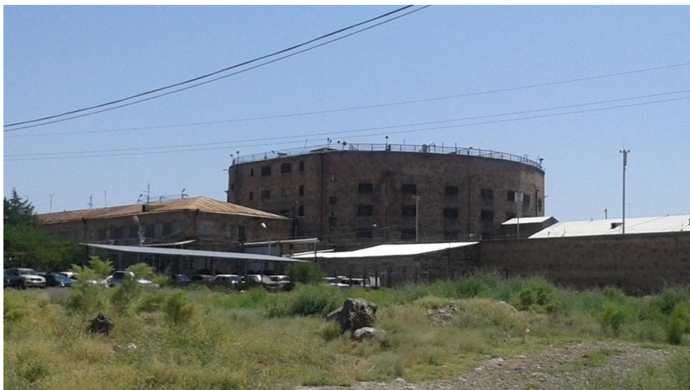
Пенитенциарное учреждение «Нубарашен».

В Армении стремительно ветшают СИЗО и тюрьмы. Это, впрочем, не мешает отправлять туда даже женщин с грудными детьми