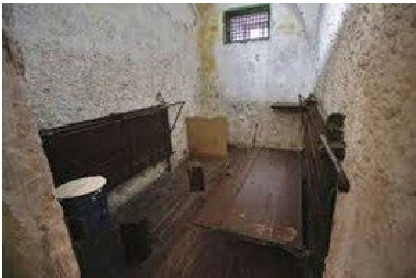
Фото из письма, отправленного бывшим заключенным адвокату З. Постанджян

При этом уголовно-исполнительная служба (УИС) Министерства юстиции Армении официально опровергла сообщения о «нечеловеческих условиях» содержания Лианы Арутюнян и ее ребенка в изоляторе. По данным ведомства, камера полностью отремонтирована, в любое время суток доступна горячая вода. Для ребенка предоставлено необходимое питание: картофельное пюре, овощи и сухое молоко.