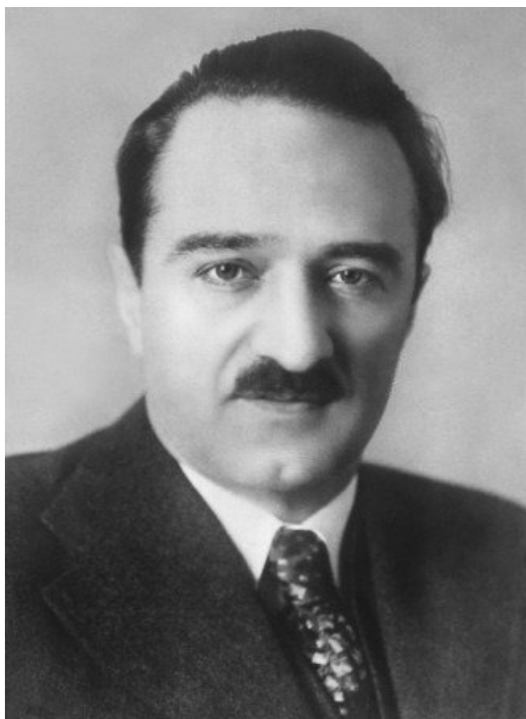
Анастас Микоян.

Улицы имени Анастаса Микояна в Ереване нет, даже памятника нет — несмотря на то, что он был одним из ключевых фигур советской власти, героем Карибского кризиса и даже, по оценке западной прессы, «величайшим дипломатом XX века».