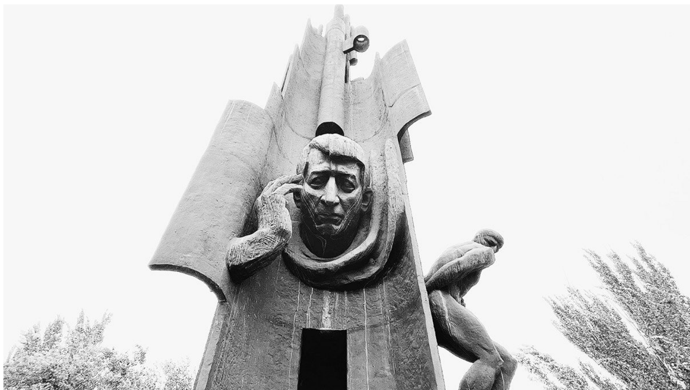
Памятник Егише Чаренцу. Скульптор Никогайос Никогосян.

Репрессии в Советской Армении — больше, чем просто террор. Это рана, которую так и не долечили