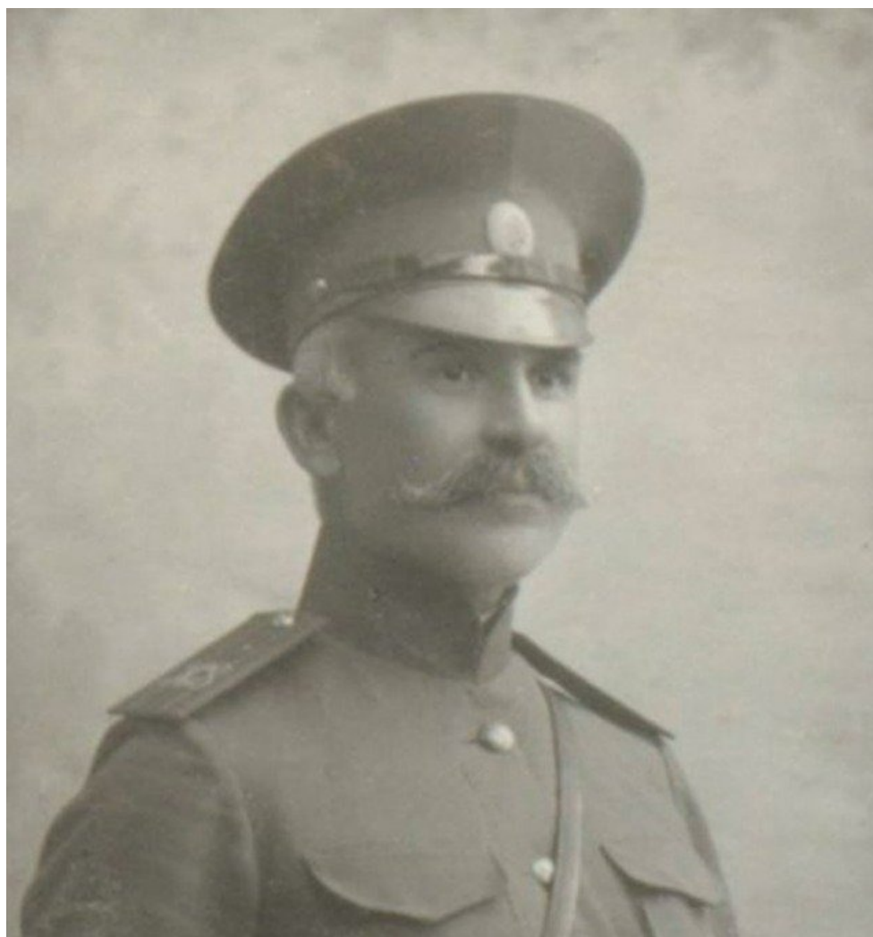
Мовсес Силикян.