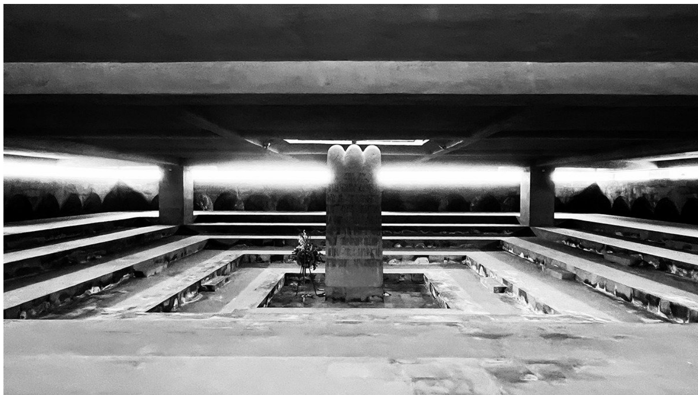
Мемориал жертвам сталинских репрессий.

В 1953 году, после смерти Сталина, МИД СССР заявил, что народы Армении и Грузии более не имеют территориальных претензий к Турции. Все же проводимое переселение армян состоялось