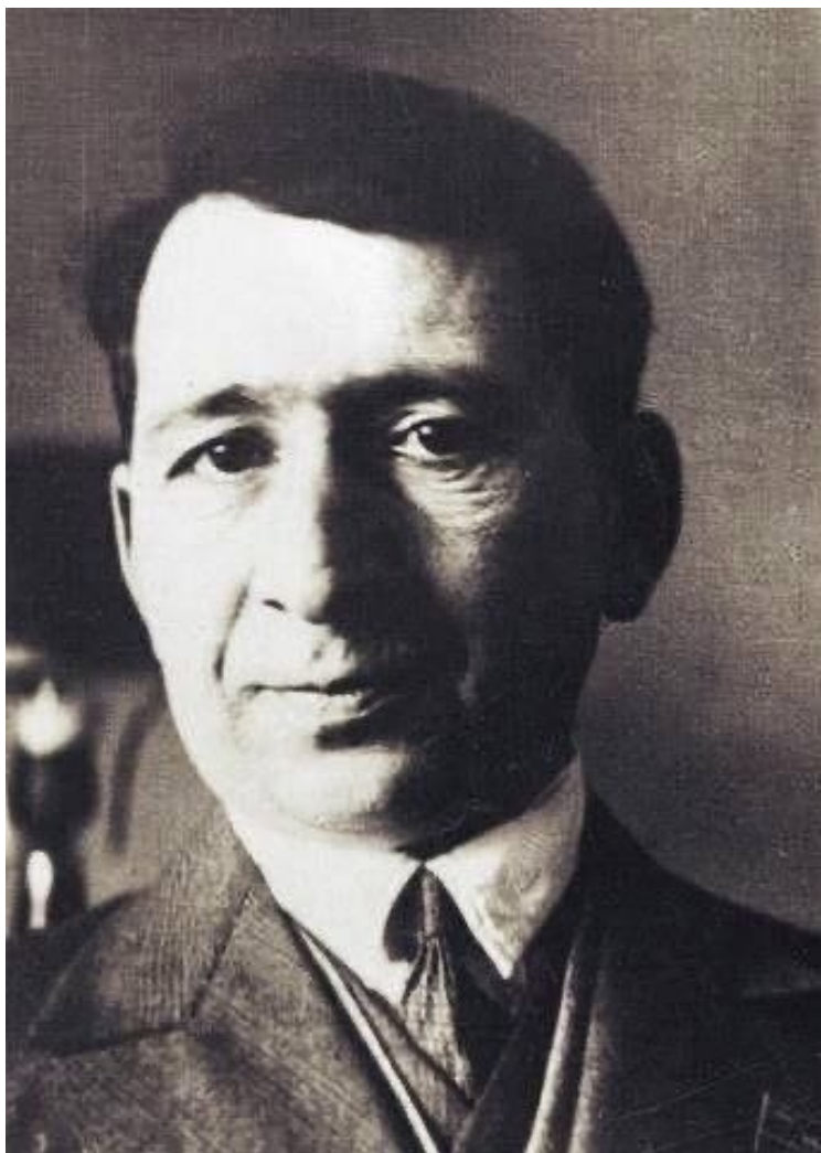
Егише Чаренц.