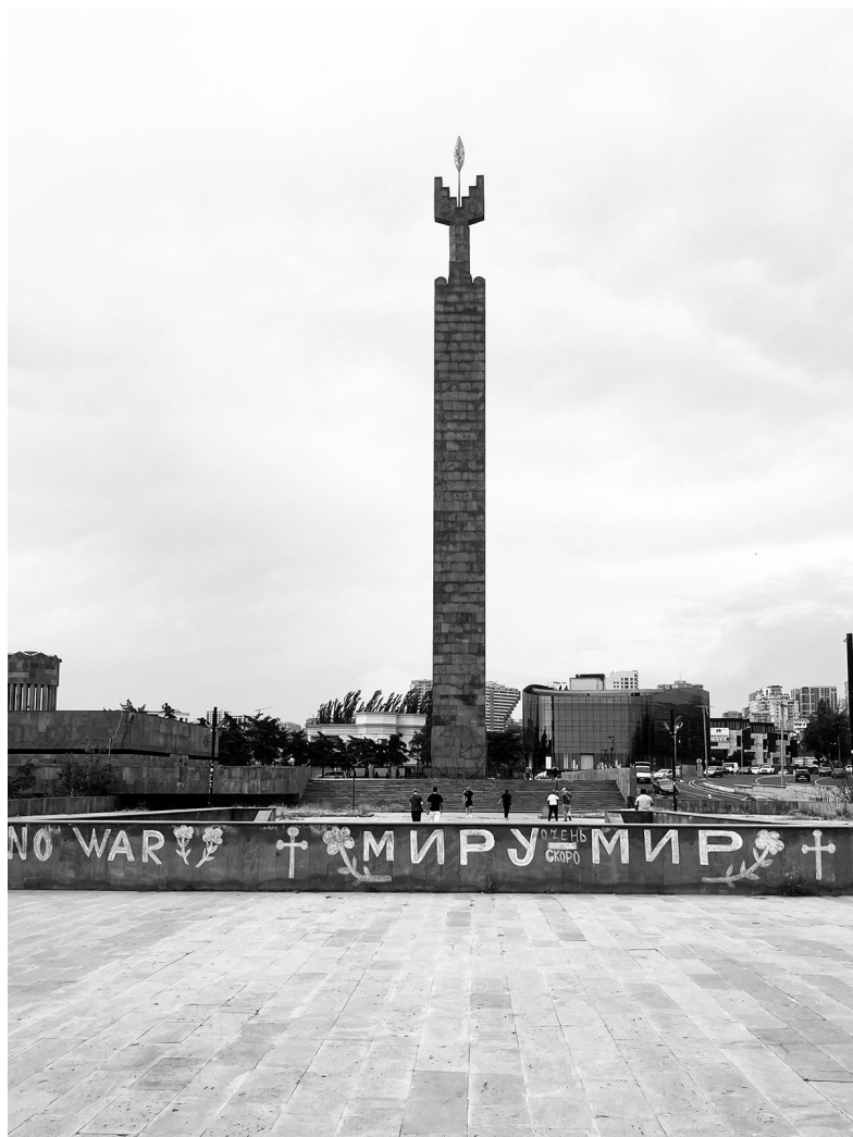
Монумент в честь 50-летия Советской Армении.

Среди репрессированных в 1945 году были и те, кто репатриировался в Армению из других стран, в том числе, из США и Франции, где они нашли приют после Геноцида. По неофициальным данным, репатрианты составляли примерно 10 процентов от общего числа репрессированных в 1949 году.