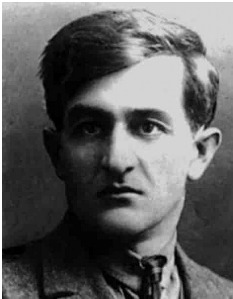
Аксель Бакунц. Фото: архив

Армян в сталинские времена депортировали не только из Армении. Несколько десятков тысяч армян были депортированы из Крыма, Азербайджана и Грузии.