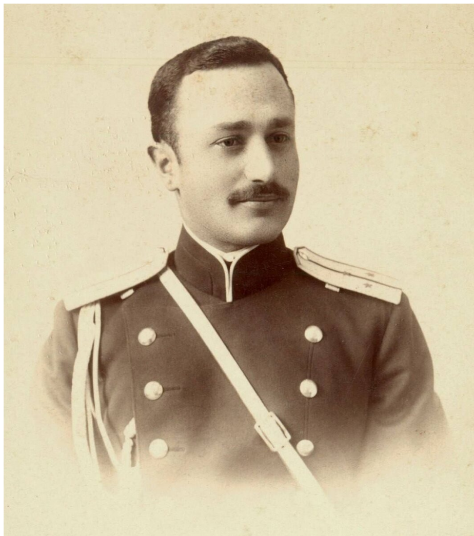
Христофор Араратян.

сотням офицеров Первой Республики: генералы Мовсес Силикян, Христофор Араратян, полковники, штабс-капитаны и другие. Согласно воспоминаниям, эти репрессии рассматривались как планомерная расправа с «дашнакской контрреволюцией», которую совершала новая советская власть.