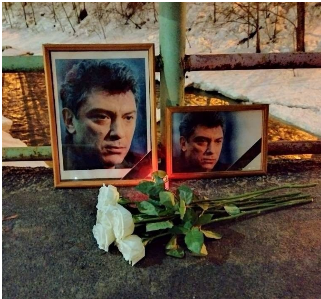
Немцов мост в Петрозаводске.