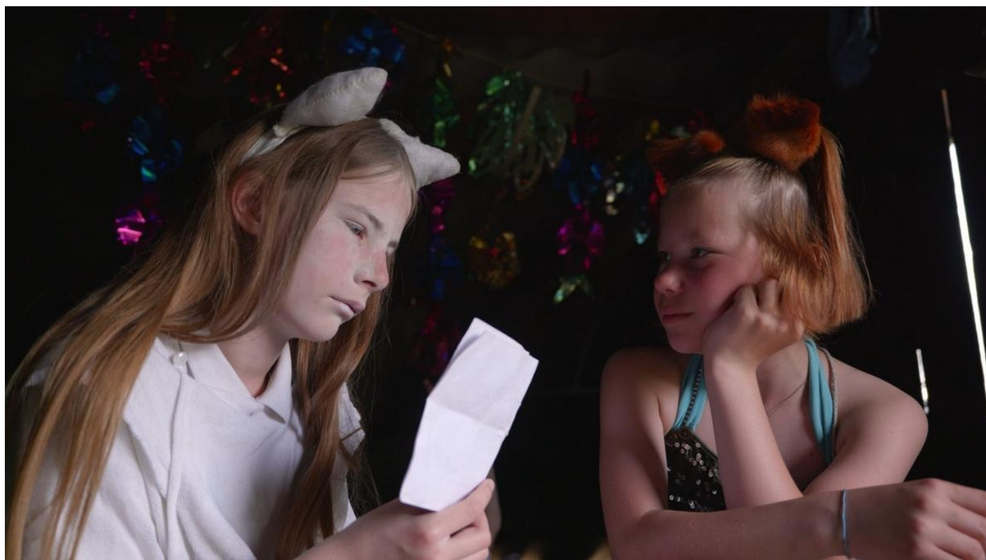
Кадр из фильма «Колхандра»