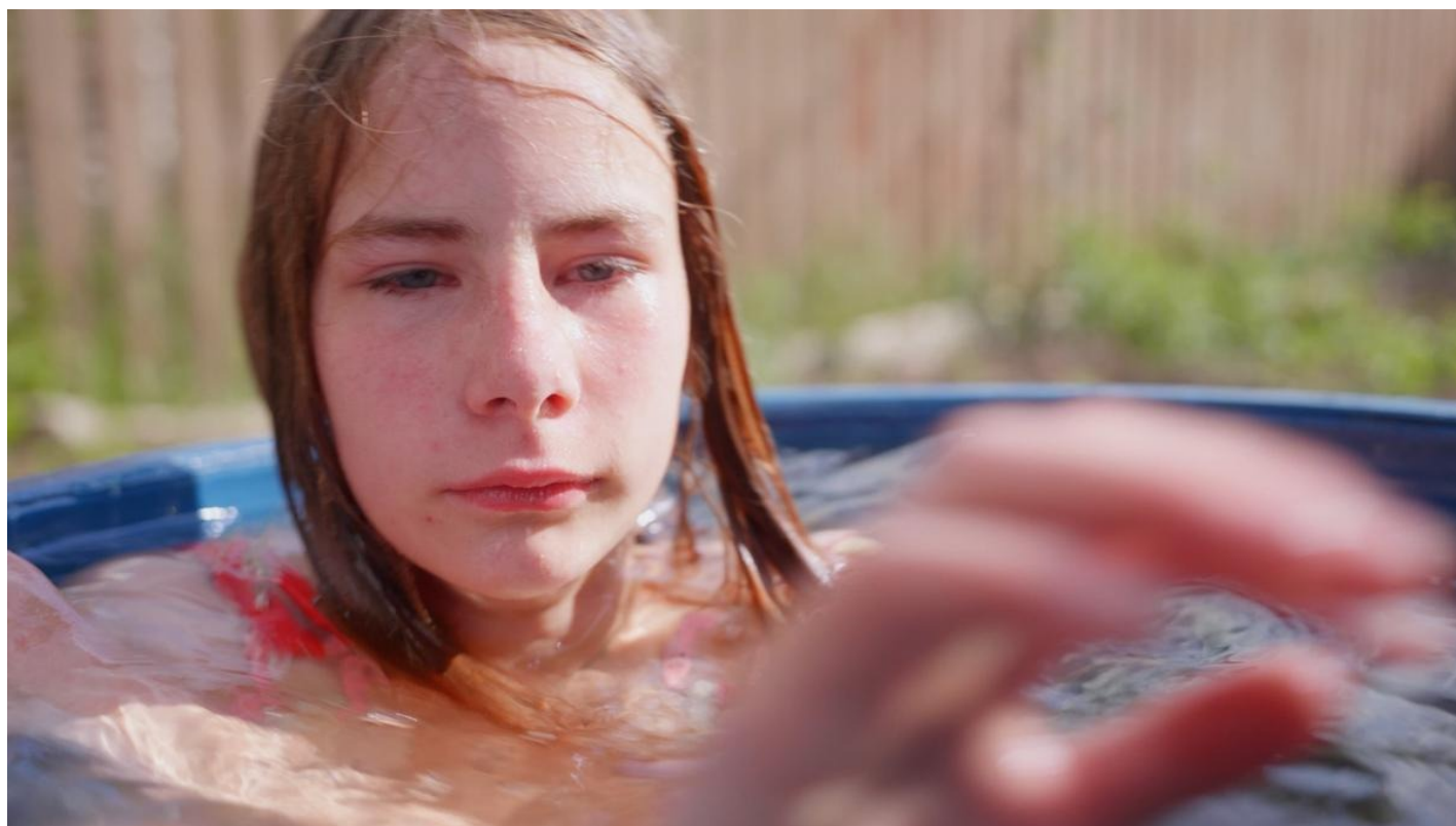
Кадр из фильма «Колхандра»

— Скорее всего ключ, с помощью которого открываю двери, исследую реальность. Я всегда был любопытным. Но это и возможность прожить разные жизни. В Дагестане, в Индии, в деревне. На социальном дне или на крыше Москва-Сити. Камера помогает проникать в открытые и закрытые пространства, сквозь стенки между людьми. Как в романах Адамса «Автостопом по галактике».