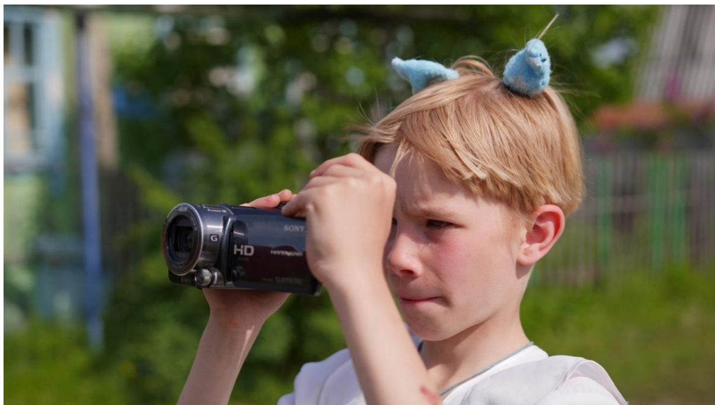
Кадр из фильма «Колхандра»

скамьи. Он вырос в маленьком городе Шадринске, потом поступил в Уральский федеральный университет по специальности «реклама». О кино не мечтал. Хотя еще в последнем классе подрабатывал киномехаником, менял бобины с пленкой, параллельно готовясь к экзаменам.