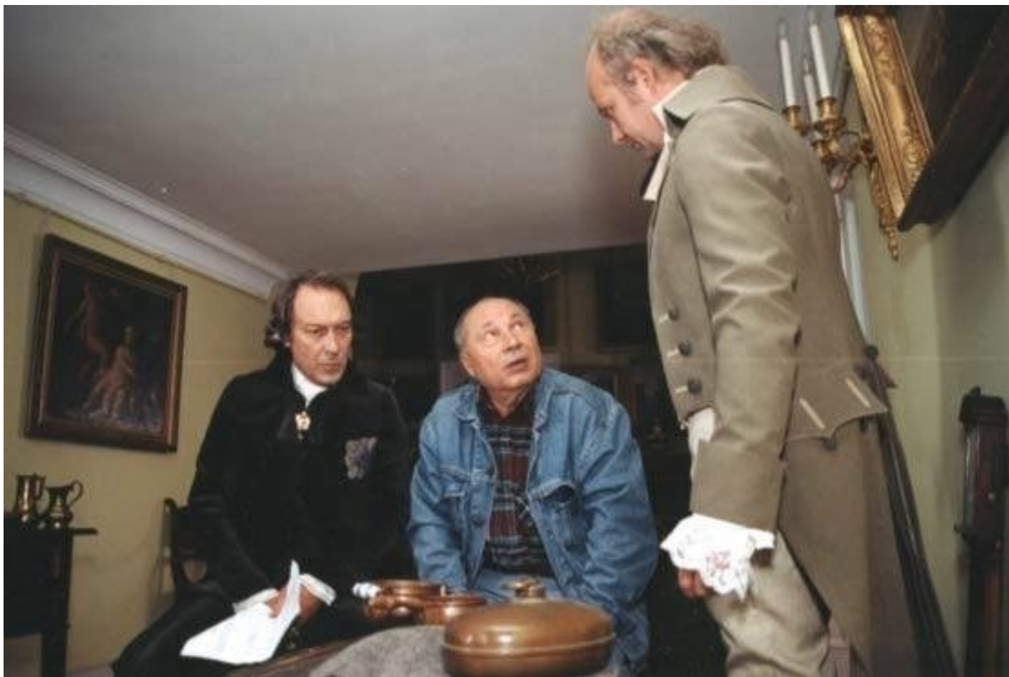
Съемки фильма «Бедный, бедный Павел».

своих ролей — Зилова. А ведь его «лишний человек» был рожден за три года до «Полетов во сне и наяву» Романа Балаяна. Но начальство сочло фильм и героя слишком депрессивными, мрачными.