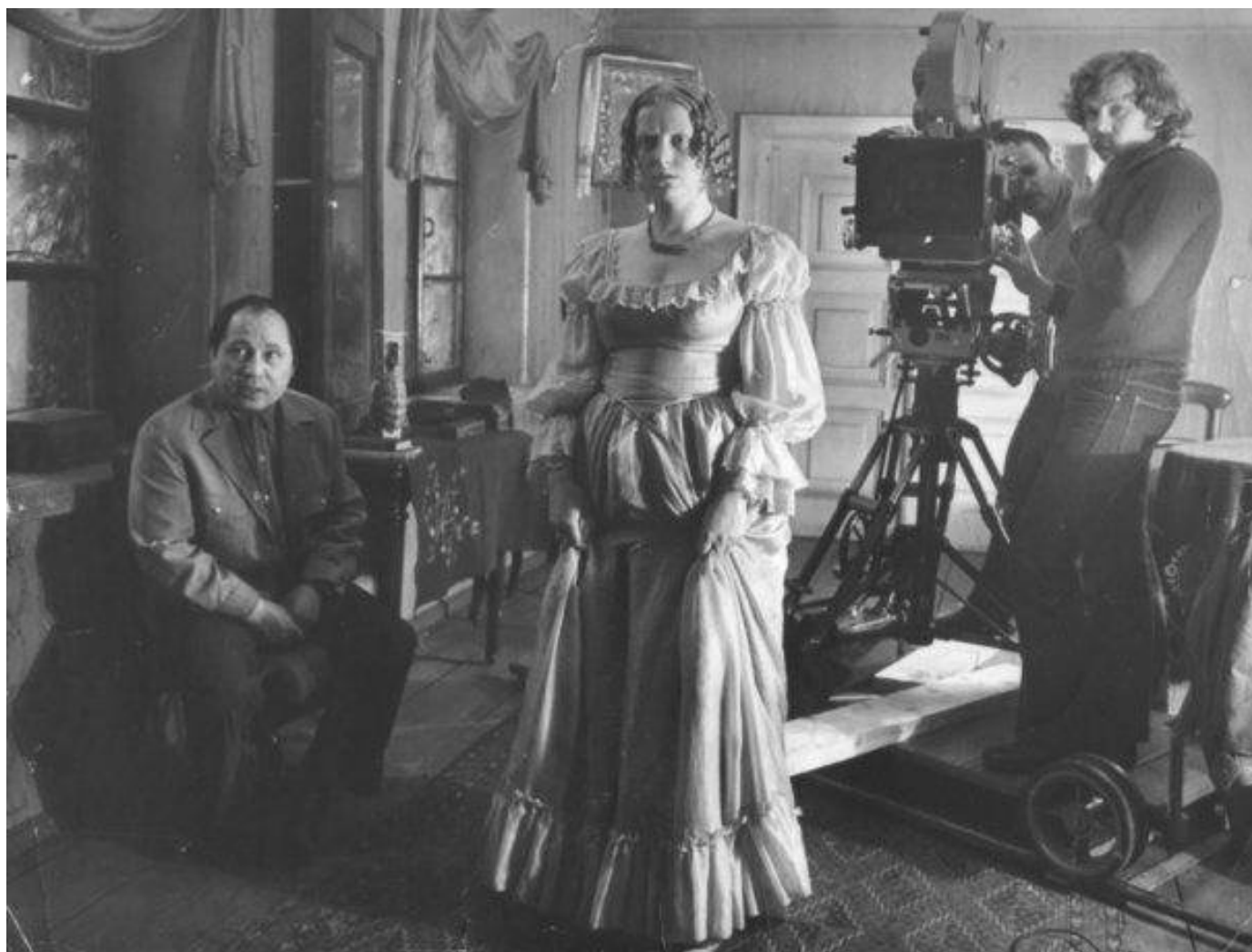
Съемки фильма «Женитьба».

здравствует экспроприация экспроприаторов! Ураааа!!!» Бессребреник Бычков буквально горит: на революционном топливе и запале, строит в тундре новый светлый мир. Но пафосные речи его вызывали в зале гомерический хохот». Что сказать, чистый Иван-дурак, антигеройский герой, который и Жар-птицу добудет, и за правдой через три моря пойдет.