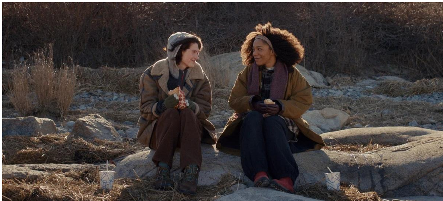
Кадр из фильма «Прости, детка»

После Каннского фестиваля мы писали о славной работе наших дистрибьюторов, купивших для зрителей едва ли не все лучшие картины конкурса. Посмотрим, какие из них долетят до кинотеатров. И не усмотрят ли чиновники «запретных тем», например, в завоевавшем каннское золото фильме «Простая случайность» Джафара Панахи, неоднократно осужденного в Иране за антиправительственную деятельность.