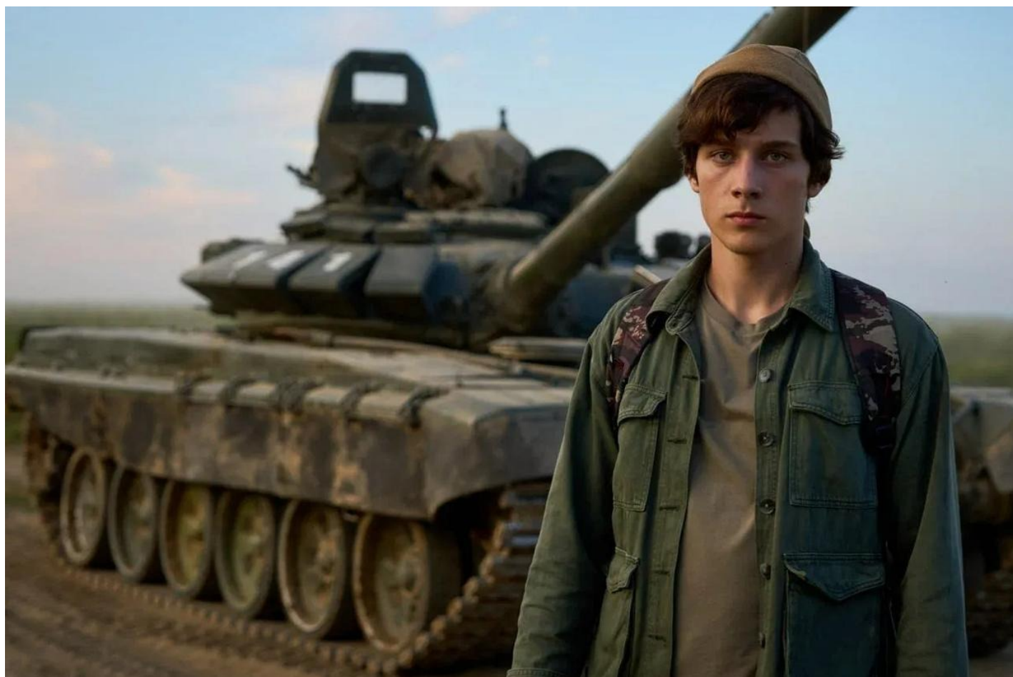
Кадр из фильма «Тимур и его команда»

Известно, что повесть возникла весной 1940-го первоначально в виде сценария. Причем юного героя звали Дункан. Но в Комитете по кинематографии СССР в романтической приключенческой истории о детях, отправляющихся на поиски потерпевшей крушение яхты «Дункан», — увидели «отсылку к западным и вредным буржуазным нормам и традициям» и строго велели поменять имя протагониста. Автор едва не впал в депрессию, долго не мог придумать, как же назвать своего героя. Только осенью придумал, что назовет своего мальчишку с горячим сердцем Тимур, как своего сына. Любопытно, как бы автор отнесся к столь смелой трактовке своего произведения?