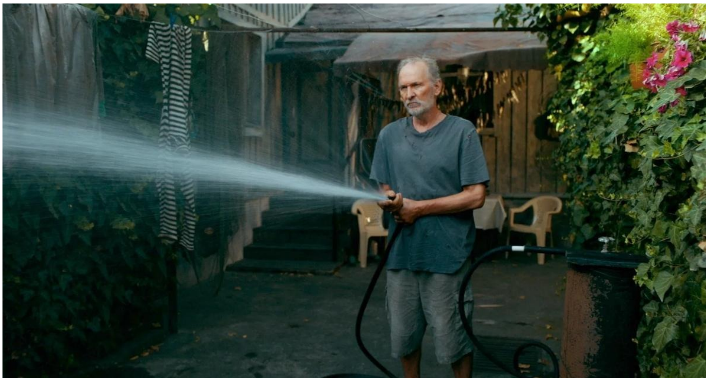
Кадр из фильма «Семь дней Петра Семеновича»

Мелодрама Тиграна Кеосаяна и Маргариты Симоньян «Семь дней Петра Семеновича». «Свежая история» о семидесятилетнем пенсионере, которому поставили диагноз «саркома легких». И он начинает переосмысливать свою долгую жизнь. Федор Добронравов и Олеся Железняк в главных ролях.