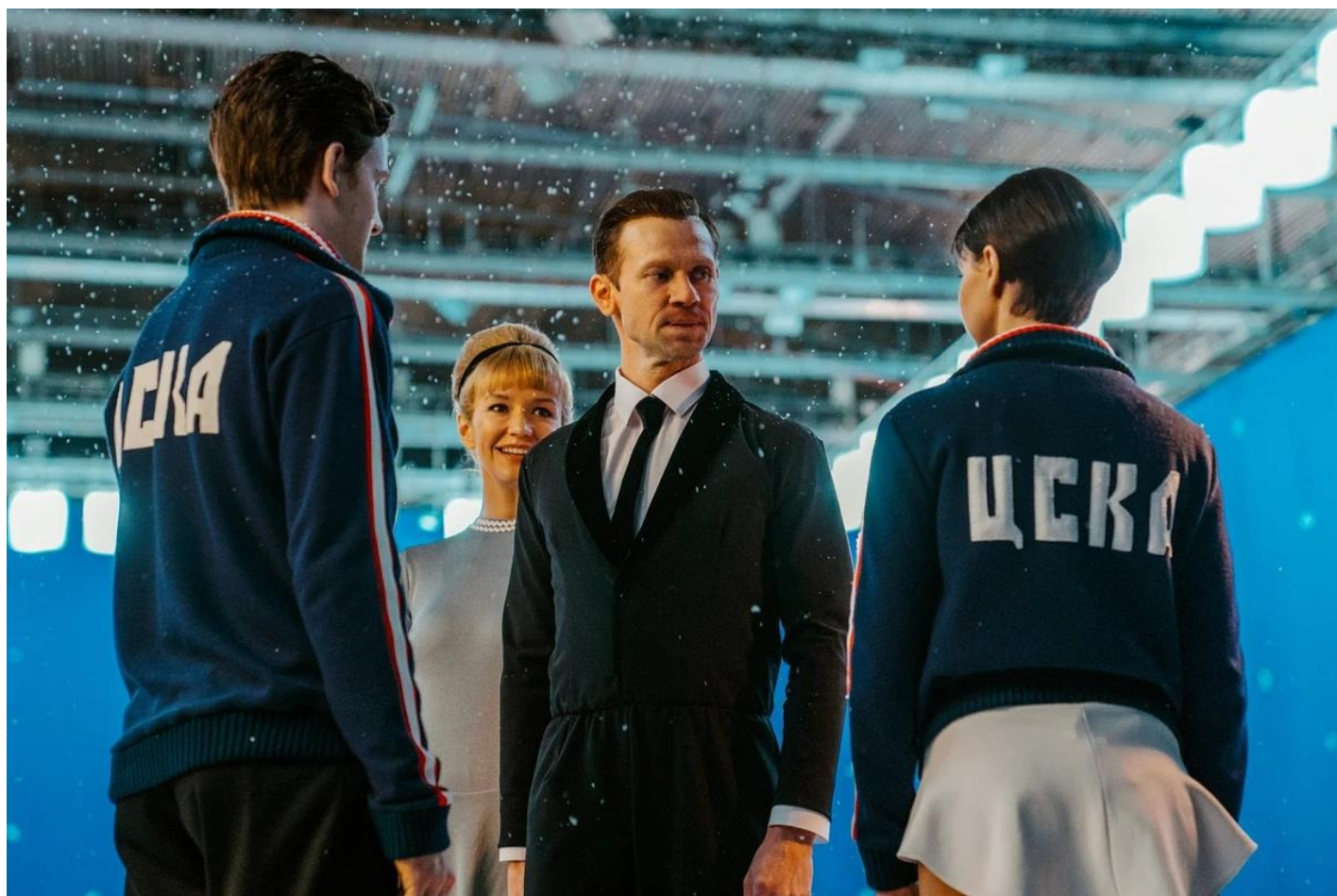
Кадр из фильма «Роднина»

Среди фильмов 2025-го провалились в прокате музыкальная драма с Ромой Зверем «Все, что тебя касается», военно-морская фантастика Николая Лебедева «Кракен», особо значимая военная драма «В списках не значился», среди продюсеров и исполнителей которых — Владимир Машков. Не вызвали особого внимания семейные истории вроде «Царевны-лягушки» или «Маленького шефа». Спортивная драма «Роднина», профинансированная государством, с бюджетом в 425 миллионов рублей за два месяца собрала лишь 205 миллионов.