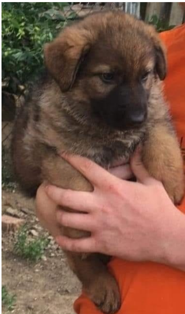
Лея в 2020 году.

Я посмотрел совсем другого щенка, а потом посмотрел на эту пушистую юлу, и друг, который был со мной, произнес ключевую фразу: «Этот обормот тебя уже выбрал, сдавайся». И я сдался.