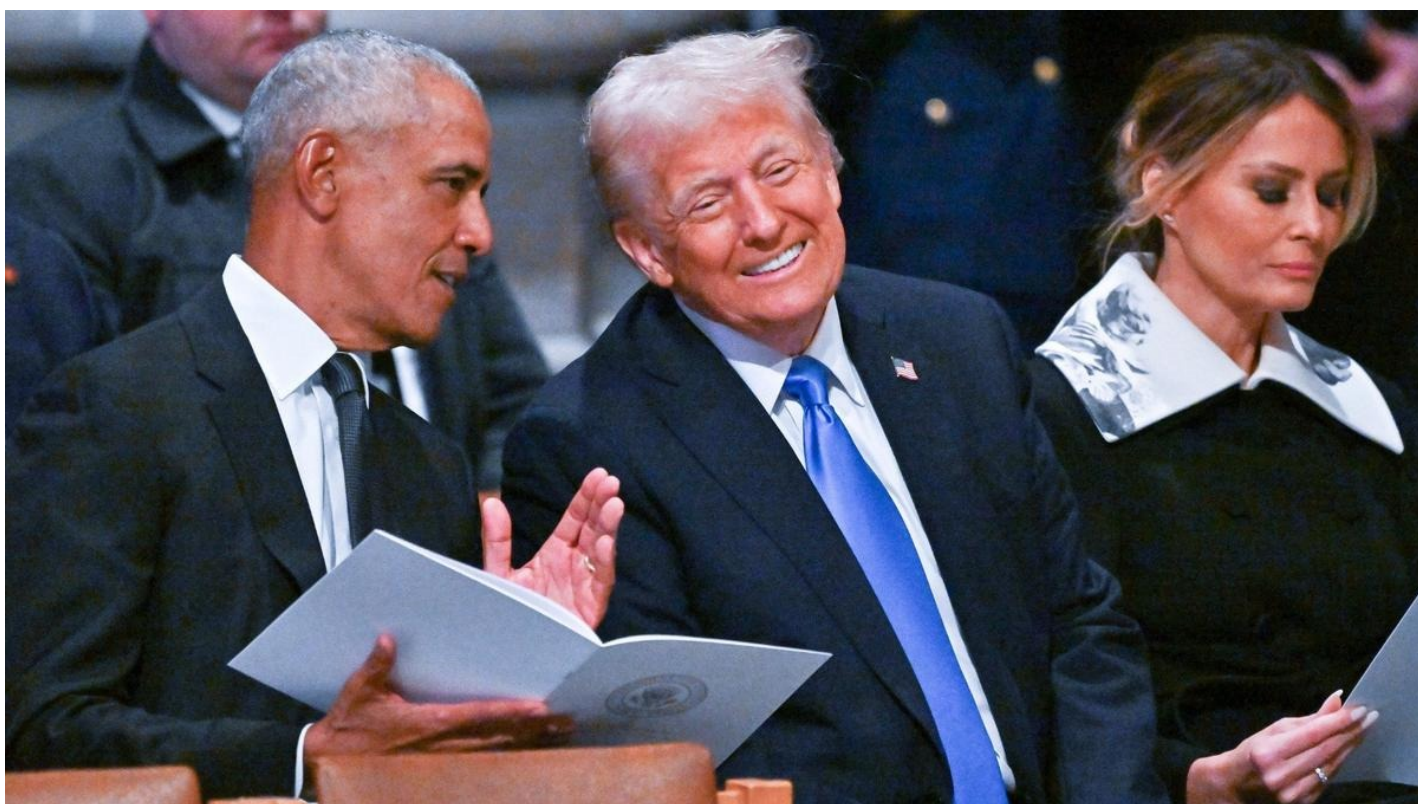
Барак Обама и Дональд Трамп.

В Америке разворачиваются два скандала, на которые пресса реагирует очень по-разному: дело Эпштейна и дело о вмешательстве в выборы