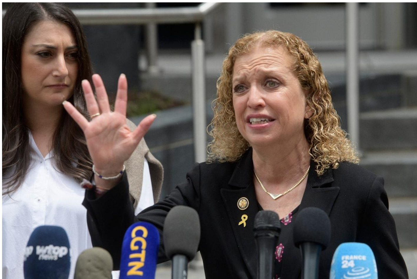
Дебби Уоссерман-Шульц.

расследования, которое ведет ФБР по делам, связанным с Фондом Клинтонов и с электронной перепиской в госдепартаменте».