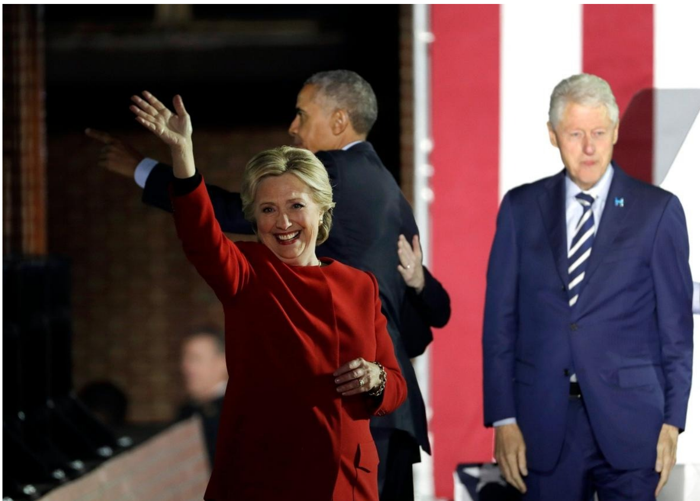
Барак Обама и Хиллари Клинтон.

Из опубликованных документов явствует, что до президентских выборов 2016 года американские спецслужбы не видели признаков агрессивных попыток россиян вмешаться в эти выборы на стороне Трампа. Но после неожиданной победы республиканца Белый дом велел им пересмотреть свой анализ и заключить, что Москва таки ставила на Трампа и старалась навредить его сопернице Клинтон.