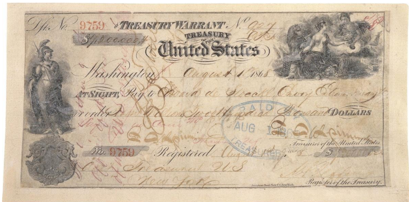
Чек на 7,2 млн долларов США, предъявленный для оплаты покупки Аляски.

«Сегодня и вчера и третьего дня мы передаем и передавали полученные из Нью-Йорка и Лондона телеграммы о продаже Соединенным Штатам владений России в Северной Америке... Мы не можем отнестись к подобному невероятному слуху иначе, как к самой злой шутке над легковерием общества. Мы не знаем, откуда исходят подобные слухи и с какой целью они распускаются, но несомненно одно, что, несмотря на свою очевидную невероятность, они глубоко огорчают всех истинно русских людей.