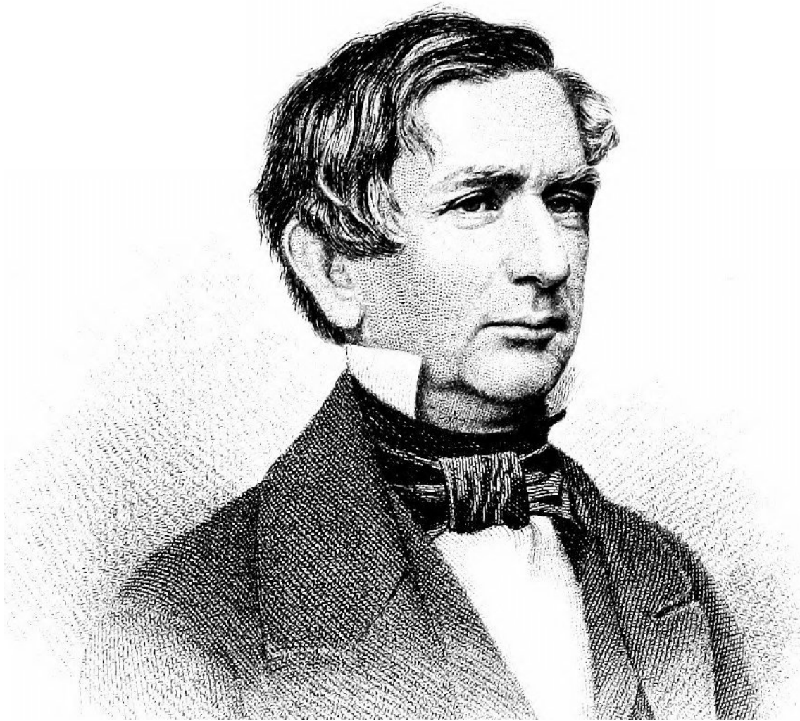
Уильям Генри Сьюард.

Донесения Стекла в Петербург — главный, а в некоторых случаях и единственный источник, дающий представление о ходе переговоров, которые привели к заключению договора о продаже Аляски.