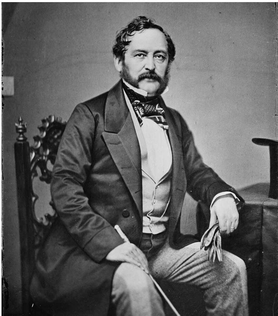
Эдуард Андреевич фон Стеклъ.

соседей. Это соображение является, быть может, для нас мотивом продать наши колонии Соединенным Штатам. Оно, конечно же, служит основанием для американцев, чтобы их приобрести».