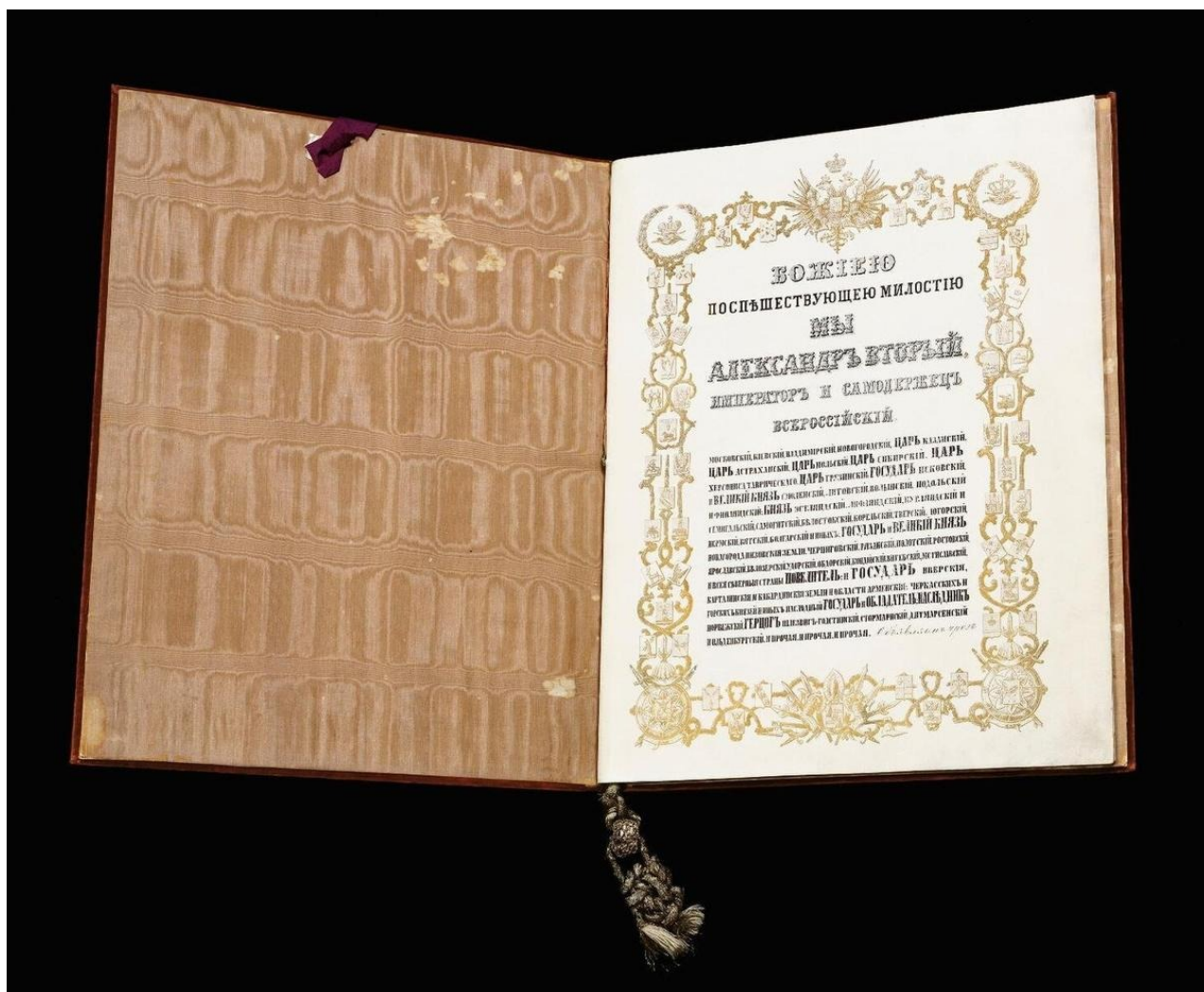
Ратификационная грамота, подписанная императором Александром II и хранящаяся в Национальном управлении архивов и документации США.

7 апреля 1867-го секретарь посольства В. Бодиско (по отзыву Горчакова, «молодой интеллигентный человек») доставил в Петербург и представил начальству уже ратифицированный американцами договор. В Петербурге не скрывали удовлетворения. На первой странице дополнительного донесения Стекля Горчакову Александр II собственноручно написал: «За все, что он сделал, он заслужил особое спасибо с моей стороны».