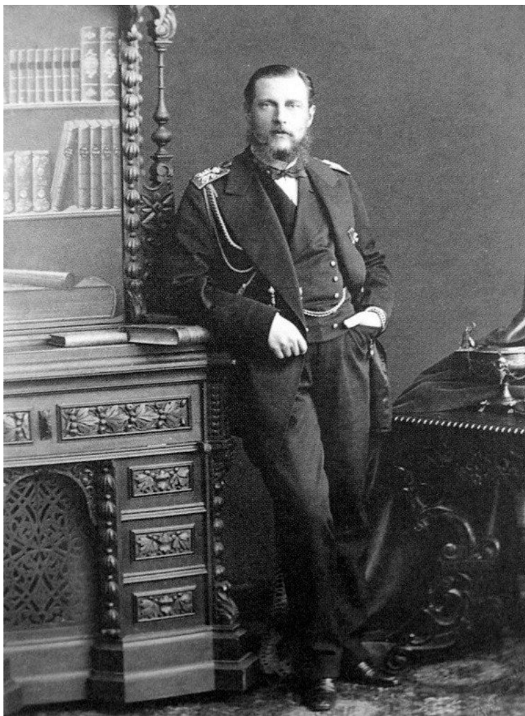
Великий князь Константин Николаевич.