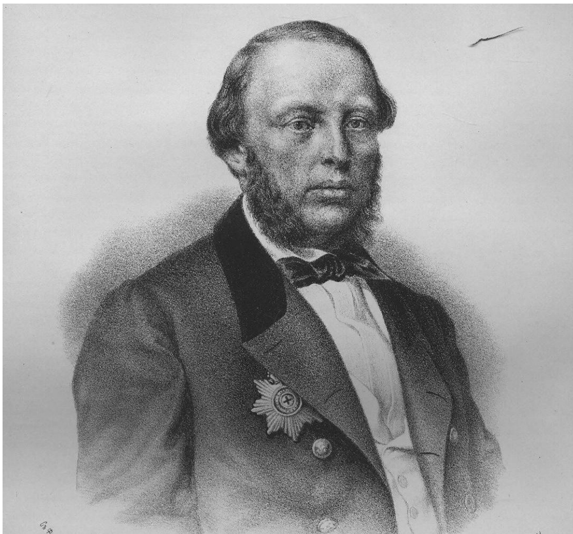
Министра финансов Рейтерн.

себя заботу об их управлении, что приведет к не менее обременительным жертвам. Г-н Рейтерн, как и е. выс-во вел. кн., считает необходимым уступить наши колонии Соединенным Штатам.