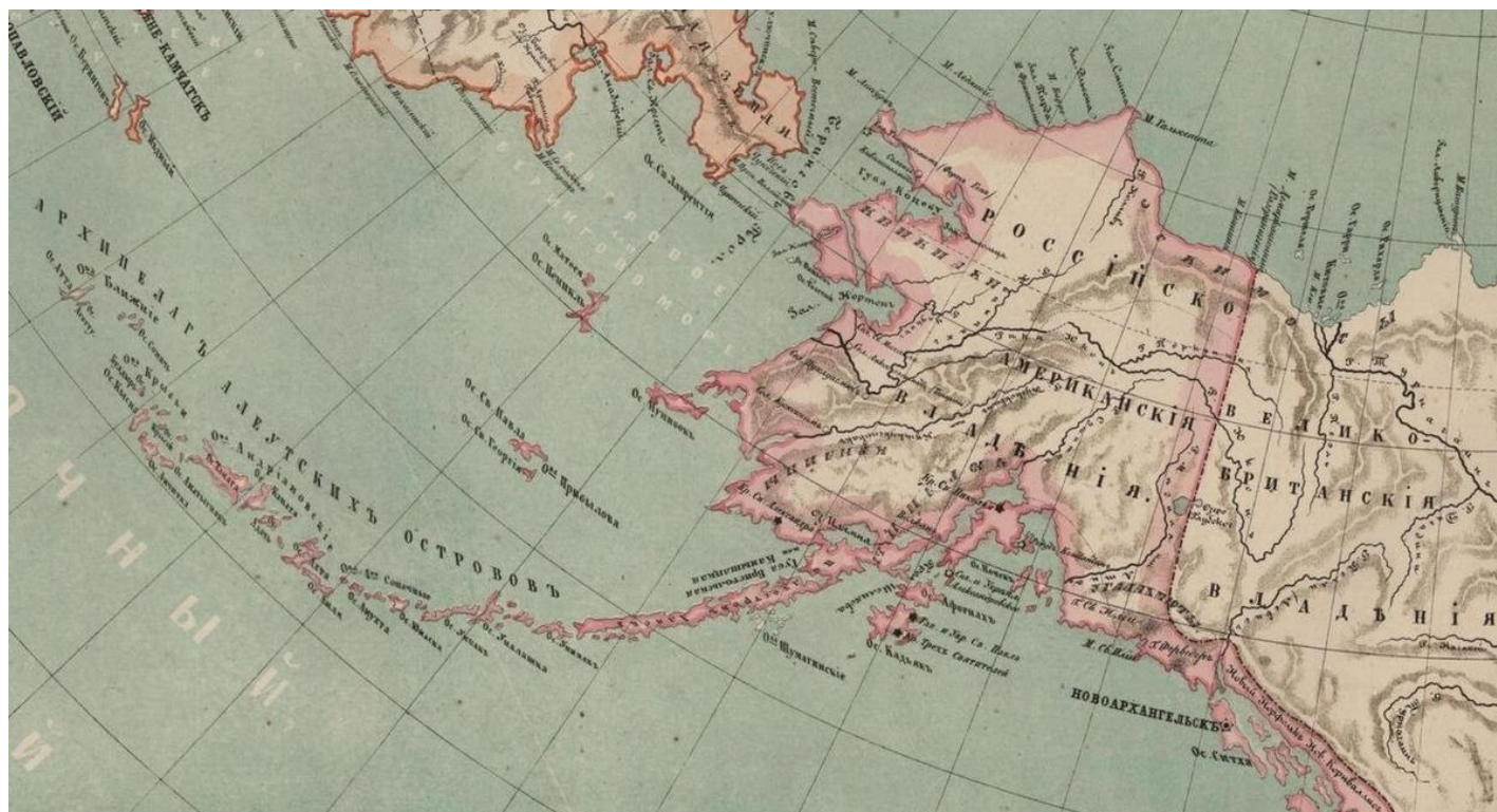
Карта российских владений в Северной Америке в 1860 году.

И хотя открытые столкновения с индейцами происходили редко, в целом сопротивление коренного населения оказалось едва ли не главным препятствием к успешной колонизации Американского материка. В итоге это повлияло на общую оценку деятельности компании, а косвенно — и на решение о продаже Русской Америки.