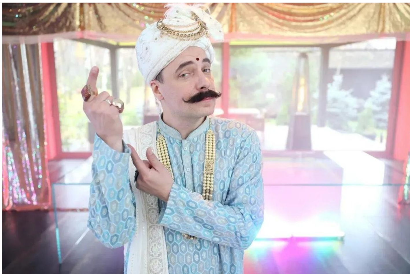
Кадр из фильма «Жемчуг»