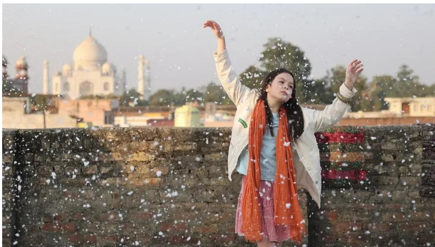
Кадр из фильма «Жемчуг»

Как кино эмигрирует в параллельную реальность. Премьеры фестиваля в Выборге