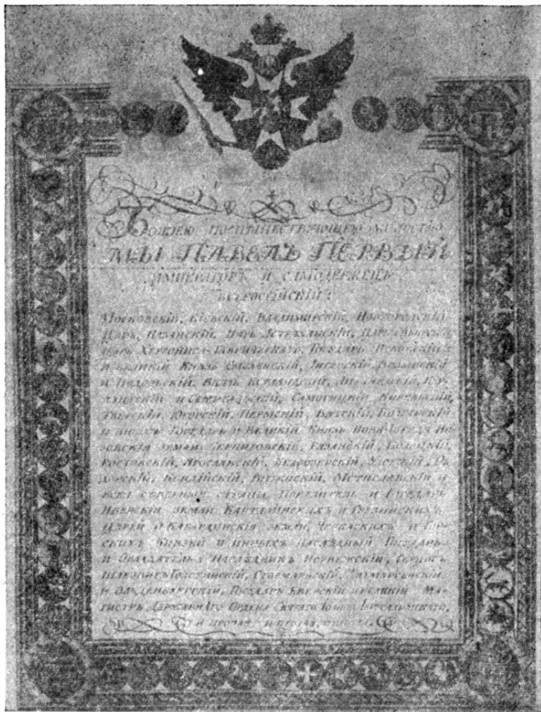
Первая страница указа Павла I об образовании Российско-американской компании.

Формально предложение о продаже исходило от российского посланника в Вашингтоне Эдуарда Стекля. Но действительным инициатором сделки был великий князь Константин Николаевич. Впервые он озвучил это предложение весной 1857 года в специальном письме министру иностранных дел Александру Горчакову: «Продажа эта была бы весьма своевременна, ибо не следует себя обманывать и надобно предвидеть, что Соединенные Штаты, стремясь к округлению своих владений и желая господствовать нераздельно в Северной Америке, возьмут у нас помянутые колонии, и мы не будем в состоянии воротить их. Между тем эти колонии приносят нам весьма мало пользы, и потеря их не была бы слишком чувствительна и потребовала только вознаграждения нашей Российско-американской компании».