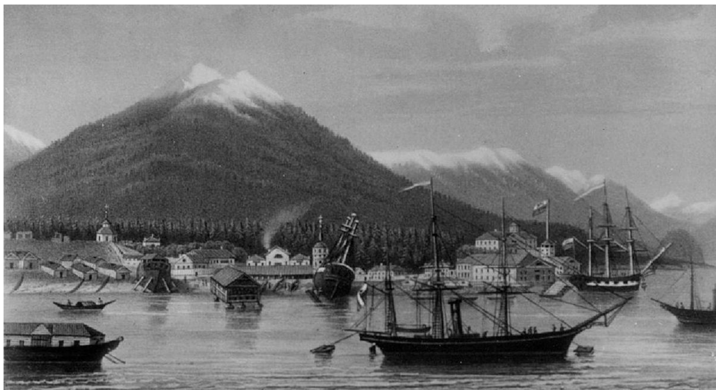
Ново-Архангельск, 1863 год.

Процент крестьянского населения, способного заниматься сельскохозяйственными работами, среди колонистов был настолько мал, что к 1855 году оказалось некому провести опыты по выращиванию овса, ячменя и пшеницы в сельскохозяйственном поселении Нинильчик в заливе Кука. «Если бы поселяне Нинильчика были из крестьян наших хлеботорбных губерний, — писал служащий Российско-Американской компании Мургин, — то опыты посевов могли бы быть правильнее.... Тогда компании стоило бы только выписать необходимые орудия для хлебопашества и семена. Но что может сделать горожанин, оставивший родину лет 30 назад или около того и едва ли видевший хлебопашество, или тем более местный креол, никогда не видевший ни самой работы, ни употребляемых при ней инструментов».