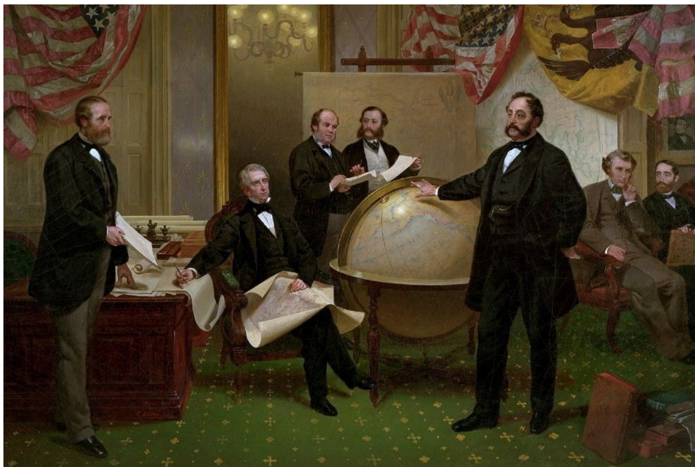
Подписание договора о продаже Аляски 30 марта 1867 года. Художник Эмануэль Лойце, 1868 год.