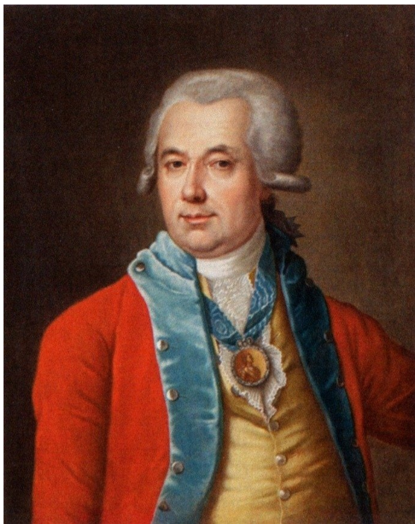
Григорий Шелихов.

В сентябре 1821 года император Александр I подписал указ, объявляющий Аляску и прилегающие к ней территории исключительной зоной российских интересов. От Берингова пролива до 51-й параллели китовый промысел, рыболовство, торговля отныне разрешались только подданным Российской империи. Статус Аляски закрепили конвенции с Британией (1824) и США (1825). К востоку от Аляски простирались канадские владения Британской империи (формально принадлежавшие «Компании Гудзонова залива»).