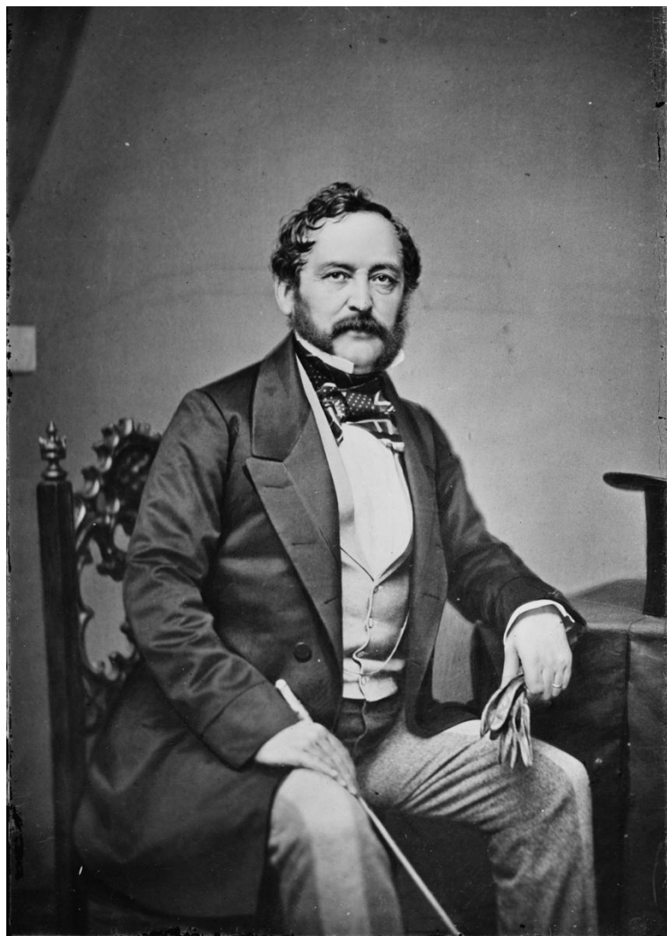
Эдуард Стеклъ.

Но окончательное решение о продаже Аляски было принято 16 декабря 1866 года на специальном совещании, где присутствовали государь Александр II, великий князь Константин Николаевич, министры финансов и морского министерства и российский посланник в Вашингтоне. Все участники одобрили идею продажи Аляски.