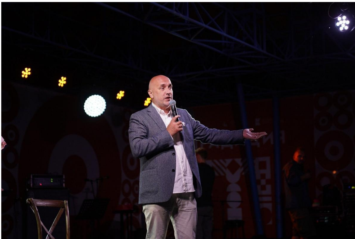
Захар Прилепин.

стороны границы. Марат Гельман** решил составить полный список покинувших отечество звезд (с указанием стран и регалий), на которых в России все держалось. Тут и Сорокин, и Шишкин*, и Акунин*, и Улицкая*, и Быков*, и Ерофеев, и Глуховский*, и даже Шендерович*. А еще там имеются режиссеры, артисты, музыканты, критики и прочие культурные оракулы.