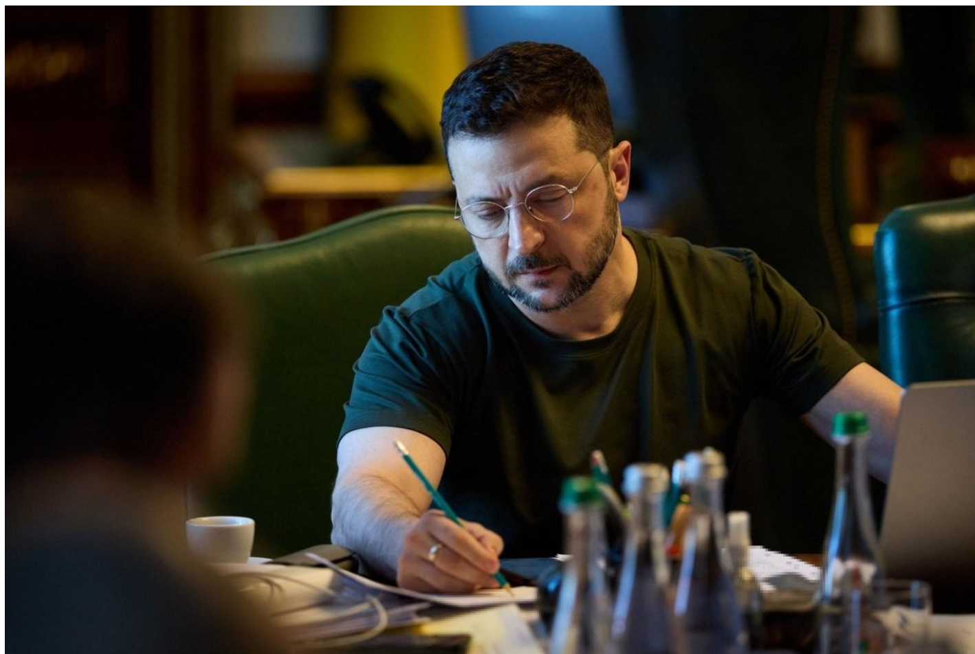
Владимир Зеленский.

сказать об официально назначенной встрече Трампа, Зеленского и Путина. Но этого не прозвучало. И сам Путин, насколько я помню, сказал, что не просил о встрече в таком формате. Пока непонятно, состоится ли она в итоге, хотя до саммита казалось, что это уже решенный вопрос, что разговор Путина и Трампа — промежуточная остановка перед встречей трех лидеров.