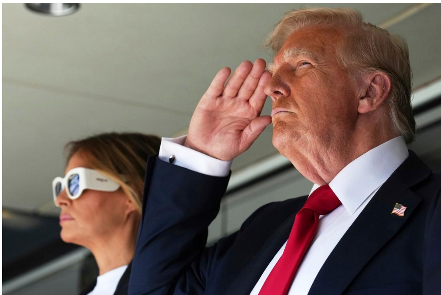
Дональд Трамп и Мелания Трамп.

— Трамп передал Путину письмо от первой леди. Мелания Трамп его действительно написала? И зачем? Какое значение это может иметь?