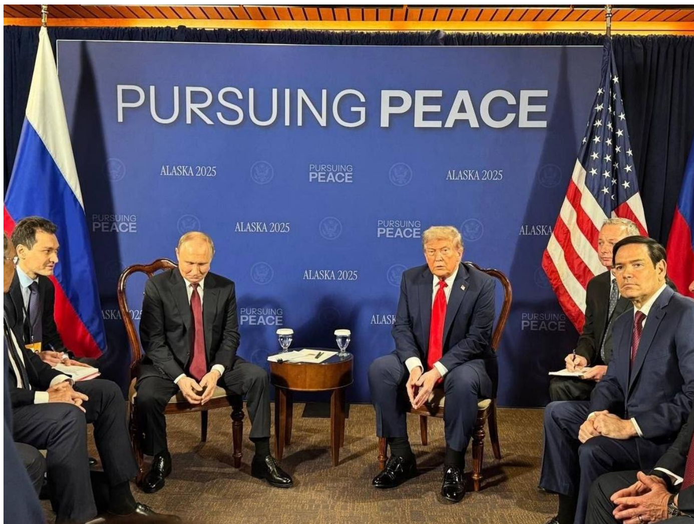
Владимир Путин и Дональд Трамп во время пресс-конференции по итогам встречи.

— Насчет бомбардировщиков, которые пролетели над головами у Путина и Трампа, есть версия, что это было не для «фона», а, наоборот, для демонстрации Путину силы и мощи США. Будто бы унижить хотел.