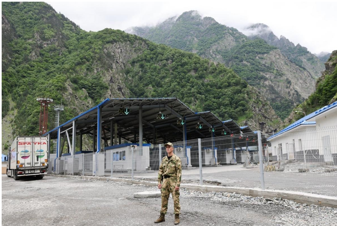
Пропускной пункт «Верхний Ларс» на российско-грузинской границе.

Коек в этом душном помещении примерно в пять раз меньше, чем людей, так что спать приходится либо прямо на сыром бетонном полу, либо дожидаться своей очереди у койки. Нет нормального санузла, нередко нет даже воды.