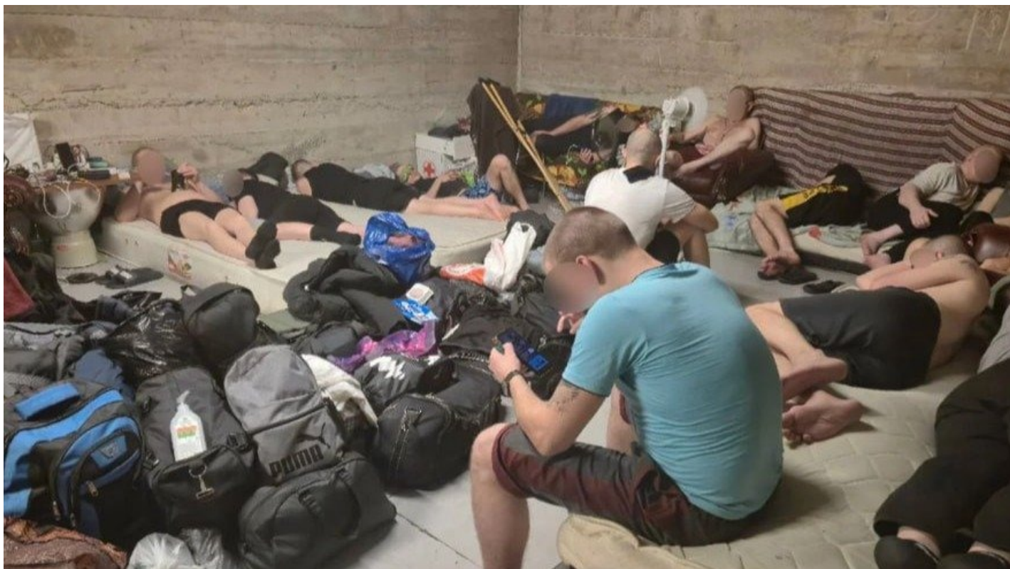
Украинцы, застрявшие в нейтральной зоне после выдворения их из РФ.

На российско-грузинской границе назревает гуманитарная катастрофа: 100 украинцев застряли в нейтральной зоне после выдворения из РФ, а грузинские власти их не впустили