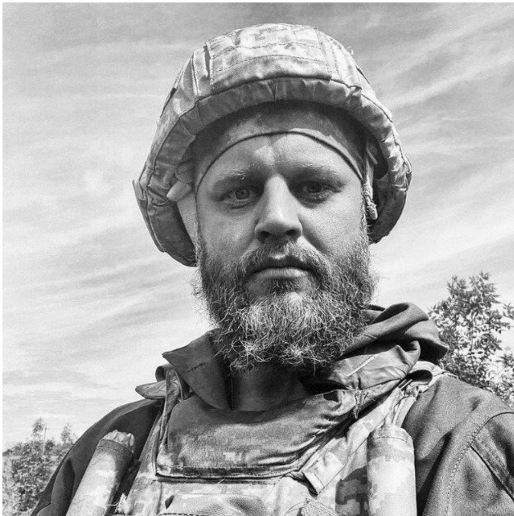
Павел Губарев.

Далее всех уже не первый раз идет бывший «народный губернатор» Павел Губарев , который уверяет, что победа невозможна, а затягивание конфликта приведет к экономическому и социальному кризису.