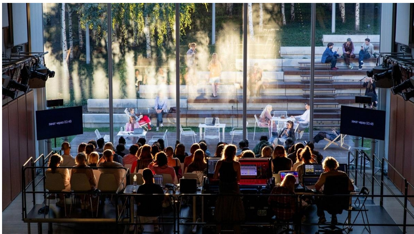
Спектакль «Закат» в ГЭС-2.

О самом медитативном спектакле прошедшего сезона в ГЭС-2. Как Дмитрий Волкострелов предлагает наблюдать за закатом из зрительного зала