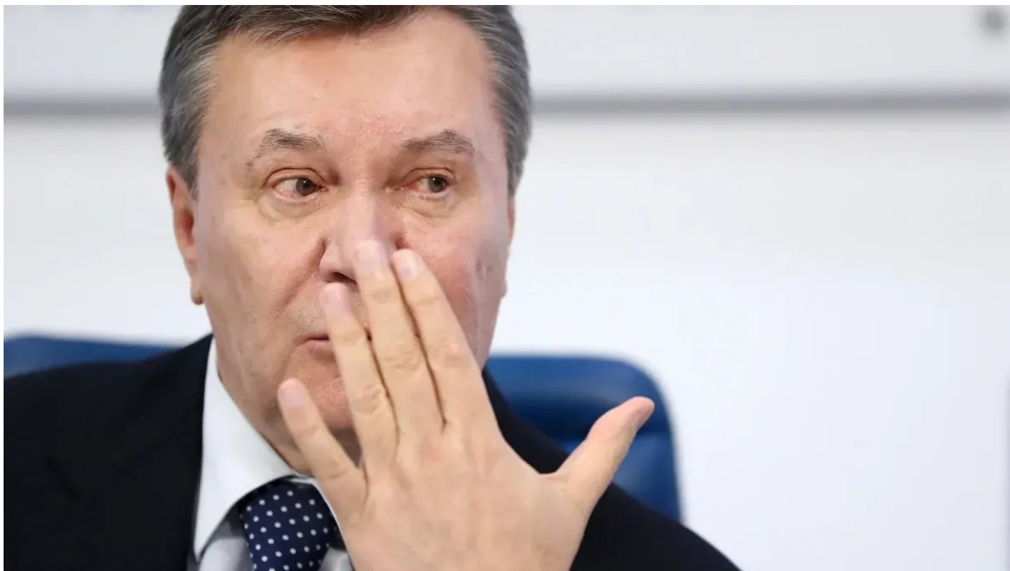
Виктор Янукович.

При этом до сих пор никаких документальных подтверждений связи сочинского Межигорья с семейством Виктора Януковича не было. «Новая газета» их нашла. Как водится, в разоблачении тайны особняка оказался виноват дворецкий.