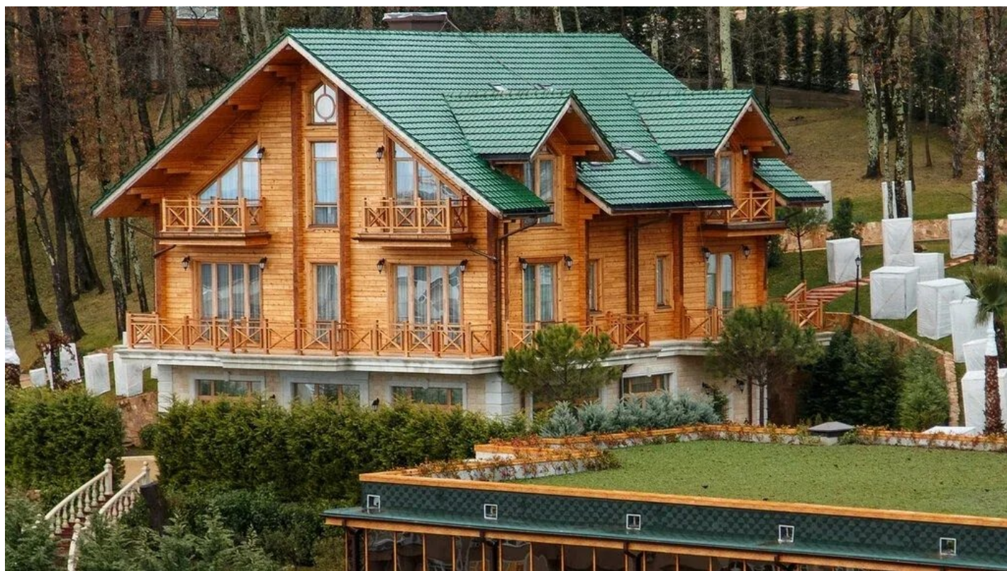
Резиденция Благодать в Большом Сочи.

«Новая газета» нашла документальное подтверждение связи особняка на склоне сочинской горы Благодать с семьей беглого экс-президента Украины Виктора Януковича