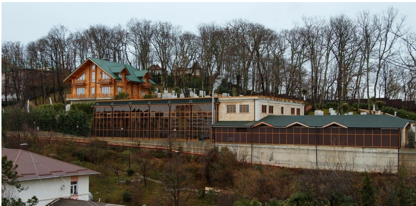
Инфраструктура резиденции Благодать в Большом Сочи.