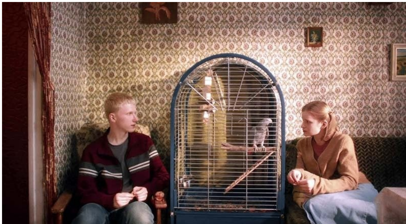
Кадр из фильма «Мальчик-птица»

заслушиваются. И свистом, с помощью которого особенный Ваня беседует с птицами.