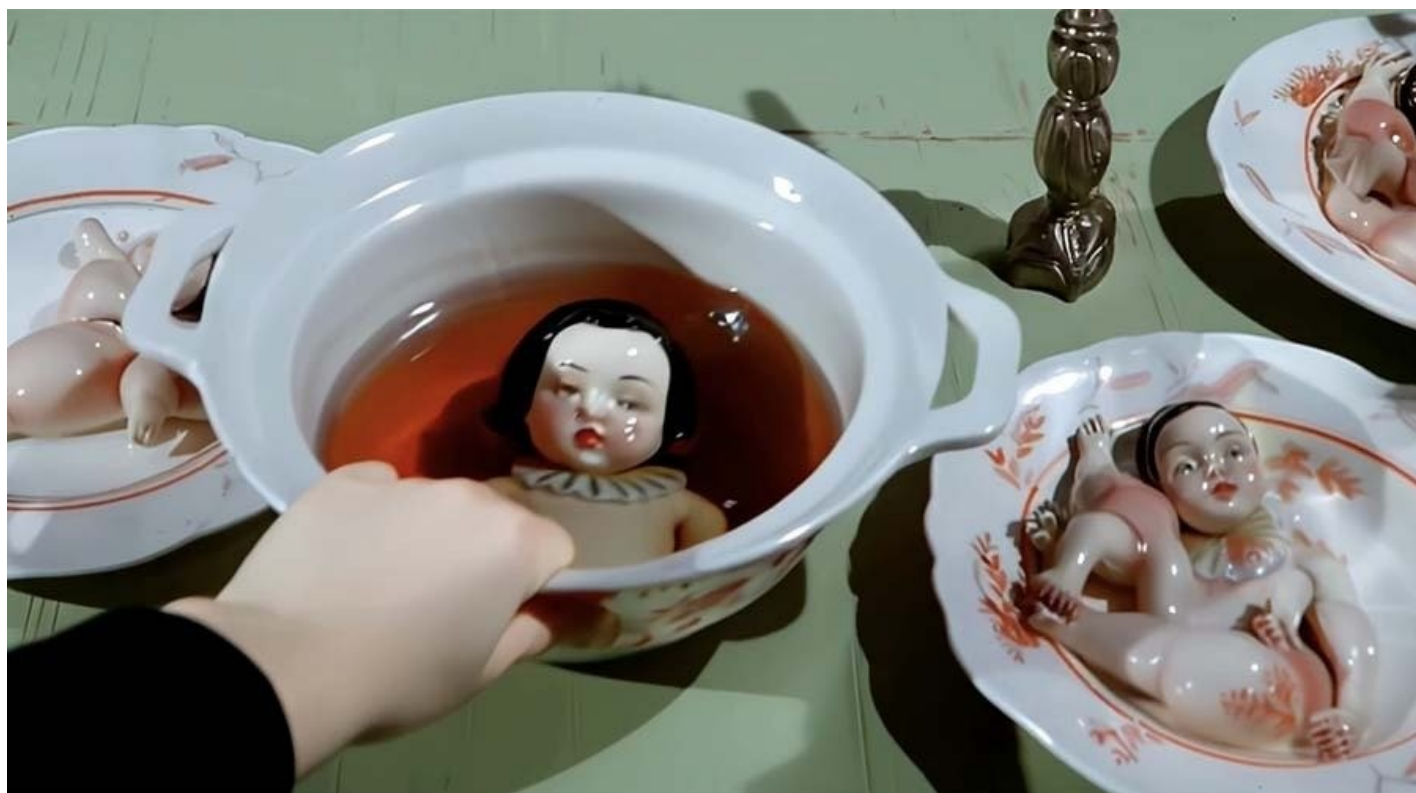
Кадр из фильма «Идеально отвергнутые»

Магазин изысканных фарфоровых статуэток. Страдающие фарфоровые ретро-леди. Их мечты о хрупком счастье. И фарфоровый абьюз. Ведь у всех них было ощущение уникальности. Но, увы, все они — массовое производство. И у всех непосильная судьба. В лучшем случае обыденность — пыльное забытие на буфете. Нет, конечно, повезло жертвам кошачьих атак. Еще хуже — списанным в утиль. Проданным на блошином рынке. Немного трещин. Крови. И звук разбитого стекла. Нет, это не к счастью, это признак смерти.