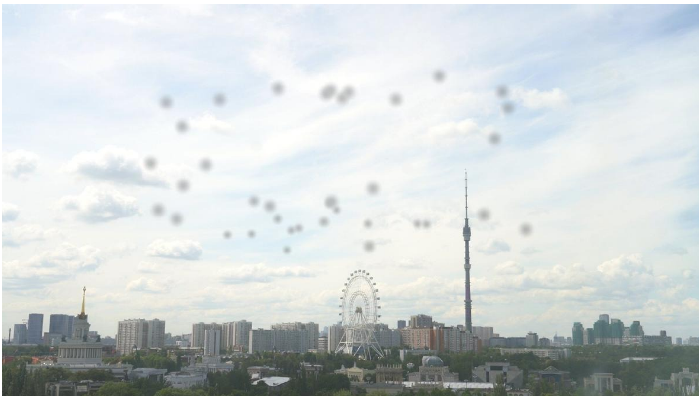
Кадр из фильма «Цензурократия»

В Калининграде продолжается фестиваль «Короче». И уже в первые дни появились явные фавориты