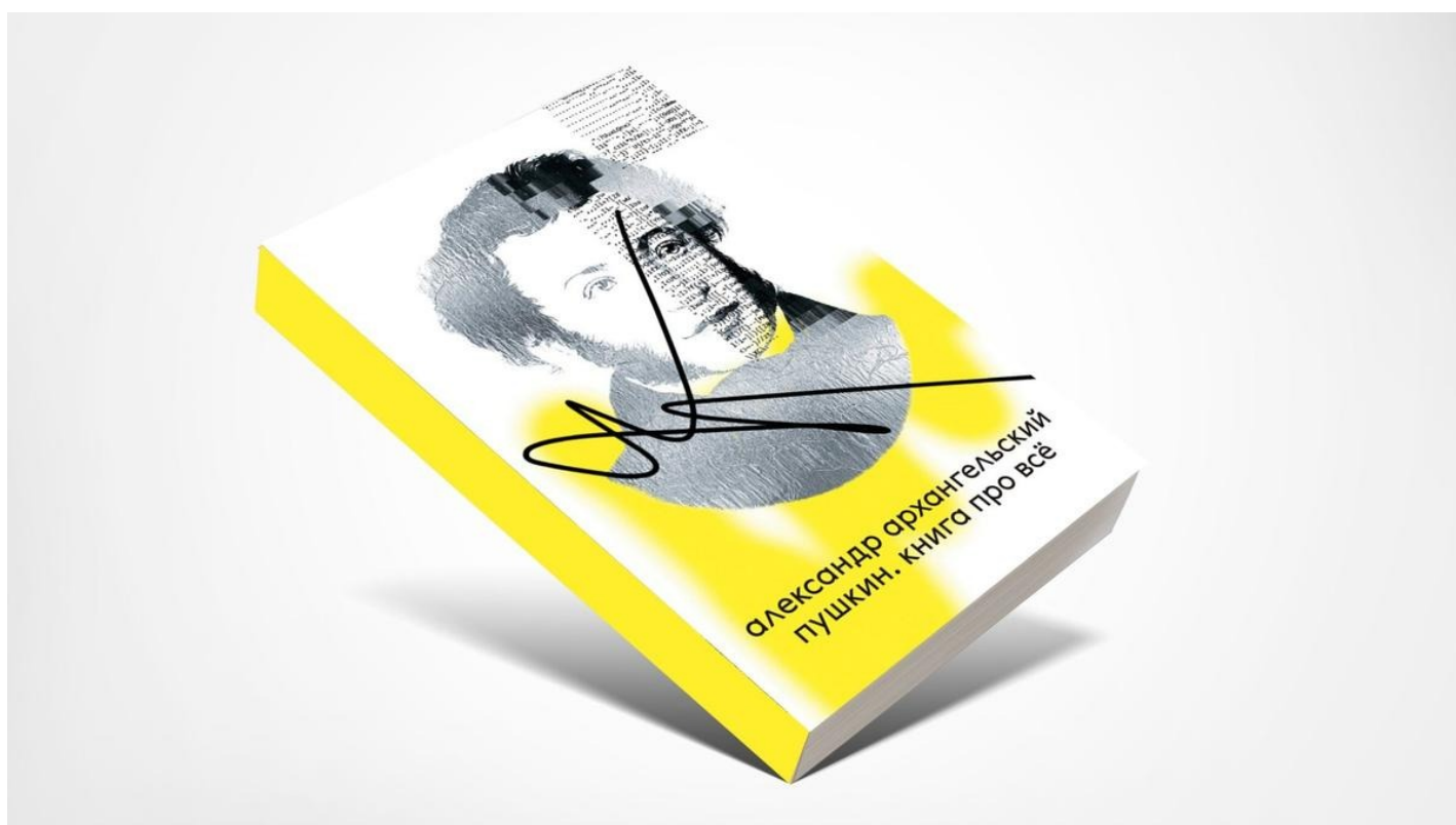
Обложка книги «Пушкин. Книга про всё»

В издательстве Vidim_books выходят две новые книги Александра Архангельского*: о классической литературе вообще и о Пушкине в частности