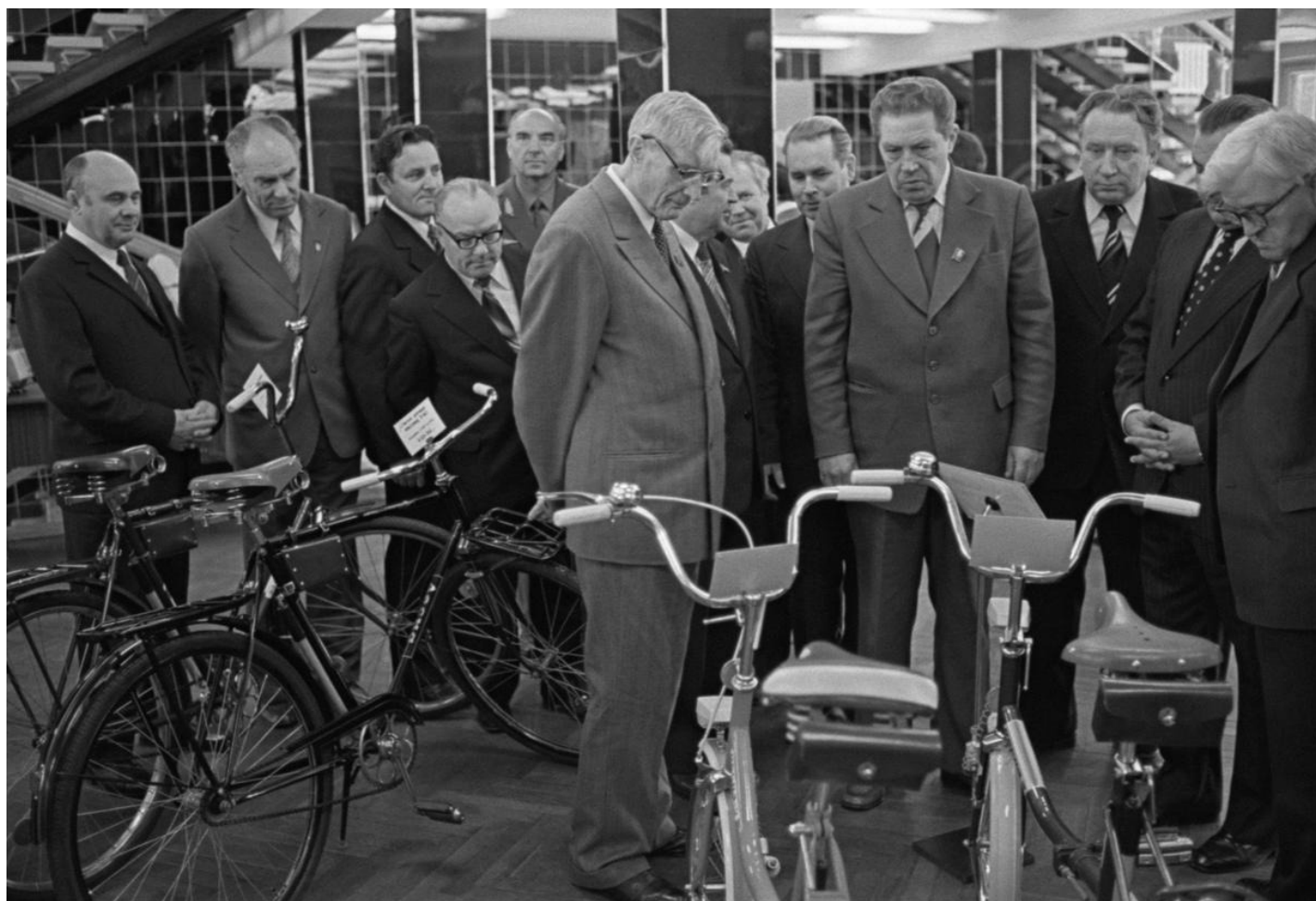
76-летний член Политбюро ЦК КПСС Михаил Суслов (в центре) осматривает выставку товаров с педалями, 1979 год.

Если считать нынешний состав постоянных членов Совета безопасности РФ аналогом членов Политбюро ЦК, то картина получается такая: Бортников — 73 года, Матвиенко — 76 лет, Шойгу — 70, Белоусов — 66, Вайно — 53, Иванов — 72, Лавров — 75, Нарышкин — 70, Патрушев — 74, Мишустин — 59, Медведев — 60 исполняется в сентябре, Володин — 61.