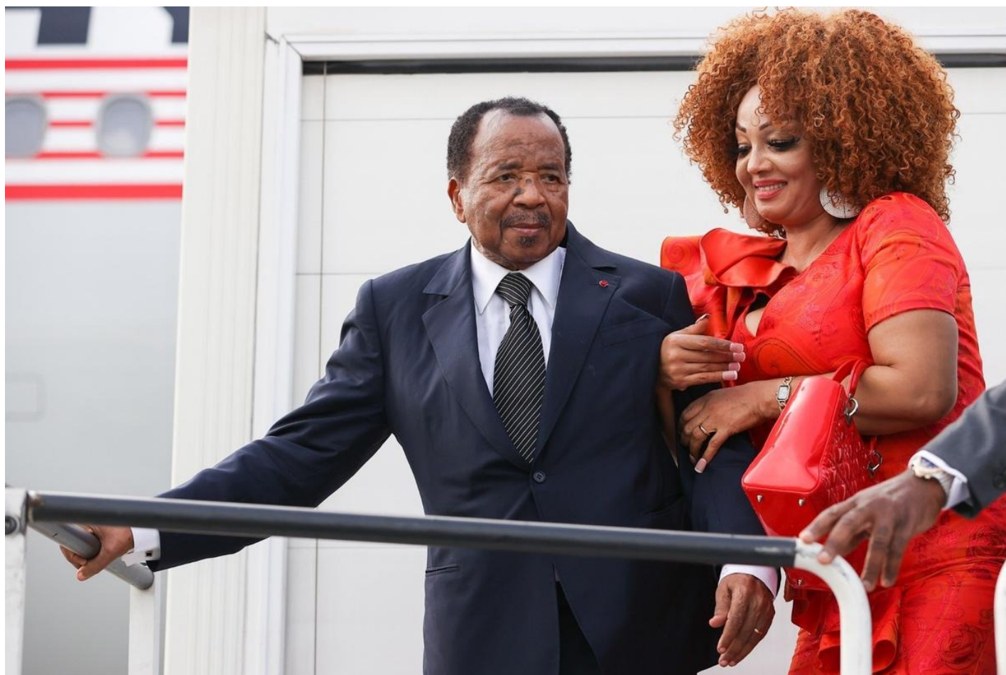
90-летний президент Камеруна Поль Бийя показал свою вторую, более юную половину в аэропорту Пулково, 2023 год.

Тема крайне деликатная. Но если рассматривать ее как политический кейс, то в самом кадровом решении просматриваются два свойства: Путин одобрил назначение своей однокурсницы, и это, безусловно, родовая черта системы cronies , близких лидеру людей; возможно, с точки зрения меритократических принципов кандидат подходила на этот пост, но ей было 70 лет.