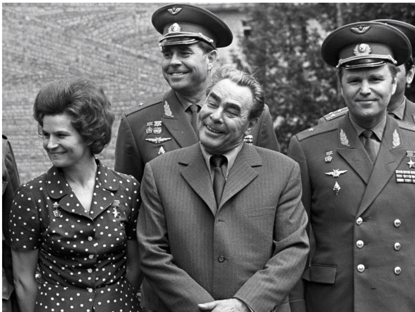
Леонид Брежнев.

Несмотря на осознание долгосрочных проблем в экономике, о чем свидетельствовал закрытый доклад Брежнева на декабрьском (1969 года) пленуме ЦК и некоторые его вполне разумные выступления в начале 1970-х, система сама по себе тормозила любые преобразования — внутри нее находился встроенный блок, отключавший изменения при первых же попытках их внедрить. Этакая невидимая рука не-рынка.