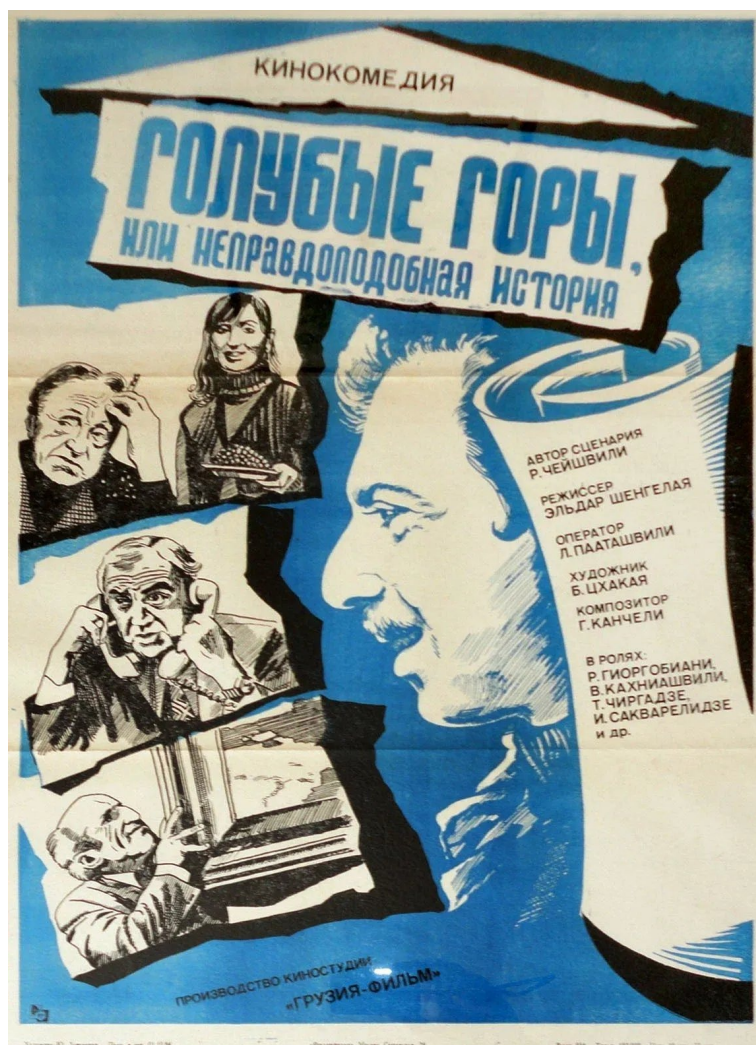
Постер фильма Эльдара Шенгелая «Голубые горы, или Неправдоподобная история».

К брежневско-косыгинским 70-м годам система застоя сформировалась окончательно, доклады о реальном состоянии экономики дальше председателя Госплана Николая Байбакова не проходили, да и то не всегда до него добирались. Академик Владимир Кириллин, давший свое имя алармистскому докладу 1979 года, за вскрытие проблем был вынужден уйти с поста зампреда Совмина СССР. Никто ничего не хотел знать и слушать, дальше постановлений о «совершенствовании планирования» и прочего толчения воды в ступе вроде «экономических экспериментов» никто не шел.