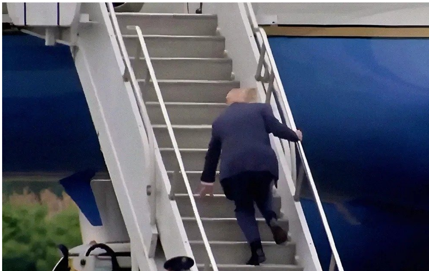
Дональд Трамп. Скриншот с видео

В 2022 году и далее концепция поменялась: на смену технократам теперь должны прийти поколения тех, кому Путин доверяет больше, — окопократы. Они защищали Путина, а значит, Россию, поскольку между Путиным и Россией Кремль разницы не видит. А раз так, значит, именно они заслуживают льгот и привилегий в работе и образовании, а главное — доверия.