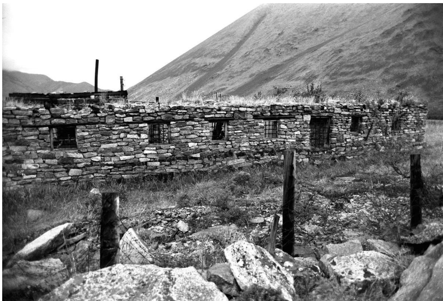
Барак усиленного режима лагеря Бутугычаг на Колыме.

Репрессии 1938 года по масштабу превзошли операции 1937-го. С учетом постоянно увеличивающегося потока осужденных Политбюро было снова вынуждено в срочном порядке отдавать приказ об организации «лесозаготовительных комплексов 2-й очереди»: так были созданы Вятлаг, Усольлаг, Севураллаг, Краслаг, Унжлаг и Онеглаг. Однако и их создание не решило проблемы переполненности пенитенциарной системы. Как это часто бывало с реализацией непродуманных и нереалистичных инициатив такого масштаба, приказ оказался совершенно не подкреплён реальными ресурсами и оперативными возможностями Главного управления лагерей. То, что выглядело гладко на бумаге, в реальности привело к катастрофе.