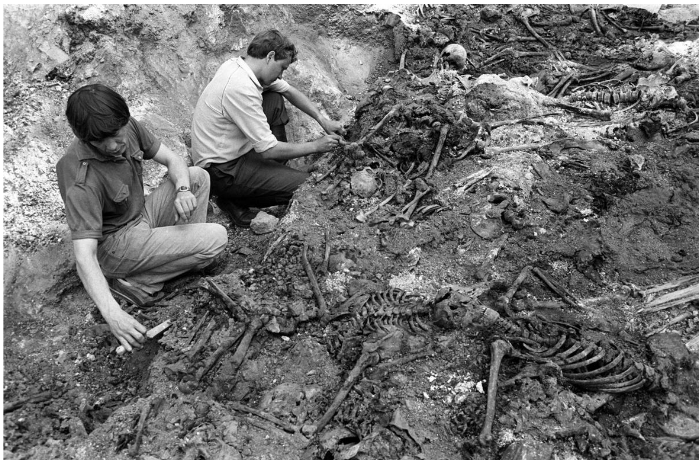
Эксгумация жертв сталинских репрессий.

Любая статистика смертности в тюрьмах и лагерях обретает ясное значение только в контексте сходных величин, заимствованных из мирового опыта. Только тогда появляется некая система координат, в которой все заявления о «катастрофической», «приемлемой» или «нормальной» смертности в тот или иной период перестают быть публицистическими приемами и обретают конкретное статистическое обоснование.