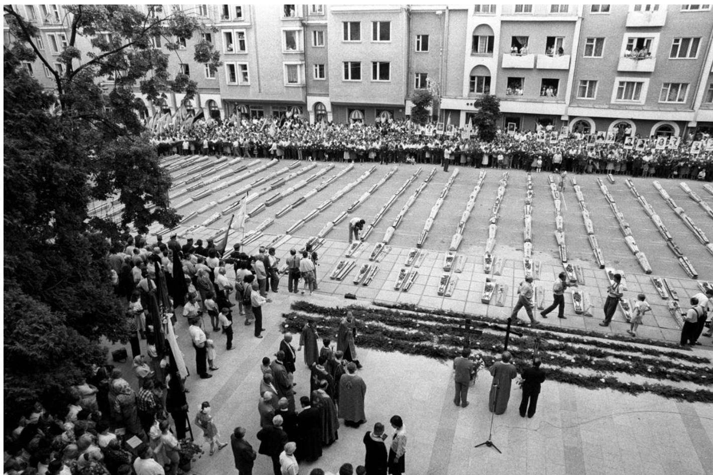
Перезахоронение останков жертв политических репрессий.

На каждый лагучасток было выделено по две тонны вазелина, который использовался как профилактическое средство против обморожения. Комиссия обнаружила несколько сот обмороженных заключенных. О вазелине никто из них не слышал».