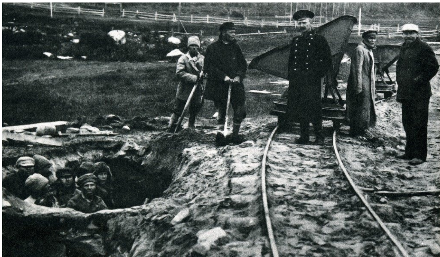
Соловецкий лагерь особого назначения.