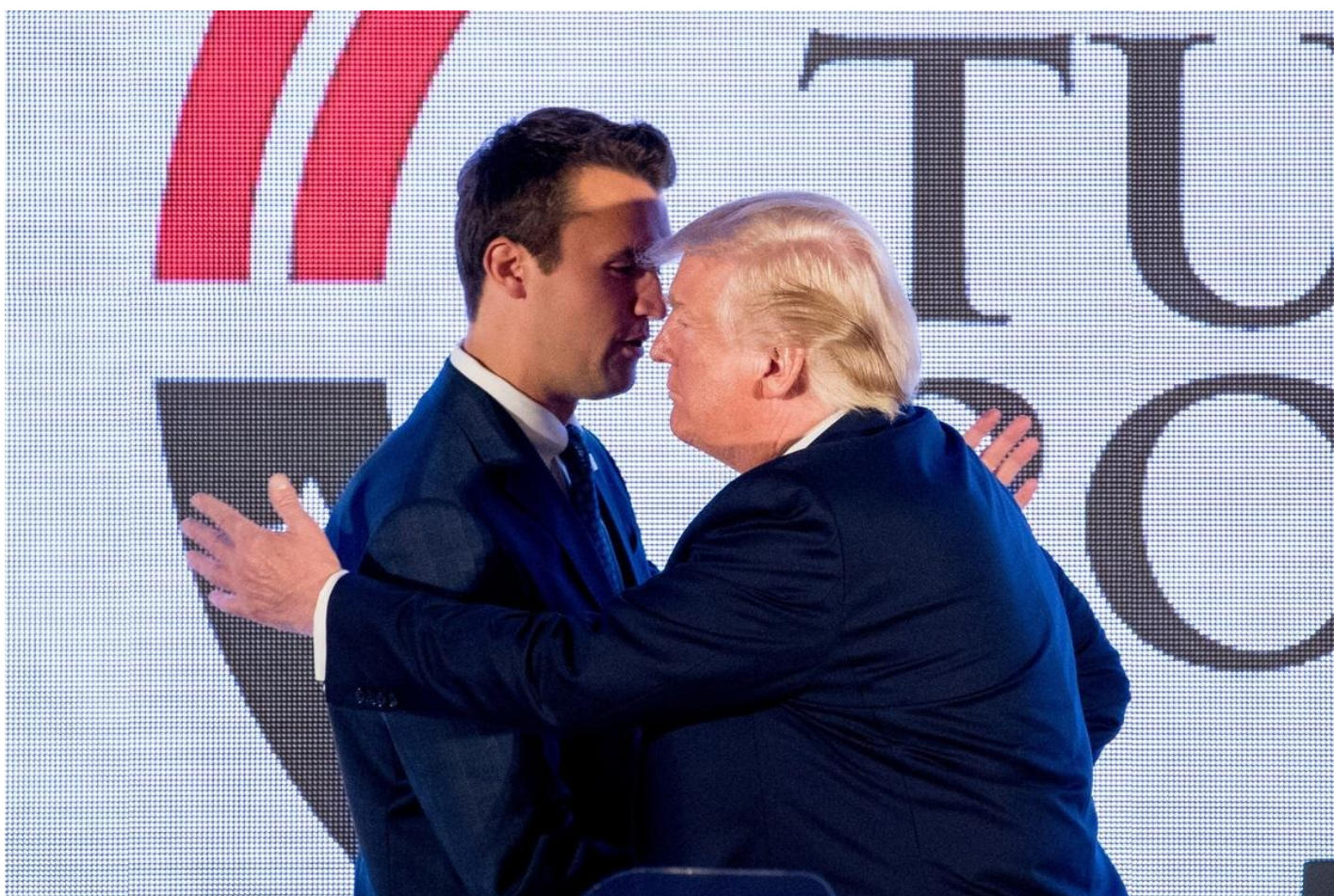
Чарли Кирк и Дональд Трамп.

что архитектурная фирма Кирка-старшего проектировала нью-йоркскую резиденцию президента «Трампа тауэр», а Кирка-младшего не приняли в военную академию, после чего он забил на высшее образование и при этом весьма преуспел.