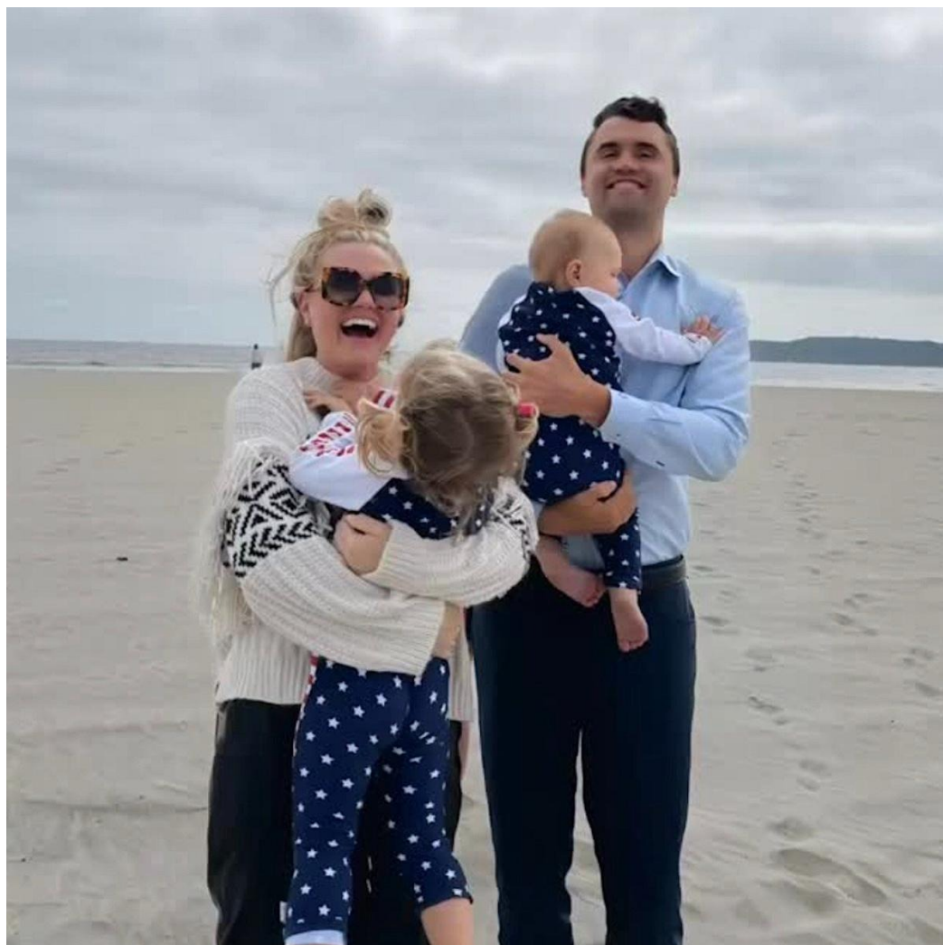
Чарли Кирк с женой и детьми.

Американские правые немедленно подумали на левых. Левые обиженно потребовали дождаться результатов следствия и напомнили случаи, когда по ним стреляли правые.