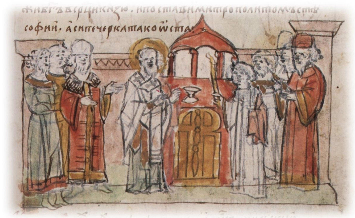
Поставление Ярославом Владимировичем Киевским в Софийском соборе Илариона митрополитом на Руси.

борьбе с центральной киевской митрополией закрывает храмы и отменяет богослужения, а также конфискует у несогласных имущество и подвергает их пыткам. Впрочем, киевский митрополит отвечает подобным же образом, и когда мятежный епископ все же попадает в его руки — приказывает отрубить ему правую руку, лишить языка и ослепить.