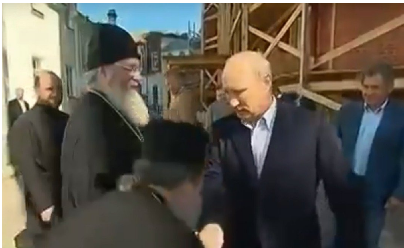
Целование руки Владимиру Путину на Валааме. 2012 год. Скриншот из видео

Он оказался самым радикальным по последствиям, породившим религиозный раскол и ставшим, наверное, первым существенным нарушением единства «народной среды».