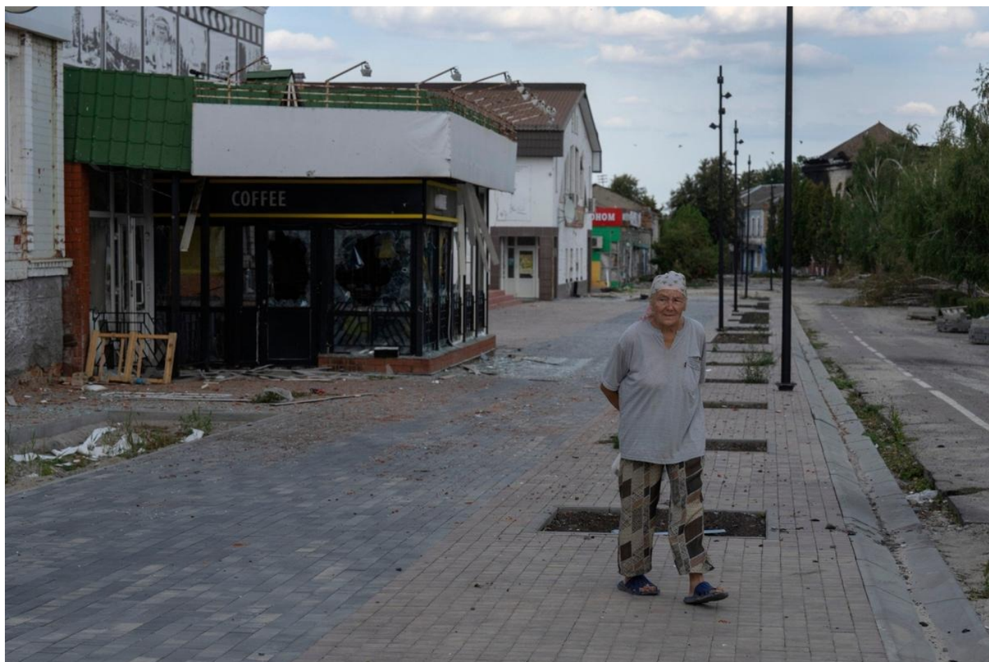
Суджа. Местная жительница на одной из улиц города.

С водой сначала было туго. Ходили с сыном брать ее к мосту. Там река с проточной водой, по щиколотку. Мы кружками набирали воду в бутылки, потом приходили домой помыться. А еще... Там же головастики в море. Через штору процеживали эту воду, чтобы пополоскать белье. Не с головастиками же стирать.