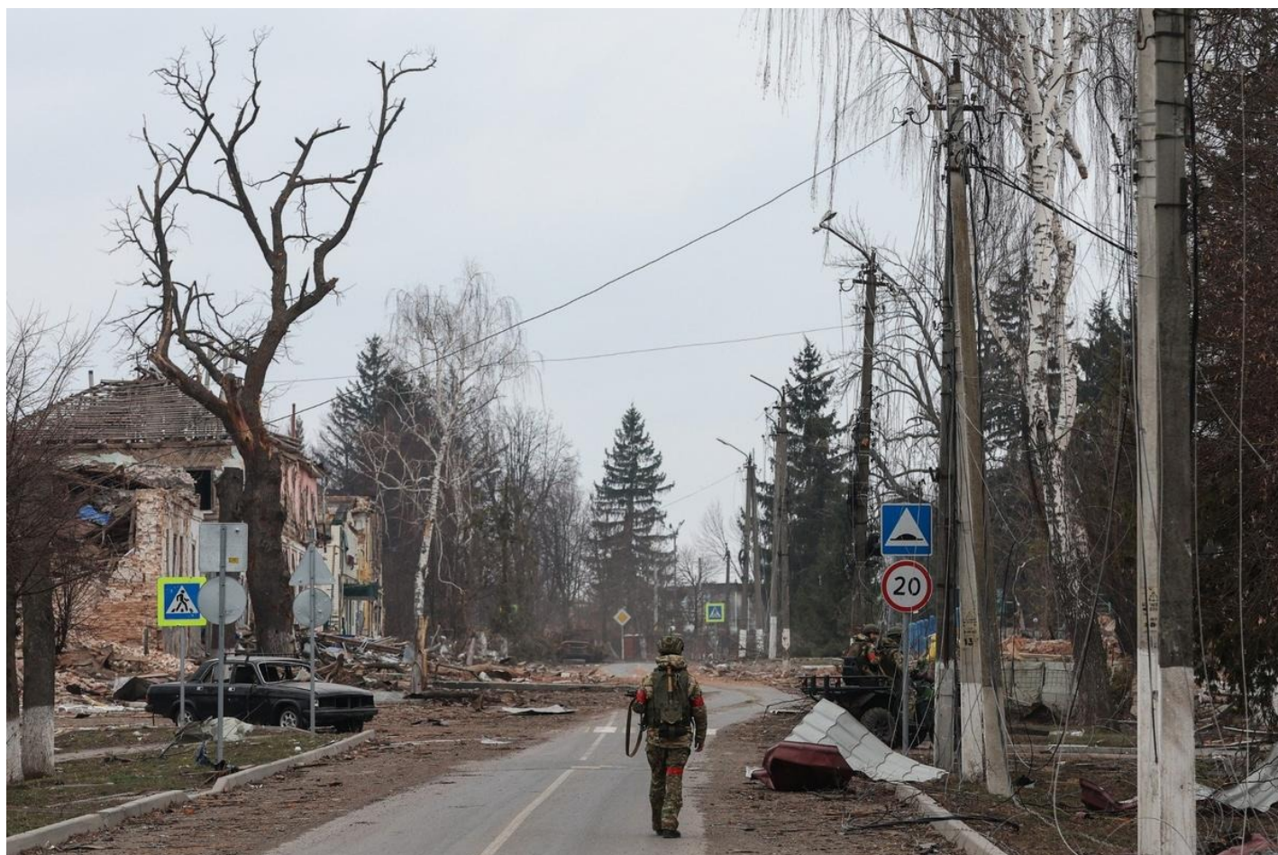
Суджа.