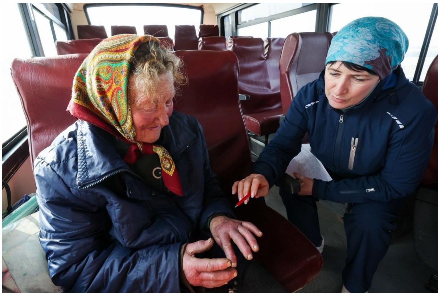
Март 2025 года. Женщина из Суджи и сотрудница Центра медицины катастроф во время эвакуации.

Когда во двор Дома Советов заехал танк и начал бить по нашим стенам, произошло очень сильное задымление. От страха все забились в коридор подвала. Стояли, как селетки в бочке. Дроны жужжали, как рой пчел. Военные сказали, что им с нами оставаться нельзя, это опасно для гражданских. Дроны засекли военных. В последний момент солдаты раздобыли для нас печенье, колбасу, в магазине нашли немного бутилированной воды. А сами забрали раненых и ушли, обещая навестить нас, когда все закончится.