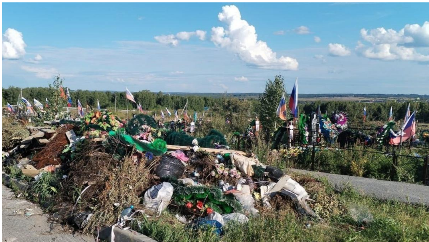
Ачинск, Красноярский край городское кладбище, могилы участников СВО (с флагами) и мусор. Август 2025.

Неразвитость. Критического мышления нет. Отсутствие инстинкта самосохранения на начальном этапе. Больше не берусь за эти дела. Хватит.