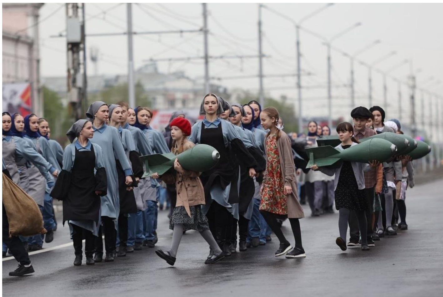
На параде в Красноярске 9 мая 2025.

срочников, мобилизованных), но парня по семейным обстоятельствам со службы не увольняют. Он приходит ко мне: давайте обжалуем бездействие. Полетели вместе в суд. Нам по итогу отказали, но судья запросил документы, которые нам помогли. Мы понимали, что нам откажут, но движение пошло. И потом мне звонит какой-то очень большой начальник, говорит: дело на контроле в Генеральной прокуратуре. Хотим разобраться и помочь. Предлагает такой вариант: подписывайте контракт, и мы тут же его увольняем — лазейка только тут. Нужен контракт. И я верю ему. Что они это сделают. Он меня 11 минут убеждал: «мы проконтролируем, слово сдержим». Я рекомендую парню согласиться. А он — «нет, я им не верю. Я контракт подпишу, а меня кто-то в этой цепочке может кинуть».