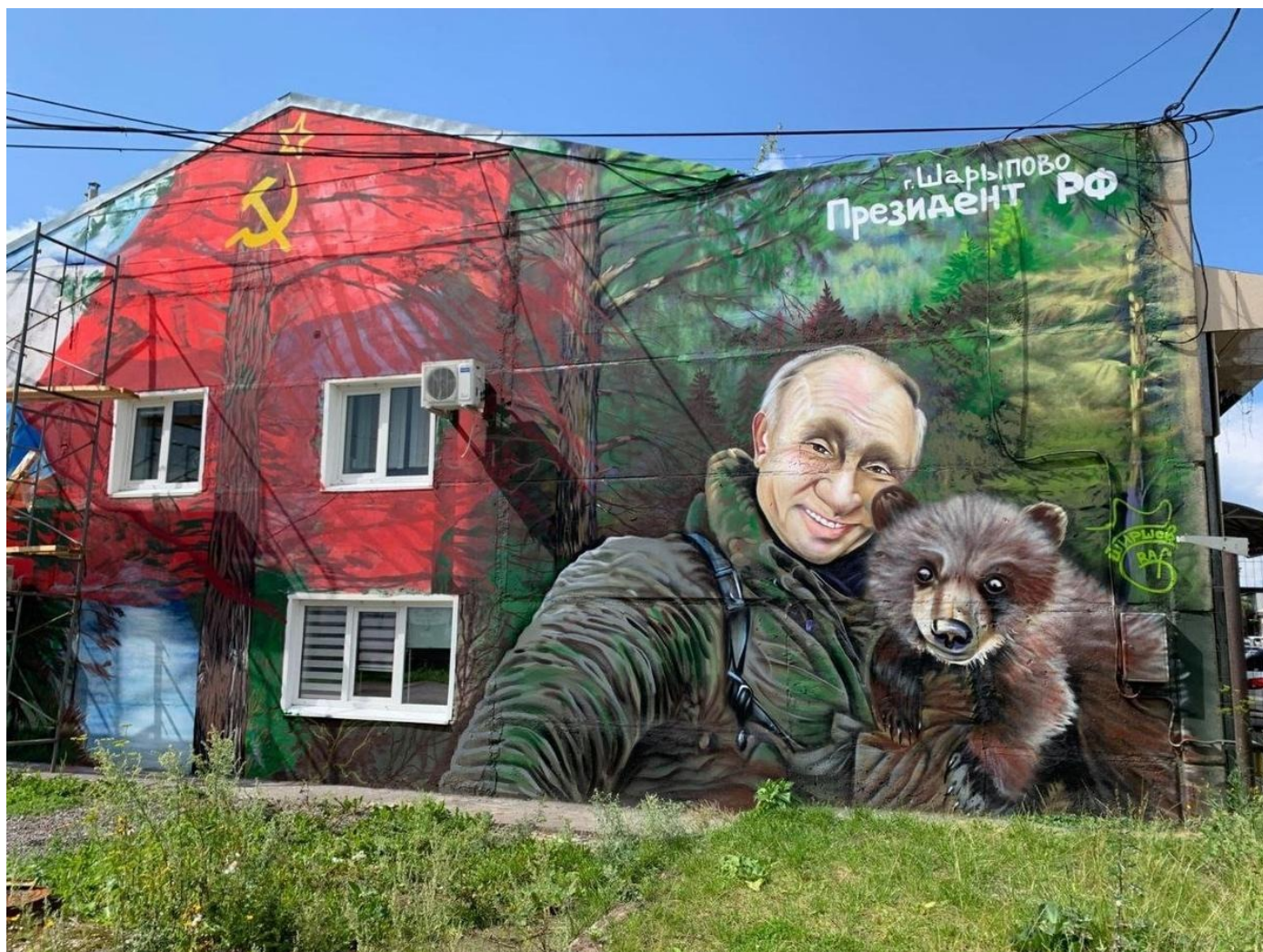
Шарыпово, Красноярский край. Август 2025 года.