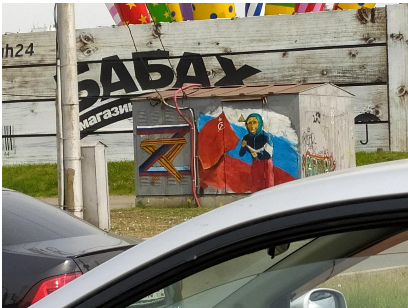
Улица 9 мая, Красноярск.

Я эксперт в этом вопросе, у меня в армии тоже случилась самоволка. Сидел на гауптвахте, выручил оттуда комбат, майор Балакирев. А дивизионный особист обещал мне дисбат. Дисциплинарного батальона («дизеля») боялись: репутация у него была хуже, чем у тюрьмы. Но про саму тюрьму, какого бы рода происшествия в нашей дивизии ни происходили, никто — ни командиры, ни мы — даже не заикался. Это были другие пространства, другая физика там, этого не желали даже злейшим врагам. А сейчас — вот так. (Понятно, что дисбаты сейчас вроде как и ни к чему — в них оружие не выдают, куда их...)