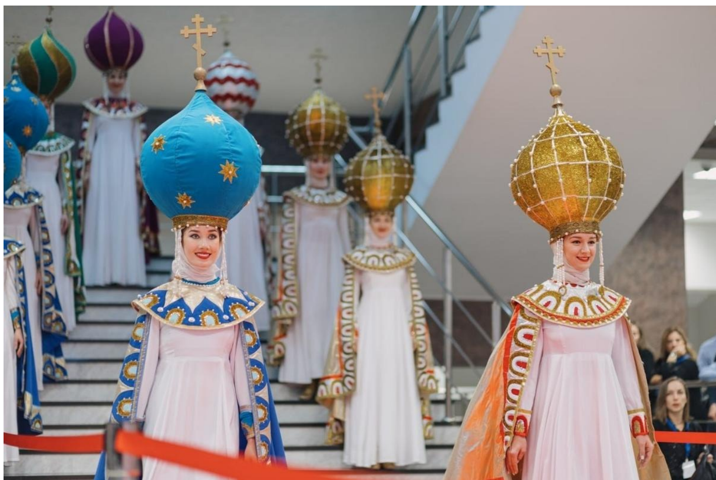
Красноярский городской форум.

Зэчье и кадровые военные почему-то оказались в одном ряду. Культура посадок изменилась радикально. Новые составы преступлений, особый контингент. И в тюрьму... просят. И она выглядит для многих теперь самым честным местом. А прежде армии доверяло большинство страны, больше, чем церкви, больше, чем всем другим институтам и структурам (87% в 2016 году).