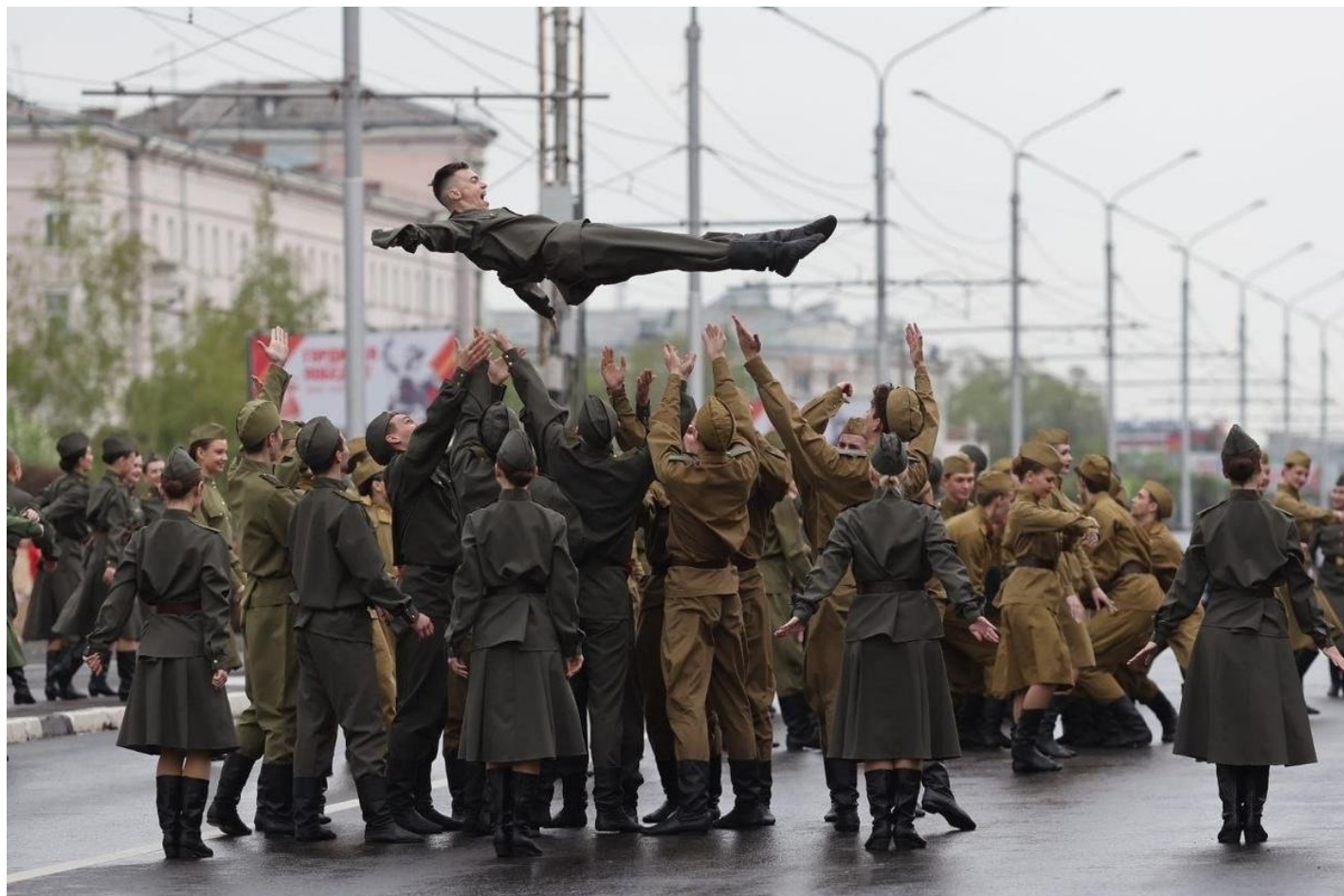
На параде в Красноярске, 9 мая 2025.

О сочниках и их возвращении «за ленту»: военные юристы называют это алгоритмом. Адвокат Х. говорит, что с 2022 года оказал юрпомощь 950 военнослужащим и их близким, при этом «довольно часты обращения по СОЧ». Явок с повинной, очевидно, пишут немало. И некоторые дела даже, судя по картотекам гарнизонных военных судов, рассматриваются. А судя по письмам из СИЗО и колоний, вербовщики теперь спрашивают о желании пойти на СВО и у тех, кому закон туда идти не позволяет, — у получивших приговоры за терроризм, экстремизм, госизмену. В итоге их в войска не забирают (по крайней мере мне неизвестно о подобном), однако это еще одно важное свидетельство того, как работает госсистема: установка спущена, и каждый на своем участке пытается выдать лучший