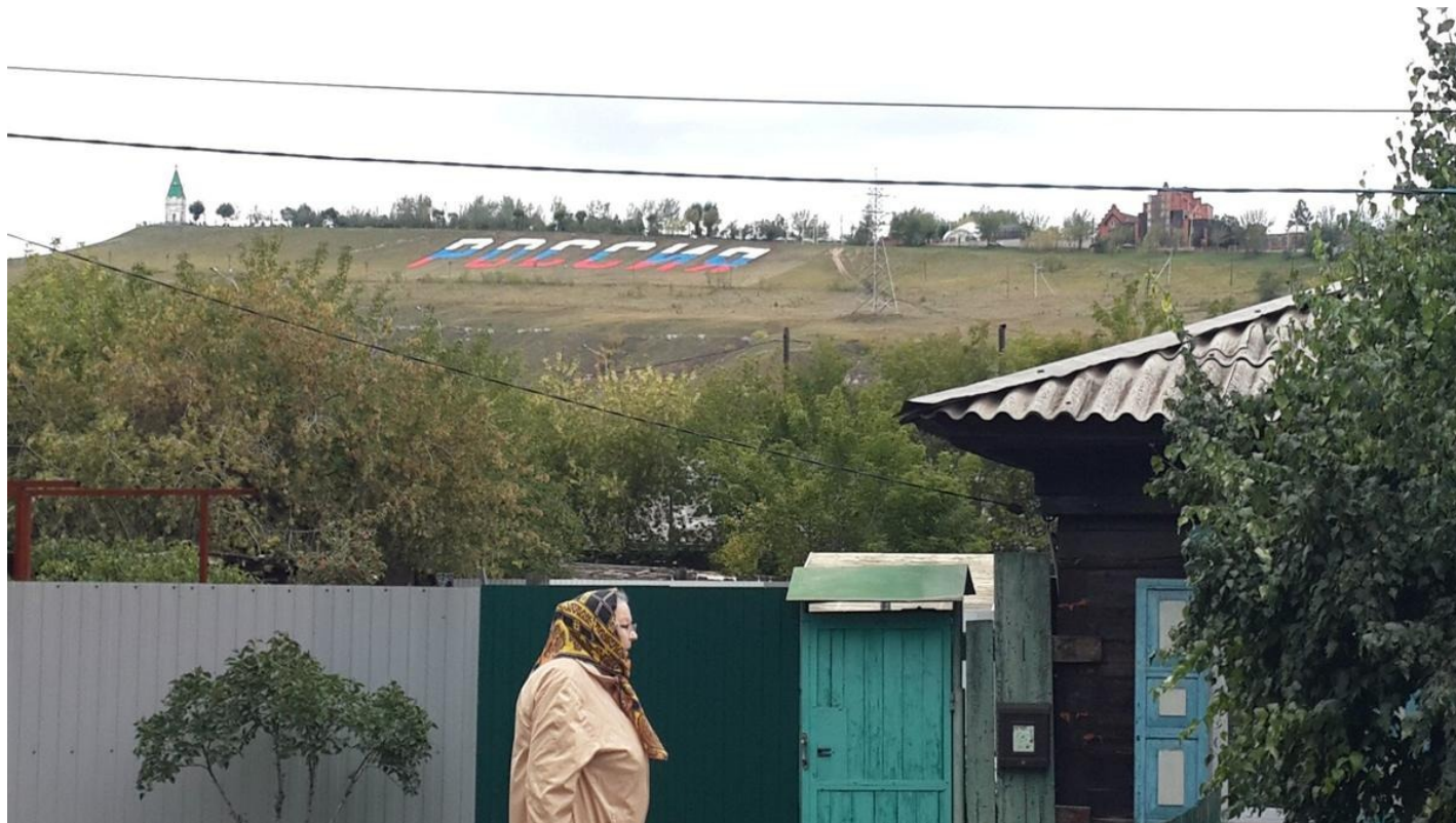
Улица Коммунистическая, Красноярск.

Внутренние органы — на разрыв. Суд, тюрьма тоже переживают крутые перемены. Вероятно, справятся, иначе не бывает, и речь, в общем, не о них. А о проходящих через них или только мечтающих пройти через них, чтобы изменить судьбу, потоках людей. О выгорающих адвокатах — с их абсолютно бессмысленной эмпатией в совершенно неожиданных местах и обстоятельствах.