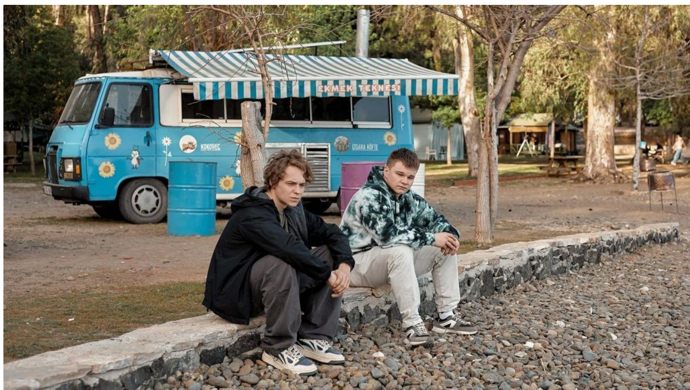
Кадр из сериала «Пингвины моей мамы» (2 сезон)

«Пингвины моей мамы — 2». Второй сезон одного из лучших российских сериалов — с 14 ноября на платформе KION