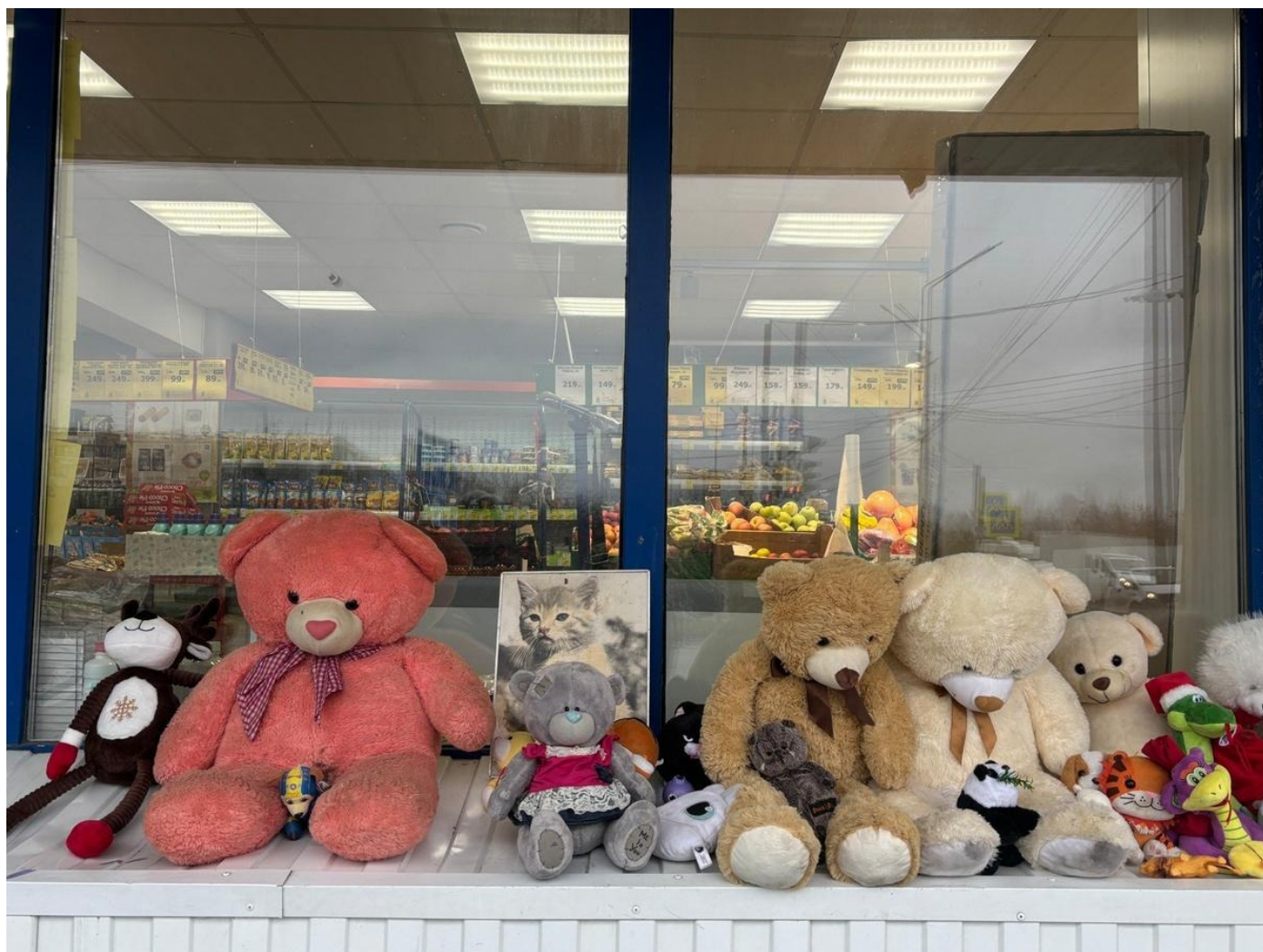
Мемориал на месте трагедии.