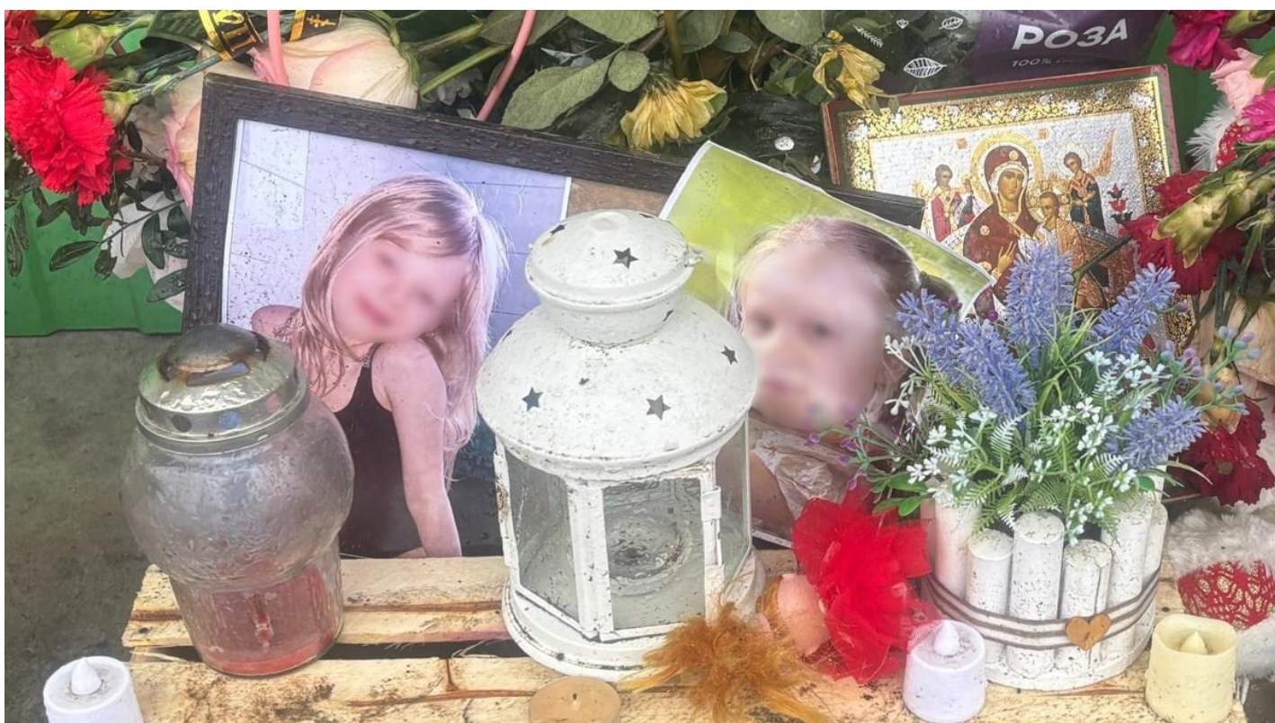
Портреты погибших девочек.

Репортаж из уральской Ревды, где пьяный участник СВО убил двух школьниц