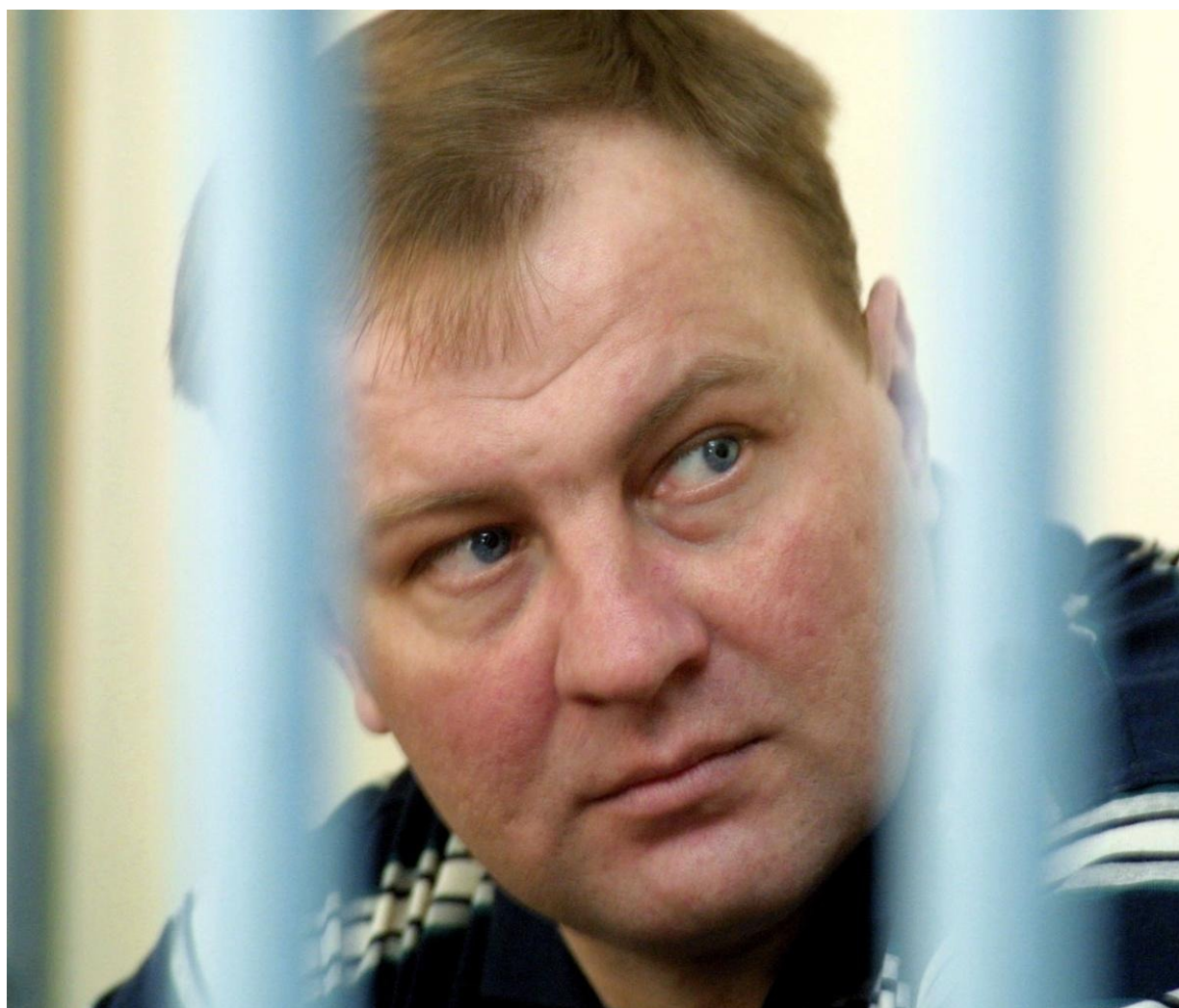
Буданов в суде.

Нет, он это просто выдумал через полгода; точнее, его научил адвокат. Да и не допрашивал он её совсем.