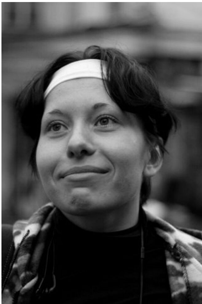
Анастасия Бабурова.