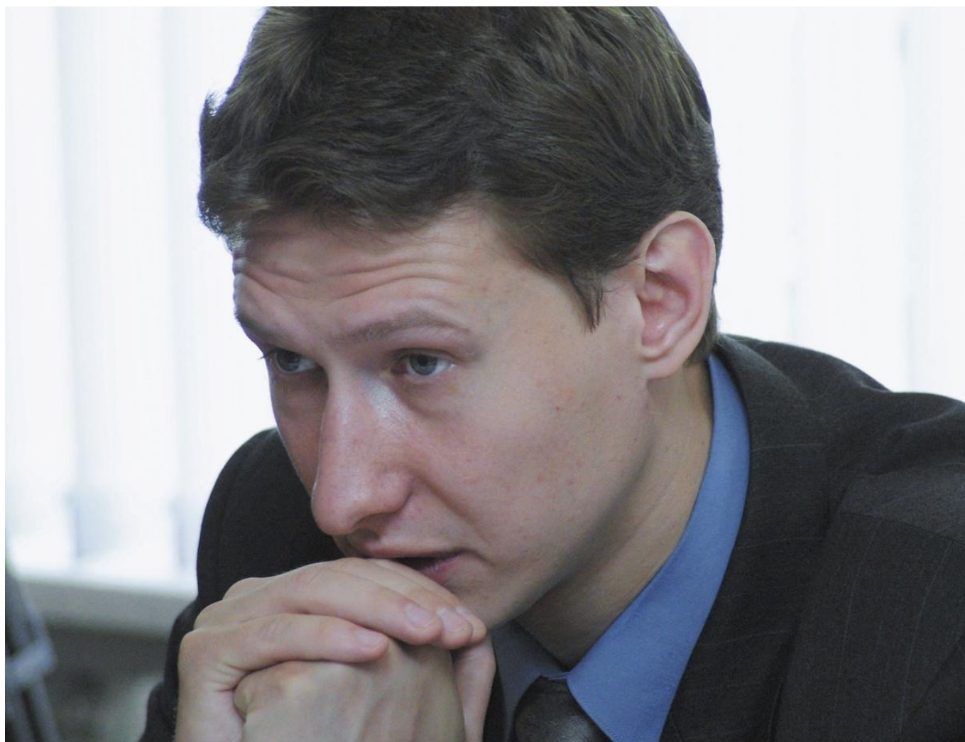
Станислав Маркелов.