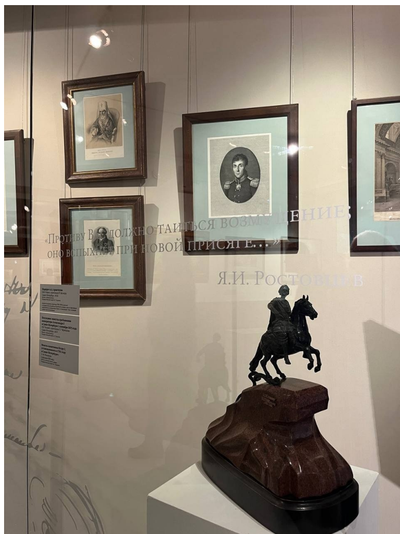
Выставка «Декабристы: Люди и судьбы».

Любой посетитель, глядя на понесших жестокое наказание смутьянов, видит рядом с ними и себя. Намек? Предупреждение? Ощущается, как и то и другое вместе.