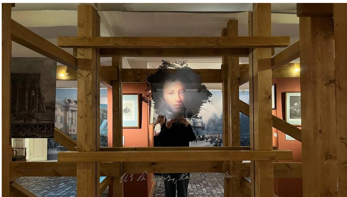
Выставка «Декабристы: Люди и судьбы».

Испуганный юбилей: почему 200 лет декабристов рассматривали с точки зрения «иноагентства» и пенитенциарной системы