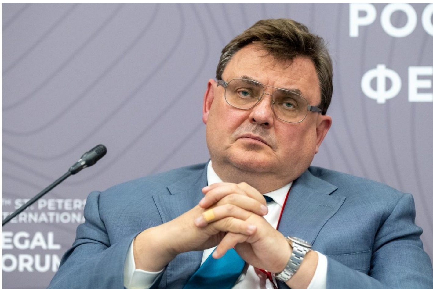
Константин Чуйченко.

Прямо скажем, министр не первый раз обращается к теме декабристов. На прошедшем Петербургском международном юридическом форуме он уже рассуждал о наследии декабристов, сделав тогда упор на неуместности западных моделей развития в российском контексте. Теперь же он развил и углубил эту мысль, сделав три важных вывода.