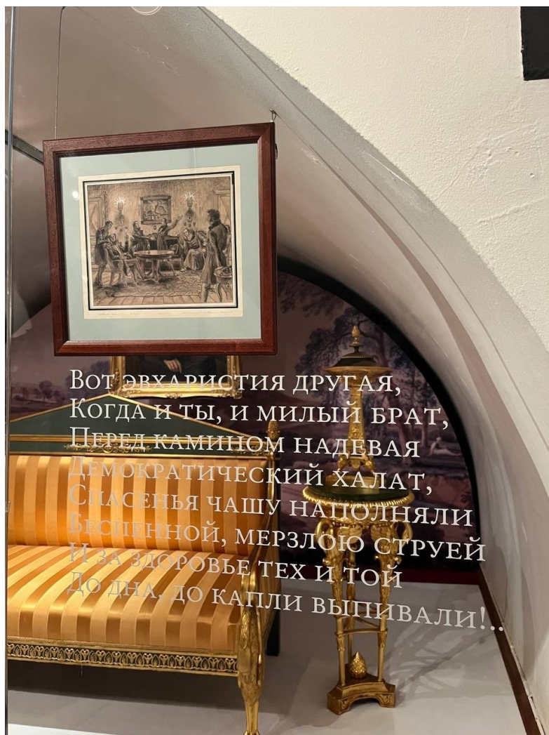
Выставка «Декабристы: Люди и судьбы».

Пока же специалисты потихоньку обсуждали все эти узко профессиональные аспекты осмысления декабристского наследия, широкой общественности под юбилей решили все же показать сериал «Союз Спасения», который был снят в 2021 году как развернутая версия одноименного фильма, с успехом прошедшего по экранам страны за пару лет до этого.