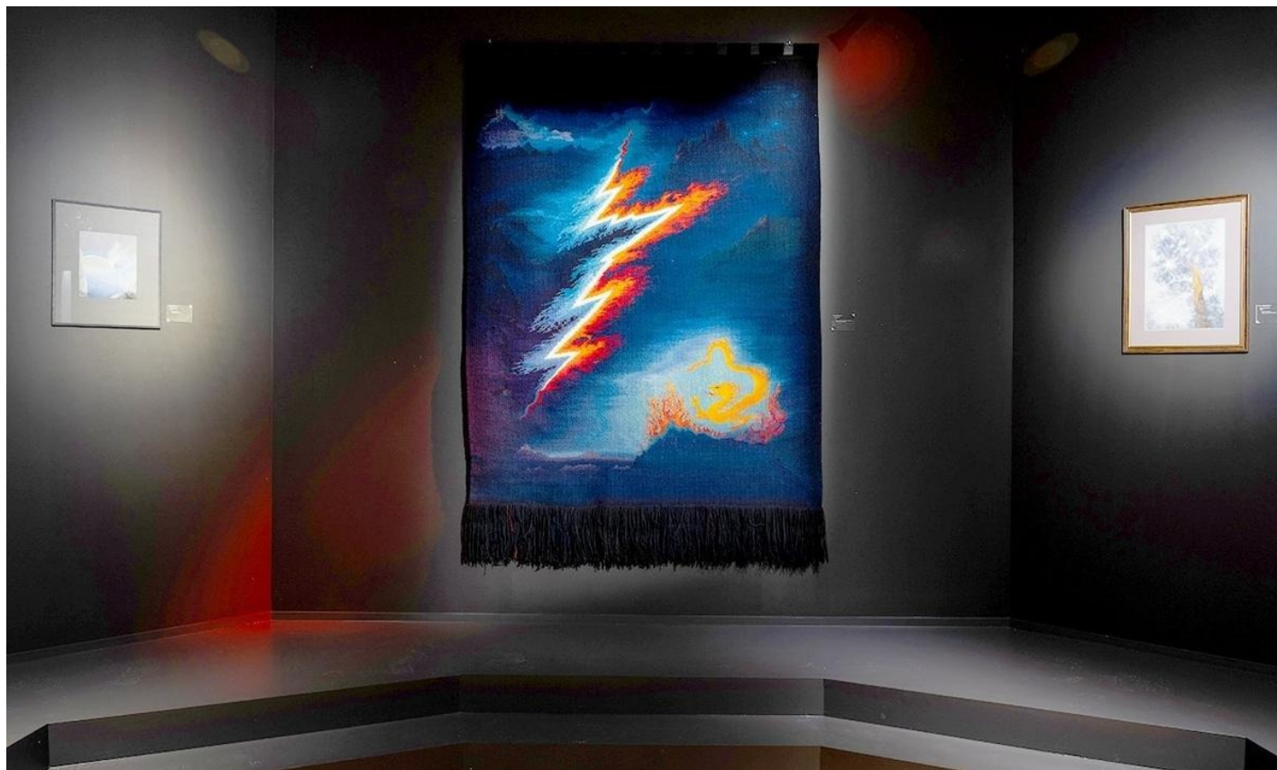
Выставка «Темная Оттепель»

партитур на произведения Скрябина, Стравинского и Дебюсси, а также приставка к ламповому телевизору «Электронный художник», с помощью которой каждый посетитель выставки может попрактиковаться в создании визуальных образов.