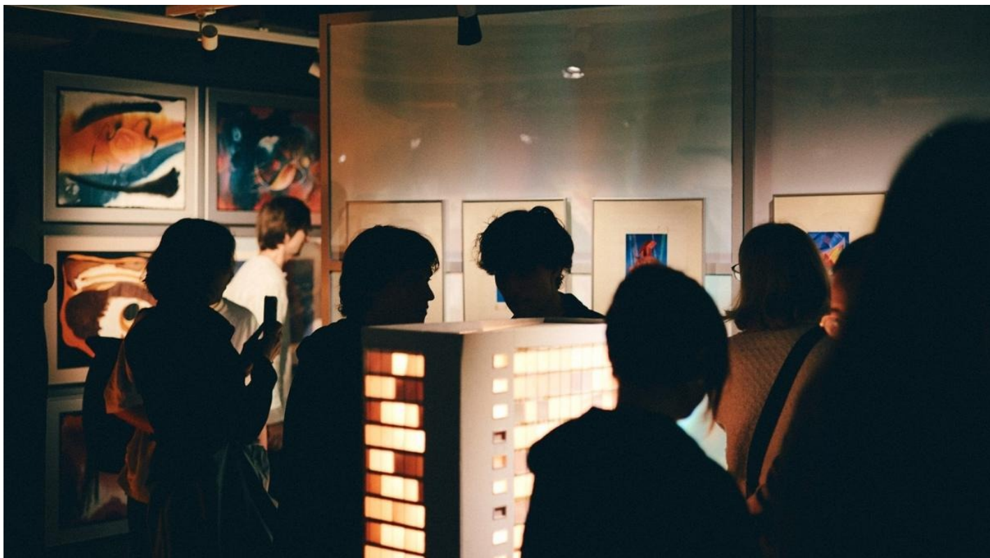
Выставка «Светлая Оттепель»

О «темной» и «светлой» Оттепели в Центре Вознесенского