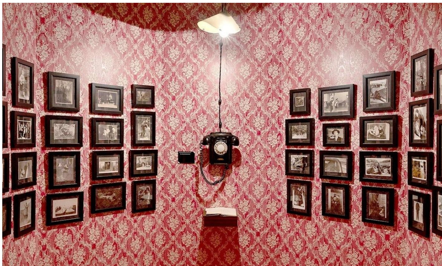
Выставка «Темная Оттепель»