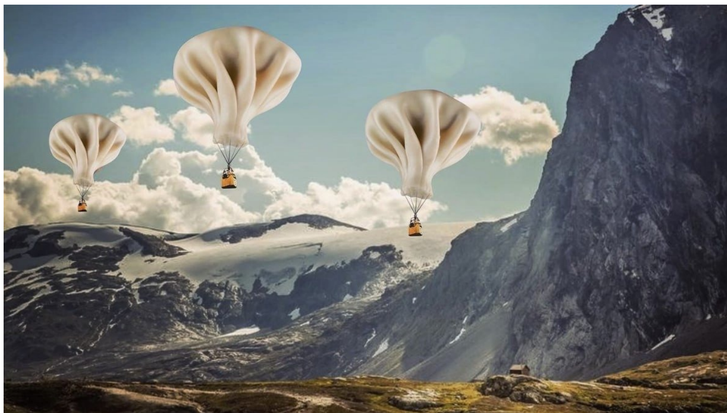
Рекламные листовки ресторана грузинской кухни «Нино-Вано». Фото: соцсети